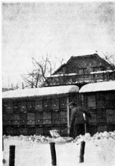
Pred čebelnjakom je treba sneg skrbno odmetati. Na sliki čebelar Albin Tomšič iz Sp. Kašlja pri Ljubljani

prezimujejo. Vsi so si v enem pogledu edini: Panji dobro prezimujejo tam, kjer podnebje ne dela visokih in nenadnih toplotnih skokov. Čim hitreje se menja zunanja temperatura, tem več medu porabijo čebele. Vsak ropot povzroči takoj višji ton, čebele glasneje zašume — posledica tega pa je povečana poraba medu. Najugodnejše so čebele prezimile v zatemnjeni suhi kleti s stalno toplino med 5 in 7° C. Poraba medu je bila minimalna, mrtvic je bilo izredno malo, zdravstveno stanje izborno. Le žal, da si ne more vsak čebelar zgraditi take kleti!