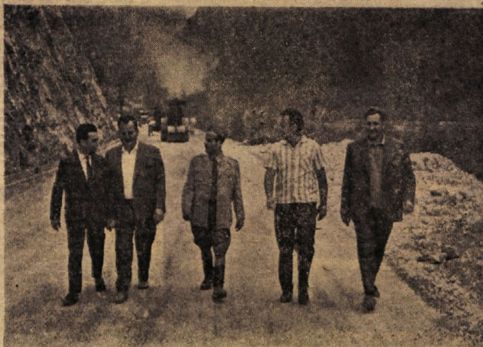
Gostje na odseku Zasavske ceste, ki je že skoraj narejen za asfaltiranje