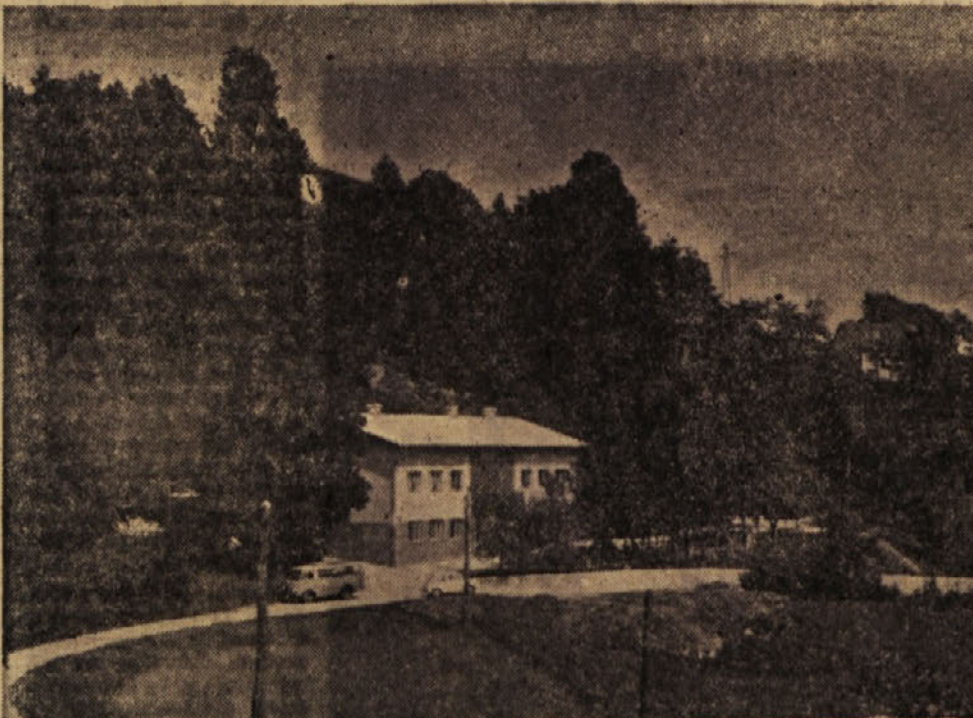
Klek — priljubljena izletniška točka Trboveljčanov (na sliki Dom I. Čečeve)

Izvršni odbor ObO SZDL Trbovlje je na zadnji seji razpravljal tudi o nekaterih vprašanjih v zvezi z ustanavljanjem in delovanjem družbenih centrov. Občinski odbor SZDL Trbovlje je doslej izdelal že dve analizi o družbenih centrih, zdaj pa je potrebno, da bi ugotovitev analiz uskladili z urbanističnim načrtom Trbovelj, ki naj bi nakazal perspektive družbenih centrov v okviru posameznih krajevnih skupnosti. Izvršni odbor občinskega odbora SZDL Trbovlje je sklenil, da bo predlagal občinski skupščini, da zagotovi, da bodo investitorji stanovanjske izgradnje urejevali tudi prostore za družbeno življenje občanov istočasno pa tudi prostore za otroško varstvo in objekte za rekreacijo občanov. (a)