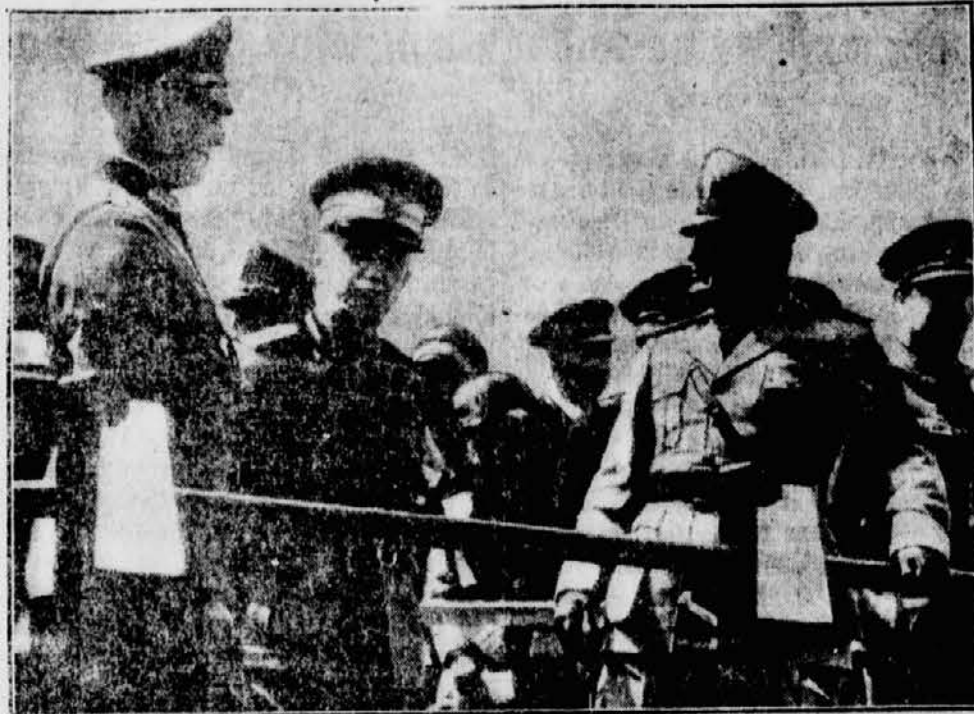
Das Bild zeigt (von links) den deutschen Gast zusammen mit dem König und Kaiser bei der Beobachtung eines Gefechtsübungs