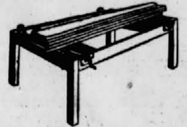
Der neue, praktische Arbeitstisch mit den losen Brettern und der Spannvorrichtung.

× Der Verband der Gastwirteinnungen Sloweniens hält seine Jahreshauptversammlung am 1. Juni in Logatec ab und nicht Mitte Mai, wie ursprünglich beabsichtigt wurde.