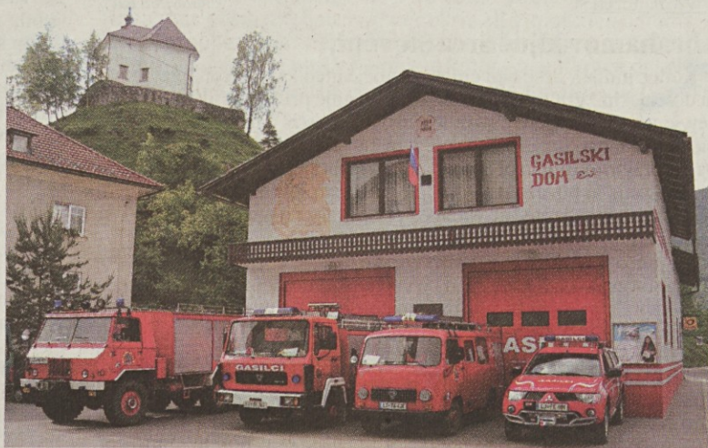
Prenovljena zunanost gasilskega doma in vojni park leta 2009.

gasilske brizgalne in priprava dokumentacije za gradnjo gasilskega doma. Tako so se v leto 1930 podali z drznimi načrti, gasilska brizgalna je takrat stala 32.500,00 din, o tem, kako visoka vsota je bila to za tiste čase, pričča višina zbranih članarin, ki je znašala 1.400,00 din in seveda brez pomoči takratnih občin bi bil nakup neizvedljiv. Članstvo se je še istega leta pogumno odločilo tudi za gradnjo gasilskega doma, ki je svoje mesto našel na cerkvenem svetu poleg šole. O takratni zagnanosti pove vse podatek, da se je gradnja doma začela v začetku aprila, dela so bila končana 4. maja in 6. junija je bila pred novim gasilskim domom že prva velika vrtna veselica s sreče-