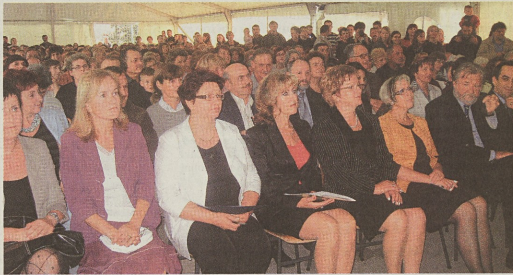
Slovesnosti so se udeležili vsi vidnejši predstavniki kamniškega šolstva in občine.