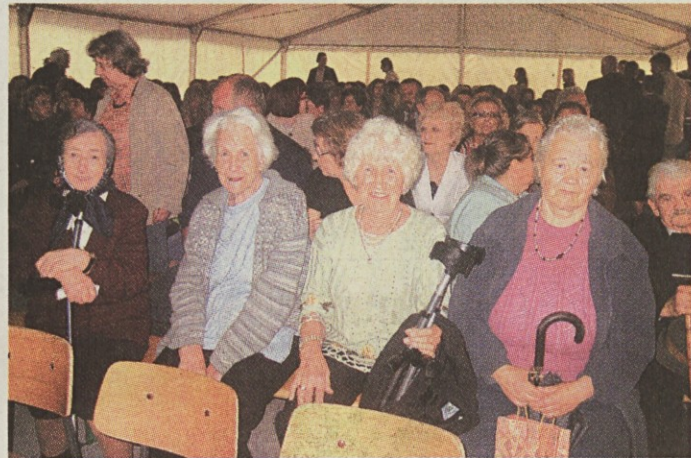
Prireditelj ob obletnici šole je bila prijetna priložnost za druženje nekdanjih učencev.

Visoka obletnica je bila prilika tudi za pregled zgodovin-