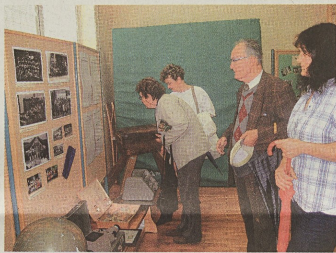
V prostorih šole je bila na ogled razstava starih predmetov in fotografij.

župnijske šole, preko samostojne ljudske in osnovne šole do današnje podružnične šole. Motniške učence poznamo pod imenom Motniški Polžki. Čeprav jih je v šoli malo, so skupaj s starši velika družina in skupaj načrtujejo in izvedejo marsikatero dejavnosti. Tudi sama sem svojo šolsko pot začela prav s poučevanjem v Motniku in takrat sem ugotovila,