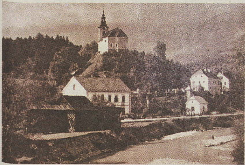
Gasilski dom v Zg. Stranjah zgrajen leta 1930.

Tehnični razvoj društva se je okreplil po letu 1970, ko so pridobili prvo motorno vozilo – kombi IMV, v teh letih se je društvo lotilo tudi gradnje novega doma in 10. junija 1978 je bila svečana otvoritev novega gasilskega doma. Po aktivnostih in zagnanosti bo v zgodovino društva zagotovo ostalo zapisano tudi leto 1995, ko je društvo dokončalo zadnjo fazo gradnje gasilskega doma in del objekta oddalo v najem Pošti, ki je tako pridobila nov poslovni prostor. Poleg zaključnih del