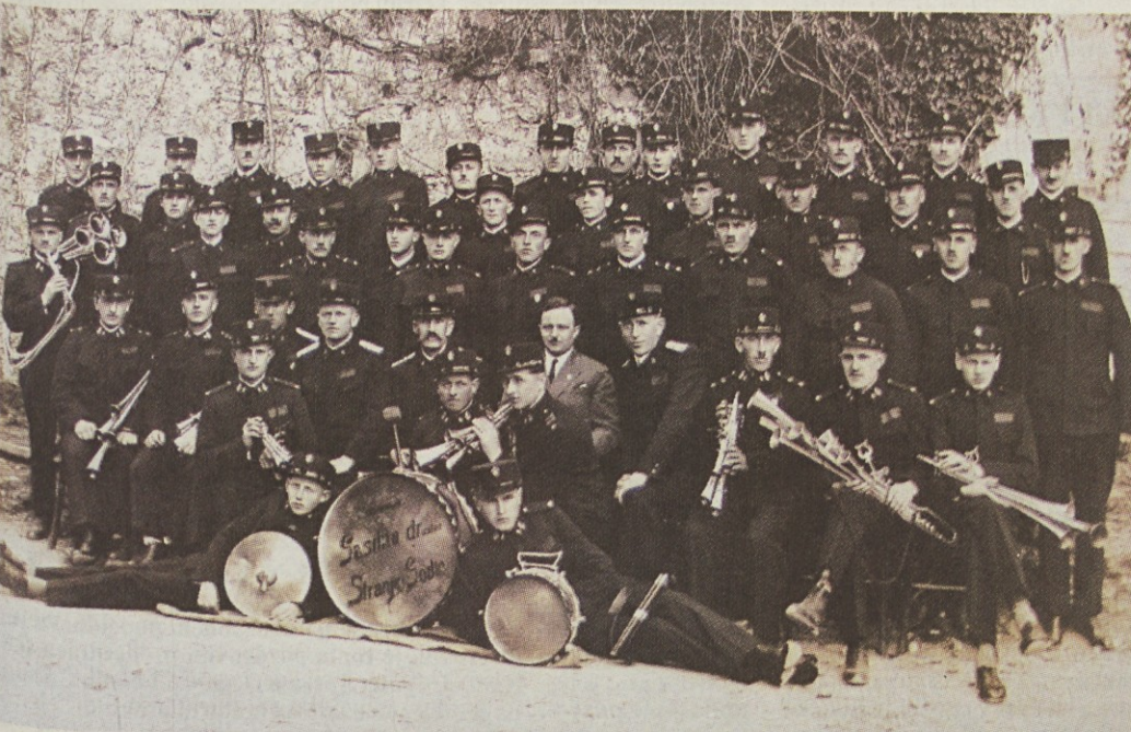
Prvi uniformirani člani gasilskega društva leta 1930.