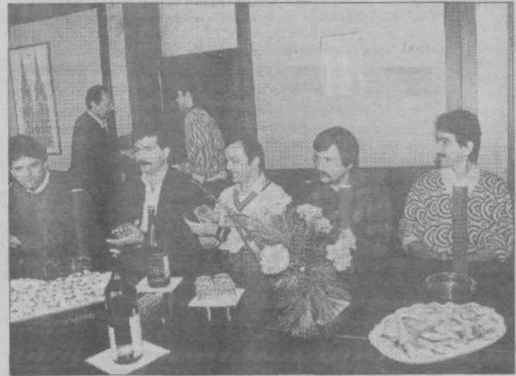
Prizor s kraje slovesnosti, na kateri so prvimi udeležencem Žitove interne pekarske šole izročili potrdila o uspešno opravljenem preizkusu znanja.

Šolanje v Žitovi pekarski šoli je trajalo tri mesece, štiri tedne je bilo namenjenih teoriji. Učitelji so bili iz Žita; teorijo so jim razlagali delavci iz oddelka za razvoj in raziskave, prakso pa so opravljali pod vodstvom Žitovih pekarskih mojstrov z bogatimi delovnimi izkušnjami. Čeprav so se sprva nekateri delavci le stežka odločili za šolanje, med njimi so bili namreč tudi taki, ki imajo že petnajst in več let delovnih izkušenj, pa zdaj, ko je večina iz prve skupine uspešno prestala preizkus znanja, bojazni ni več. S 15. februarjem bo pričela šolanje že druga skupina Žitovih delavcev, ki nimajo ustrezne kvalifikacije za pekarski poklic, ki ga sicer opravljajo.