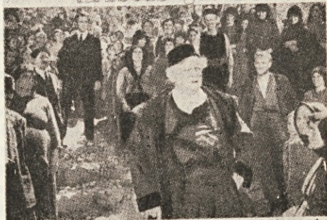
"On ni več moj sin!"