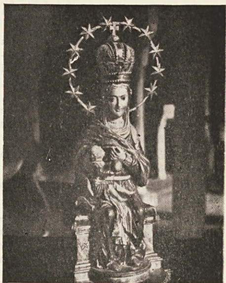
Milostni kip Matere božje v kripti krške stolnice