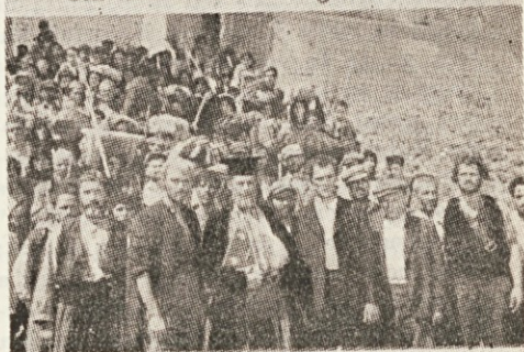
Z OČI V OČI Z DRAVI

vloge. Pa še ne smejo; popova roka jih odvrne od lačnih bratov. Tu je šele začetek konca.