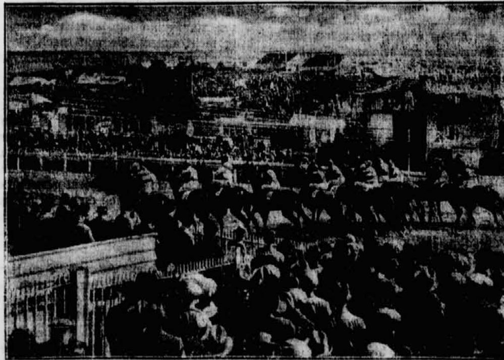
In Epsom wurde vor Tausenden von Zuschauern das Große Metropolitanrennen durchgeführt, das wieder ein wahres Volksfest wurde. — Das große Feld unmittelbar nach dem Startschluß im Hauptrennen.