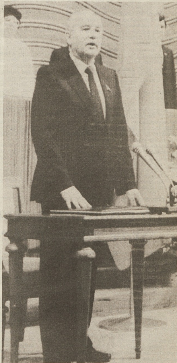
Gorbačov med včerajšnjo svečano prisego pred ljudskimi poslanci

Po 72 letih pa se je nakopičilo toliko problemov, da bo njihovo reševanje izredno težavno. Zgovoren je podatek, da nihče točno ne ve, koliko je katoličanov v Sovjetski zvezi. Po približnih ocenah jih bi moralo biti približno 13 milijonov. Ta podatek se nanaša izključno na evropski del Sovjetske zveze, kako je v Sibiriji in v osrednjeazijskih republikah pa ni niti neuradnih podatkov. Nedvomno pa bodo največje težave v zvezi z usodo uniatov v Ukraini in Belorusiji, kjer se pravoslavje noče odreci svojemu »monopolu«. V Litvi bodo predvsem politični zaplet, ker bo ta republika sedaj zahtevala svojega nuncija.