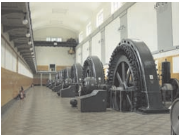
Slika 3: Prenovljena strojnica. Renewed power house.