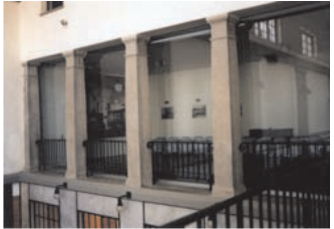
Slika 7: Prenovljena stikalnica, pogled iz strojnice. Restored control room, view from the generator room.