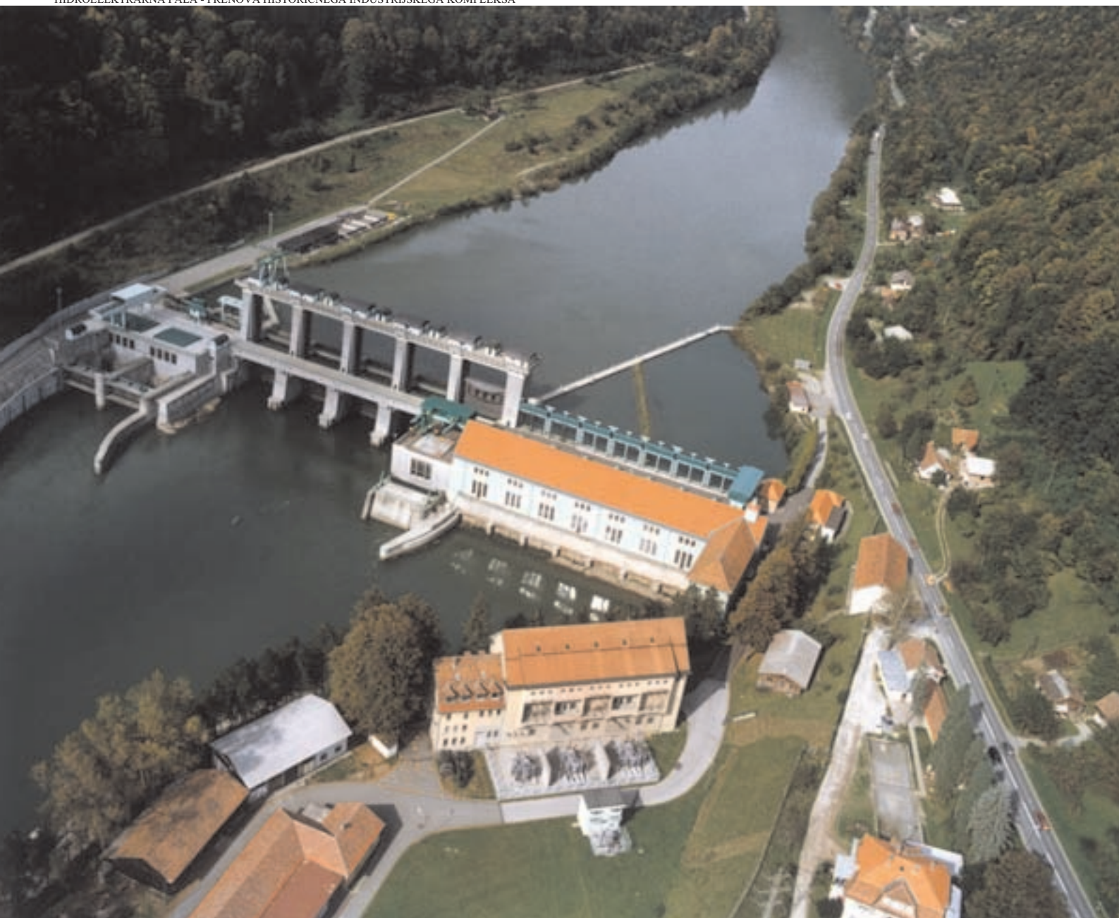
Slika 2: Zračni posnetek elektrarniškega kompleksa. Aerial view of the power plant complex.