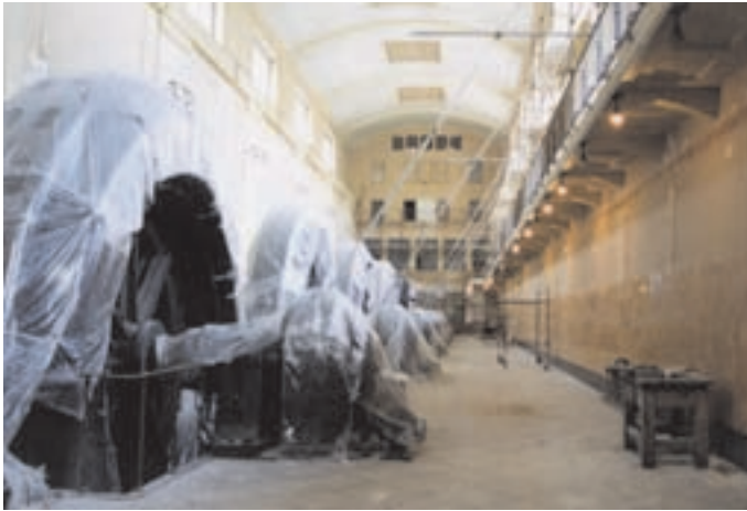
Slika 5: Začetek prenove. Beginning of renewal.