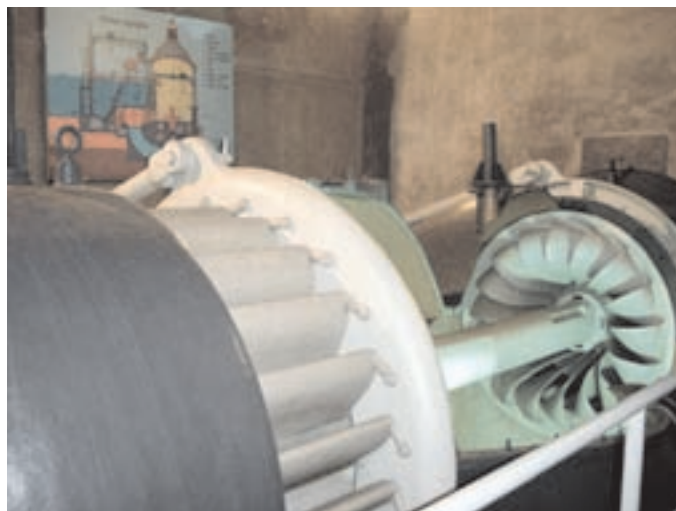
Slika 4: Ohranjena turbina. Preserved turbine.