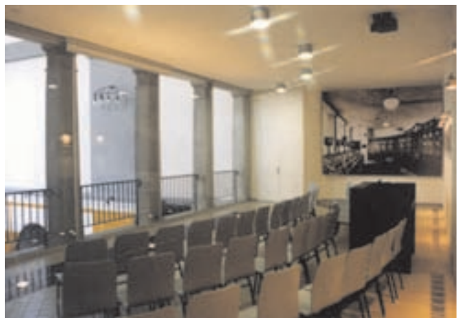
Slika 9: Stikalnica, v kateri je urejen sprejemni prostor z AV-projeksijo. The control room, which holds the reception and projection room.