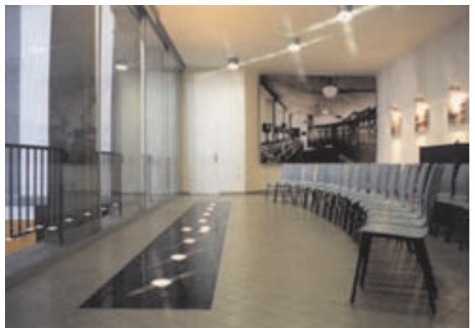
Slika 8: Arheologija stikalnice je predstavljena v tlaku in s fotopovečavo. Archaeology of the control room is presented by paving and photo-enlargement.