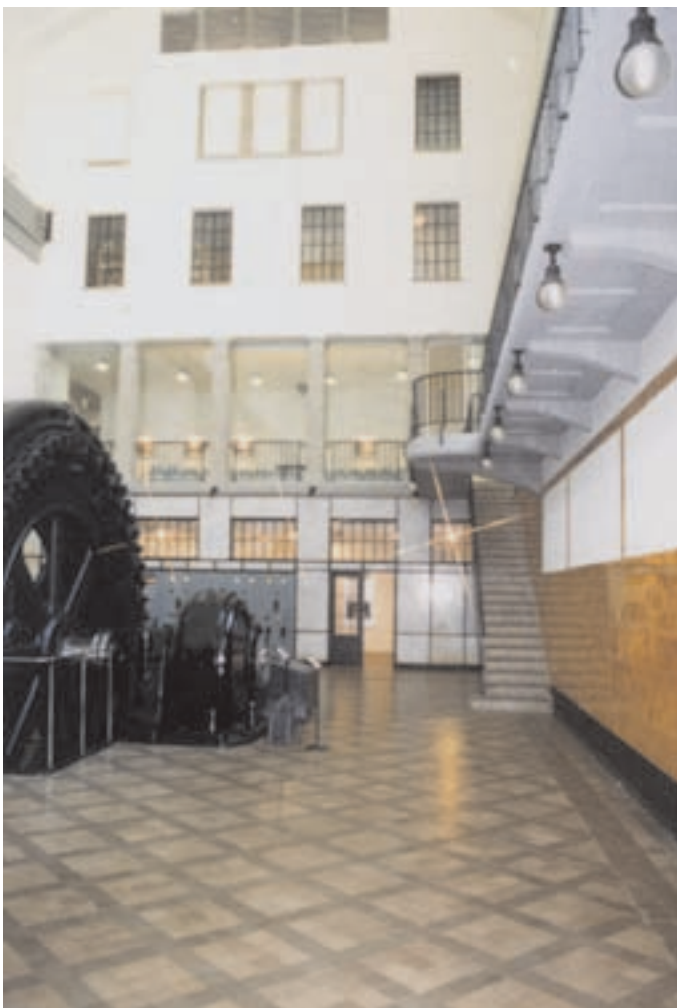
Slika 6: Prenovljena strojnica. Renewed power house.