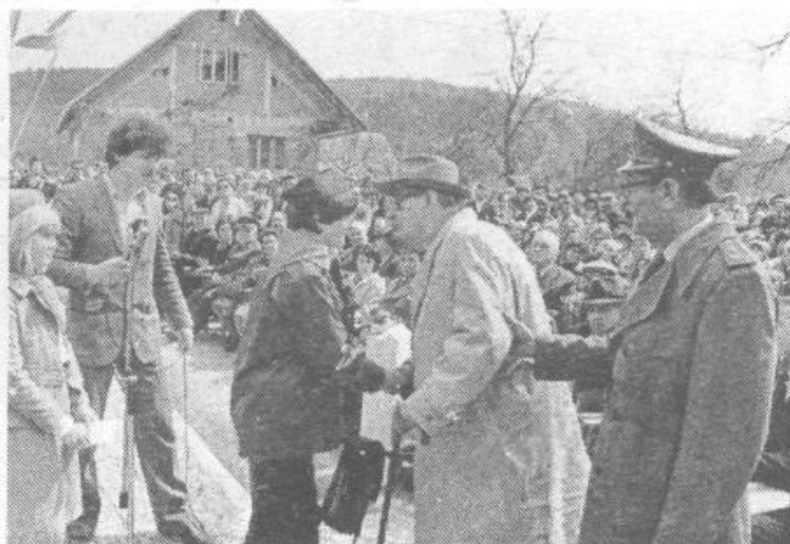
– Mali pionirji iz osnovne šole v Robu so ob zaobljubi prvemu komandantu slovenskih partizanskih enot in prebiranju pisma slovenskih pionirjev predali kuričkovno pošto Francu Leskošku-Luki, ki jo je nato vročil pionirjem s Turjaka, le-ti pa so jo ponesli naprej.