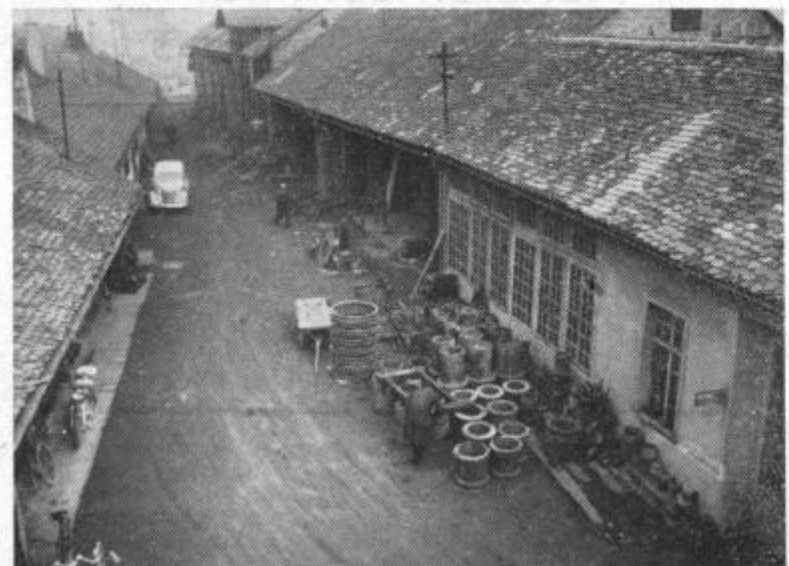
Dvorišče podjetja, ki je obenem skladišče polproizvodov in surove ter stare litine