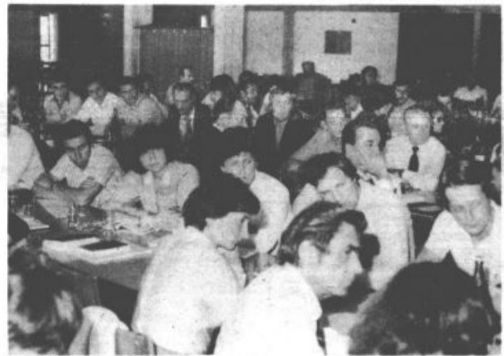
Udeleženci seminarja za sekretarje osnovnih organizacij ZK in za koordinatorje ZK v delovnih in sestavljenih organizacijah združenega dela iz Šaleške doline, ki ga je prejšnji teden pripravil komite OK ZK Velenje

Okrožni odbor aktivistov OF Šaleško — Mislinjskega okrožja, občinski odbor ZZB NOV Velenje in občinska konferenca SZDL Velenje vabita aktiviste OF iz Šaleške doline, delovne ljudi, občane in mladino, da se udeležijo v čim večjem številu 4. srečanja aktivistov OF Šaleško — Mislinjskega okrožja v nedeljo, 22. oktobra ob 10. uri v Slovenj Gradcu v domu telesne kulture.