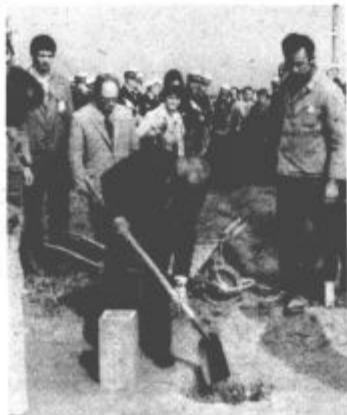
Polaganje temeljnega kamna

„Presrečni smo in radostni, ker vas spet vidimo v naši sredini. Bratsko vas pozdravljamo, želimo vam prijetno bivanje v naši občini, prijetna bratska srečanja povsod, kamor boste prišli. Bodite kot doma, med svojimi najbližjimi, med svojimi otroki, med svojimi sodelavci. Na legendarni Popini bodite ponosni in veliki tako kot mi, kajti od tam smo skupaj odšli v vihar revolucije proti skupnemu sovražniku s skupnimi cilji: za bratstvo in enotnost, za socializem, za lepšo bodočnost vseh naših narodov in narodnosti. S Popine so na revolucionarni pohod odšli tudi nekateri vaši rojaki, zato ste lahko še toliko