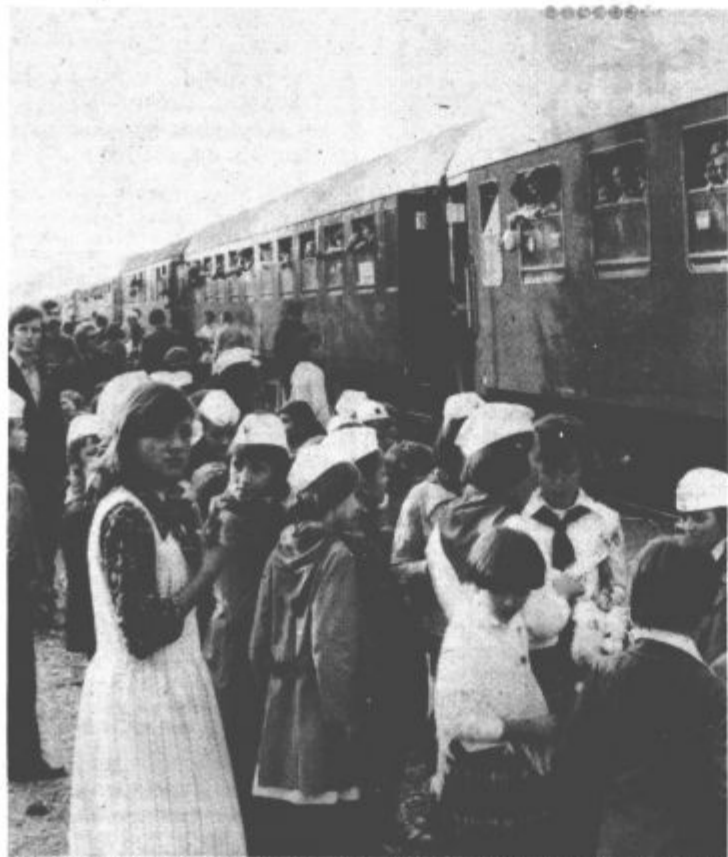
Povsod, kamor je pripeljal vlak Bratstva in enotnosti, so mu pripravili slovesen in nepozaben sprejem. Tako je bilo tudi na železniški postaji v Vrnjački Banji, kamor je vlak pripeljal nekdanje izseljence in delegacijo iz občine Velenje. Srečanje je bilo navdse prisrčno.

V občini Velenje so se pretekli teden mudili osmošolci iz Novega sela med krajevnih skupnosti Vrnjačke Banje. Na izletu v Slovenijo so si z velikim zanimanjem ogledali zlasti mesto Velenje in njegovo skupnost Šmartno ob Paki, ki je pobratena z Novim selom.