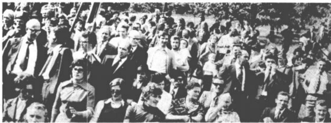
Aktivisti, borci in mladina... vsi smo eno (S 3. srečanja aktivistov OF Šaleško-Mislinjskega okrožja v Kotah v Šentilju pri Velenju 3. oktobra 1976)