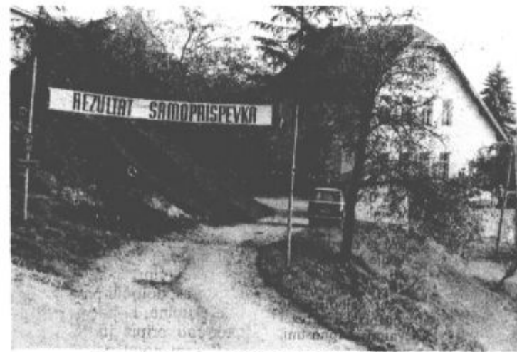
Dom družbenopolitičnih organizacij na Ravnah