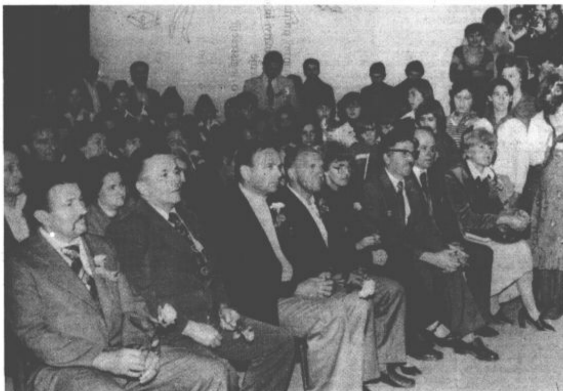
S pristrčnega sprejema v Novem selu

bolj ponosni. Prav to bitko sta vodila bratstvo in enotnost, saj so v njej sodelovali borci vseh krajev Jugoslavije. Z vašim obiskom so naši oktobrski prazniki še večji: 1. oktober, dan ko smo leta 1941 prvič z lastnimi silami osvobodili Vrnjačko Banjo in ustanovili narodnoosvobodilni odbor ter 13. oktober, dan, ko se je istega leta bila neenakopravna borba na Popini. 15. oktobra 1945 pa