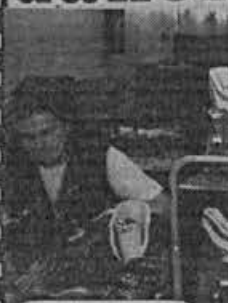
Urednikova miza: I Z V O Z