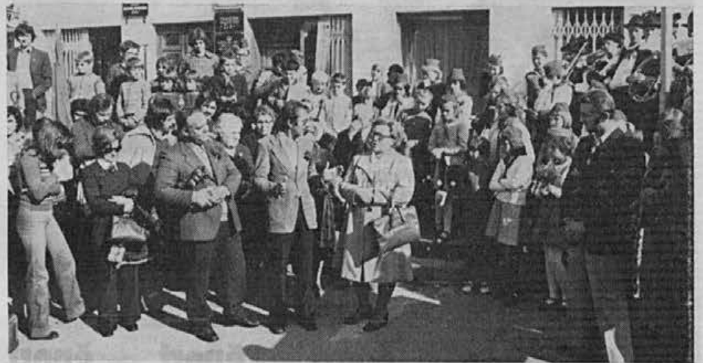
Ob sprejemu pred zadržnim domom

sej. Obveščeni so bili tudi vsi sekretarji OOKZ, predsedniki SO in ZB ter občinski komitei ZK, ki je obljubil tudi kritje stroškov. Tako smo se dogovorili.