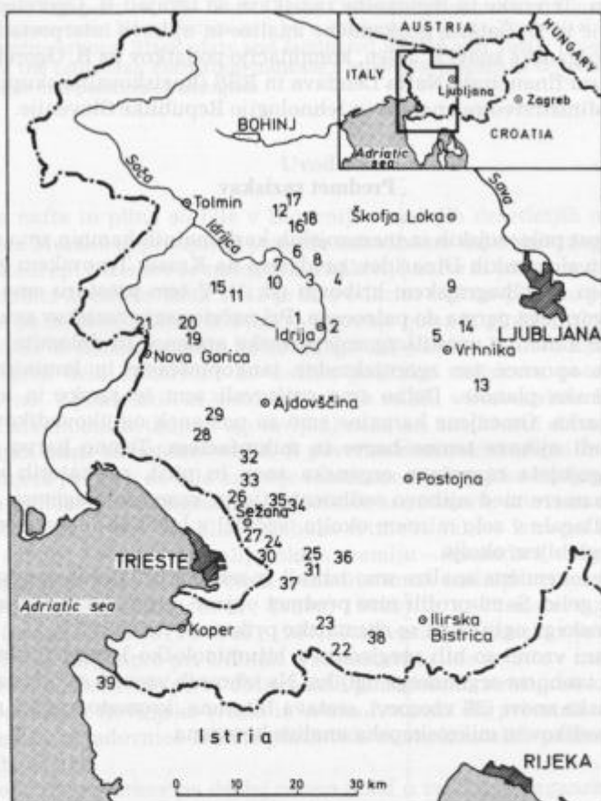
Sl. 1. Položaj in starost vzorcev, odvzetih za geokemične raziskave