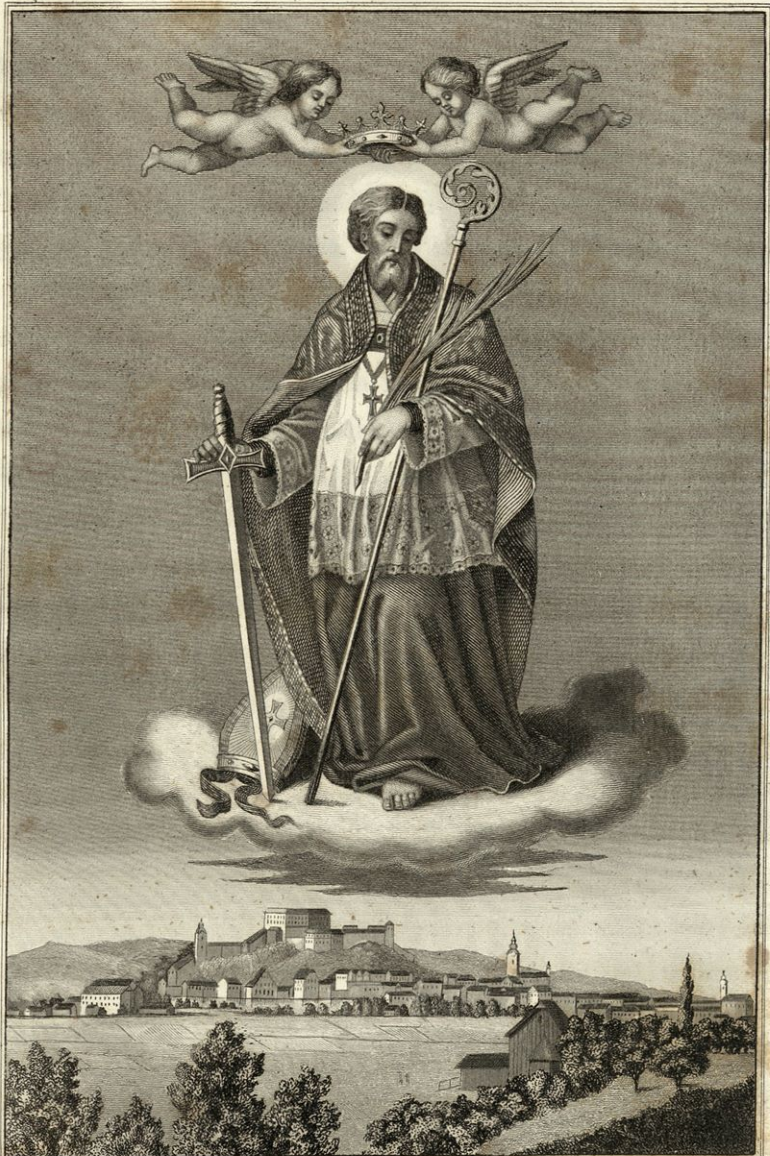
Zeichn. v. Heisterer.