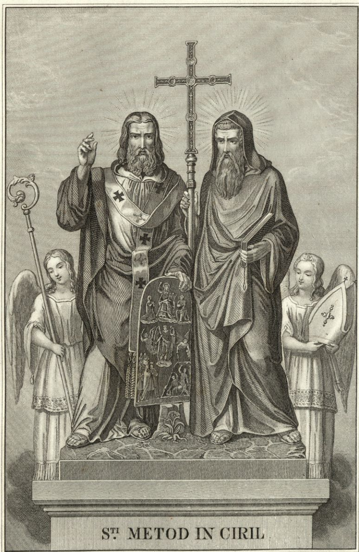
ST I METOD IN CIRIL

Proljuba sveta brata, apostola Slovanov, Pobratila nas cerkvi pravovernih kristjanov!