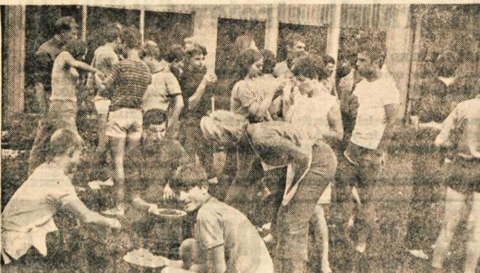
Udeleženci mednarodne mladinske delovne akcije v Trziču — mladinci iz Sainte-Marie-aux-Minesa in iz Trziča — so v petek popoldne priredili piknik, katerega so se udeležili tudi člani delegacije iz pobratenega alzaškega mesta in predstavniki tržiške občinske skupščine — (vig) foto F. Perdan