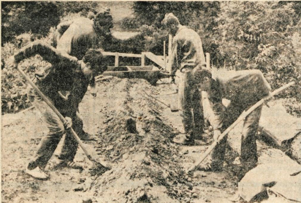
Člani TVD Partizan Selca so sklenili z udarniškim delom zgraditi nov most čez Soro. Nov most bo dolg 20 metrov, širok dva metra, po njem pa bodo lahko vozila tudi motorna vozila.