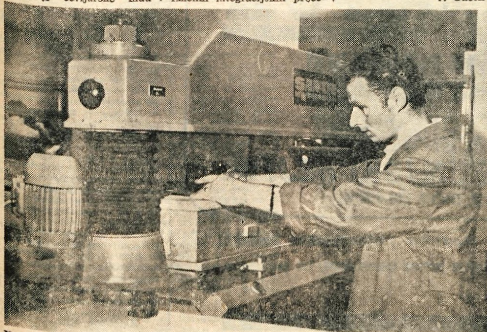
Kolektiv tržiške industrije obutve in konfekcije TRIO je 15-letnico svojega obstoja proslavil z otvoritvijo novega obrata