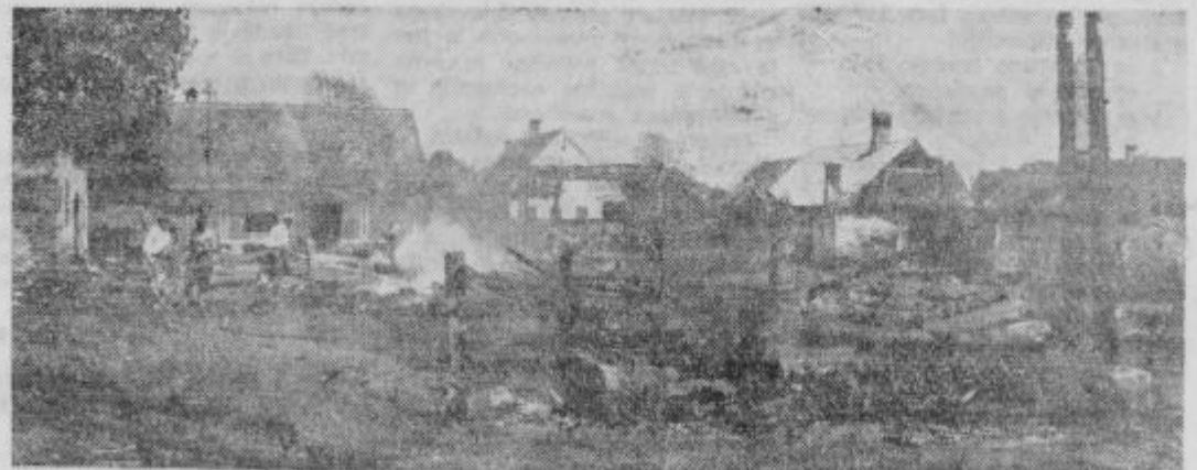
Pogorišče v Mihovcih

Po prvih ocenitvah je ta požar povzročil skoraj 20 milijonov dinarjev škode, ki bo le delno krita z zavarovalnino. Do časa poročanja