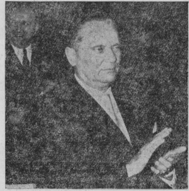
tropoli štafetne skupine s pozdravi in čestitkami k rojstnemu dnevu predsednika Jugoslavije tovariša Tita. Na poti jih po-

PREDLAGANI NOVI PREDPISI ZA NAPREDEK TURIZMA Tajništvo za zakonodajo pri zveznem izvršnem svetu pripravlja več novih predpisov s področja turizma. Izdelane so že teze za organiziranje turističnega varčevanja, kakor tudi novi predlogi predpisov o bivališčih, taksi in o oddajanju zasebnih sob. Po novih predpisih o bivališčih taksi naj bi občinski ljudski odbori v turističnih krajih obvezno predpisali takso za bivanje potnikov in turistov v teh krajih. Te takse naj ne bi plačevali samo tisti potniki, ki v kraju ne ostanejo čez noč, oziroma do 5 let in stoddrotni invalidi. Po drugem predlogu naj bi uživalci letnega dopusta in člani mladinskih organizacij, ki pridejo v skupinah, dobili popust pri plačevanju te takse.