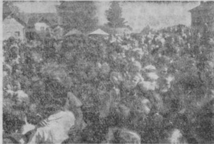
Nešteto glav se je strnilo pred lutkovnim odrom

Nedeljski popoldan 11. maja je bil sicer izredno vroč, vendar ob lahkem vetriču silno prijeten, da je nešteto staršev pohitelo s