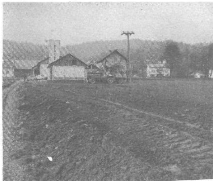
Gasilska organizacija je v vseh nosilka strokovne, pa tudi prostočasne dejavnosti. S sodelovanjem širše družbene skupnosti pripravljajo gasilci iz Podsmreke ob domu športno ploščad in igrišče za predšolske otroke.