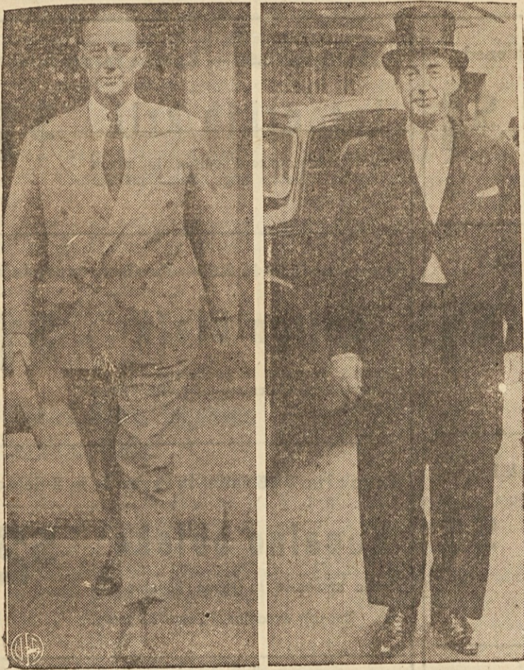
A. STEVENSON V LONDONU — Propali demokratski predsedniški kandidat Adlai Stevenson se je na svoji poti okoli sveta ustavil tudi v Londonu. Na levi ga vidimo v navadni obleki na poti v ameriško poslaništvo, na desni pa opravljenega za obisk v Buckingham palači.

Philco ledenica, peč, pohištvo za jedilno sobo in različni kosi. Na 21751 Ivan Ave., blizu E. 222 St. (170)