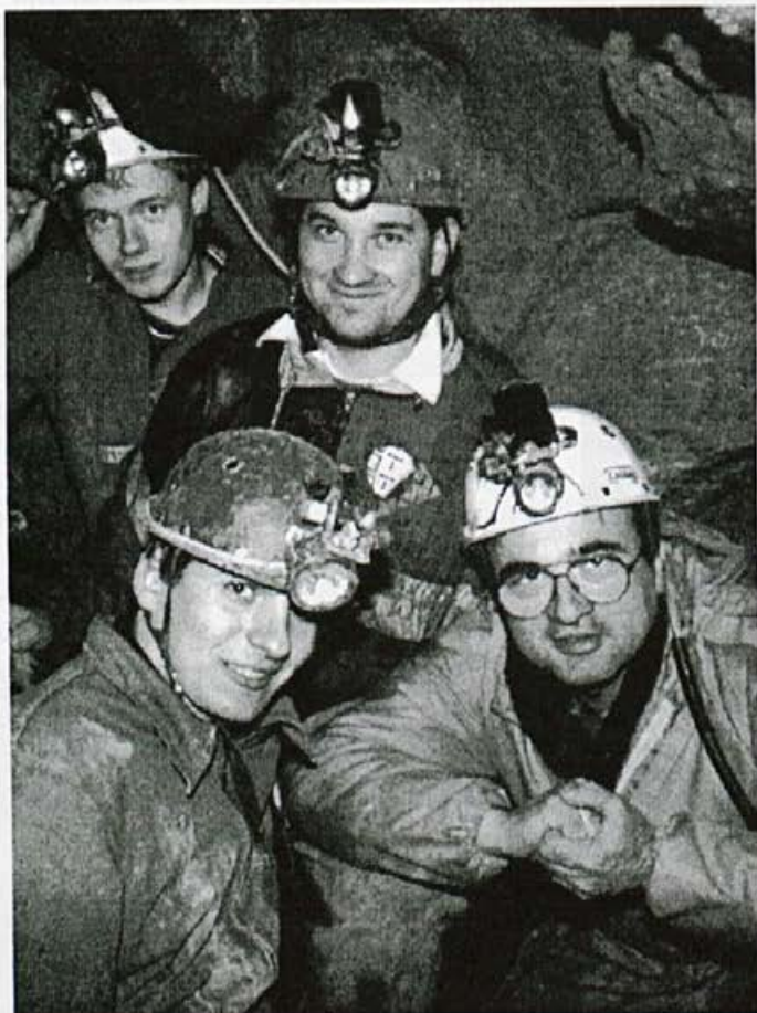
Raziskovalci - včasih tudi z lopato

Lepo vreme in zunanja dela so nekoliko zavrla intenzivnost raziskovalnega dela, kajti za resno akcijo v jami je potreben ves dan, na žalost pa ima teden samo 7 dni. V klubu pripravljamo fotografsko gradivo (diapozitive) in načrtujemo javno predstavitev dosežkov v letošnji zimi (predvidoma v aprilu). Ob tej priložnosti vabimo vse mlade, ki jih zanimajo jamarstvo in z njim povezane dejavnosti, da se nam pridružijo pri raziskovanju čudovitega podzemnega sveta. Ko bo prijavljenih vsaj 5 kandidatov, bomo organizirali tečaj za jamarje pripravnike, ki je pogoj za prijavo na izpit za naziv "Mlajši jamar".