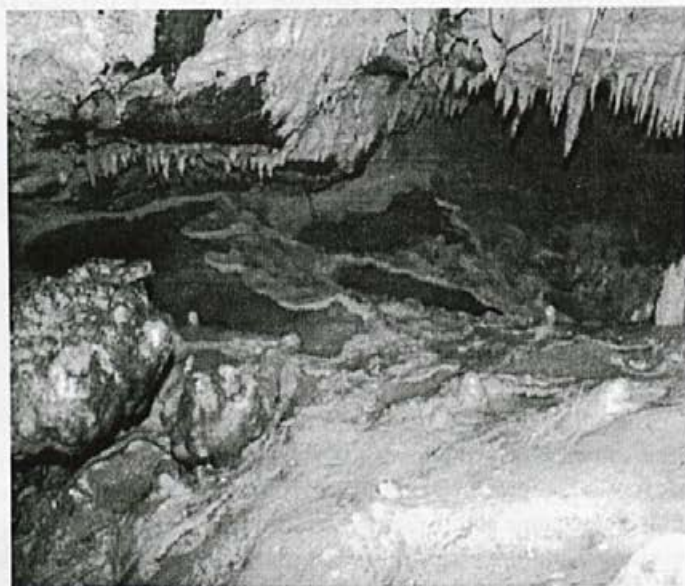
Ponvice - v novem delu jame

z javnostjo. Nosilec izdelave kakor tudi lastnik dokumentacije (zapisniki, načrti, rezultati meritev) je Klub jamarjev Kostanjevica na Krki. Dogovor velja do sestanka, na katerem bo sprejet sklep o zaključku raziskav v tem delu Kostanjeviške jame.