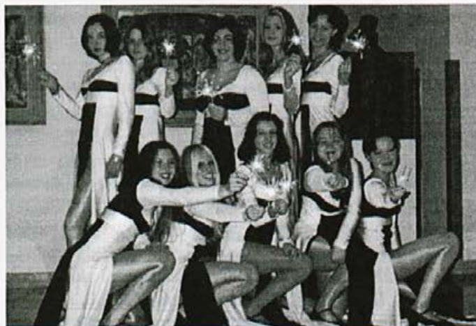
19. aprila 1997 bo plesni koncert domače skupine Harlekin