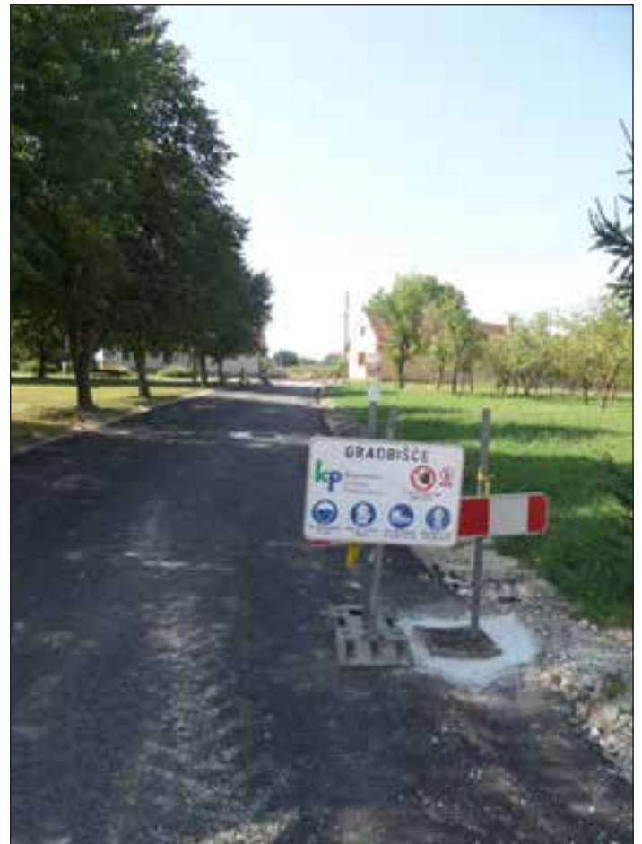
Cesto je potrebno le še preplastiti s fino plastjo asfalta.

Do sedaj je priključenih okoli 170 gospodinjstev, kar predstavlja tretjino vseh, prednosti delovanja čistilne naprave pa so že vidne v vodotokih in občestnih jarkih. Projekt pomeni veliko okoljsko pridobitev, tudi finančno, saj bo vreden okrog 7 mio