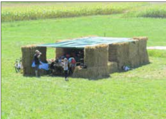
Naš »slamnat sedež tabora«, ki je služil kot jedilnica, učilnica in zaščita pred vročim soncem, ki nas je je dodobra grelo oba dneva.

Otroci so imeli možnost družabnih iger, najbolj pa so se razveselili kovanja konj v reki Dravi. Da smo tabor izpeljali uspešno in v zadovoljstvo otrok, je bilo potrebno veliko truda in prostega časa velikega števila članov Konjeniškega društva Središče ob Dravi. Največje plačilo za vse to pa je bilo videti srečne otroke, ki so nam ob odhodu domov zagotovili, da pridejo tudi naslednje leto.