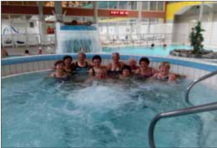
Veselo kopanje v Čakovcu

Kljub lenobnosti in strahu pred vročino smo se nekateri le odločili za osvežitev – kopanje. Najprej v Banovcih, nato še v Čakovcu. Uspelo nam je, da smo kljub vročim dnevom izbrali prav dneva, ki sta bila vremensko zelo ugodna: ne prevroča in ne prehladna. Za kopanje v Banovcih se nas je nabralo za dva osebna avtomobila in za ceno 15,5 evra za dve osebi smo se lahko kopali ves dan in se nasitili s pošteno porcijo »poha-