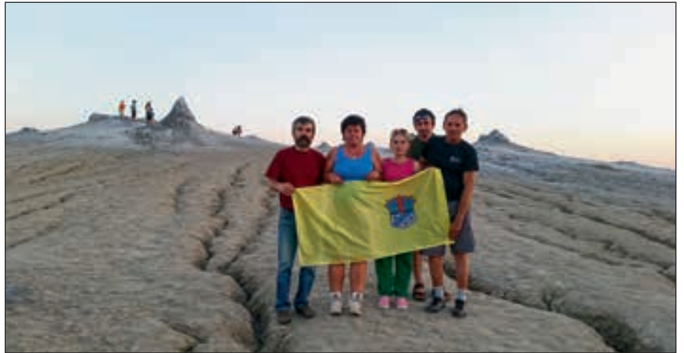
Šesta odprava »Moskva Tour« s središko zastavo v Romuniji

Kot ponavadi so nam pred samim odhodom skeptiki odsvetovali potovanja v te dežele, saj slovijo kot zelo "nevarne". V kategoriji nevarnih prednjači predvsem Romunija. Kljub „dobronamernim“ opo-