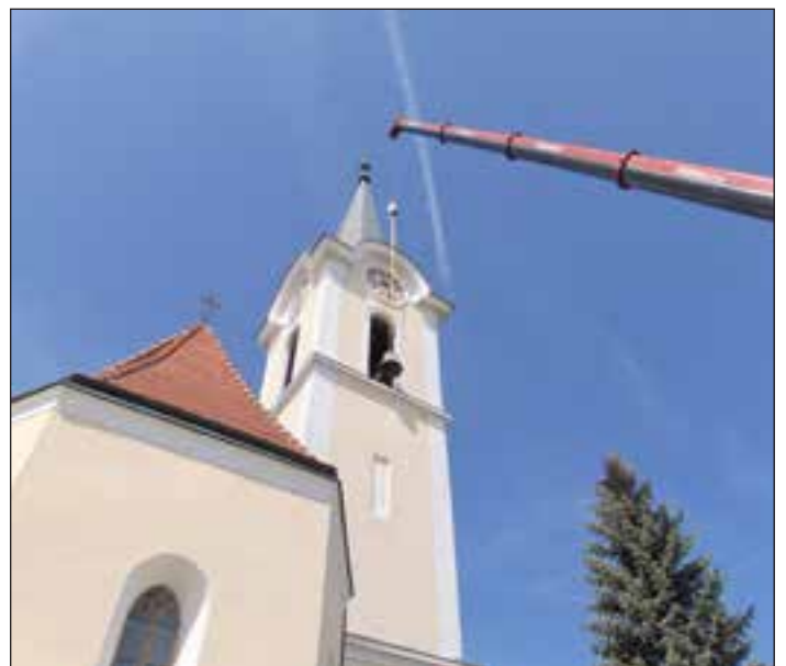
Novi zvon za središko kapelo

Bilo je 24. avgusta 1479, ko je pridrvela turška vojska, ki je pred tem opustošila Nedelišče. V Središču je bil ta dan sejem, zato se je zbralo veliko ljudi. Ko so Središčani slišali za Turke, so zgrabili za orožje, ki so ga pač imeli, in hiteli za obzidje cerkve, ki so ga že prej sezidali v ta namen. Ker pa v cerkvi in za obzidjem ni bilo dovolj prostora za vse, so starčki, žene in otroci zbežali v Mladoles.