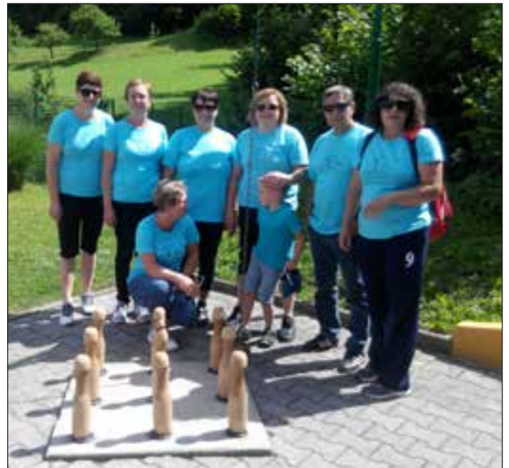
Na športnih igrah pri Mislinji

Na povabilo prijateljev iz pobratene občine Mislinja smo se člani Društvo za telesno vzgojo Partizan 25. 6. 2015 udeležili vaških iger, ki so potekale v športnem parku Straže. Igre so bile zelo zanimive ter smešne, vendar nam prišlekem novincem niso najbolj šle. Kljub vsemu je bilo druženje z ostalimi ekipami iz njihovih okoliških krajev lepo in zabavno. Zvečer smo se veseli vračali domov in si rekli: »Važno je sodelovati, ne pa zmagati!«