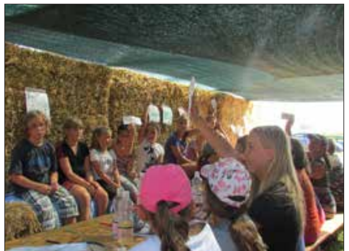
Mladi udeleženci 5. konjeniškega tabora.