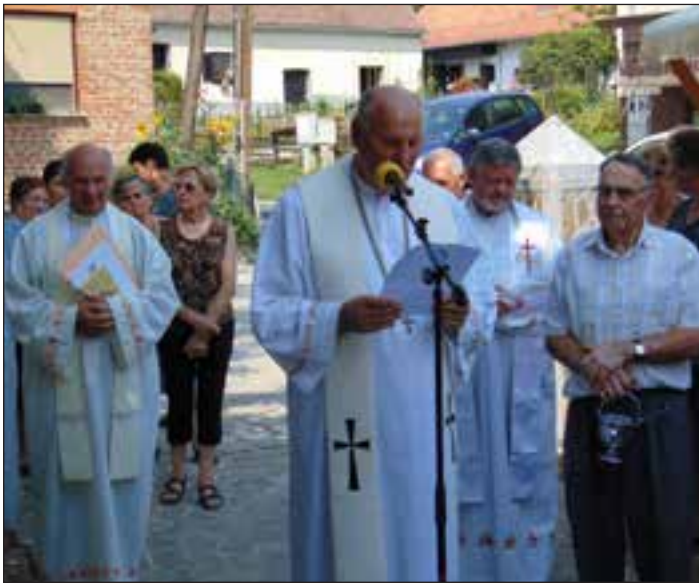
Slavnost ob Marijinem prazniku in blagoslov zvonov

Ti, ki so zbežali, so si rešili življenje, kajti Turki so prebili obzidje, oropali, poklali in pomorili vse ter na koncu zažgali cerkev in domove. Nepopisna groza in žalost je zavladala med preživeli. Na pogorišču cerkve, ki se je prej imenovala Cerkev svetega Jerneja, so našli majhen kipec žalostne Matere božje, ki je prej krasil stranski oltar. Bil je nepoškodovan. Postavili so ga na častno mesto in postal jim je svet in dragocen. Ta čudežno ohranjen kipec so hoteli imeti v svoji sredi, da bi jih varoval ter ču-