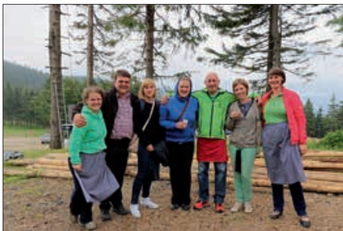
Druženje v čudovitem večnamenskem objektu Center Kope (adrenalinski park, zeliščarske delavnice, prostori za seminarje, domača kulinarika s Pohorja)