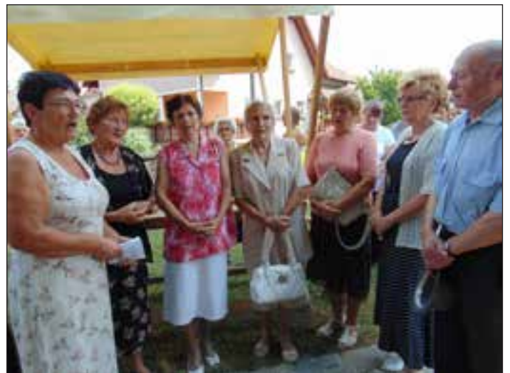
Slavnost po maši so obeležili tudi ljudski pevci iz Obreža ter člani Turističnega društva Središče ob Dravi.

Zvonovi nas še danes dejansko spremljajo od zibelci do groba. Naj zvonijo v hvaležnost in slavo Bogu.