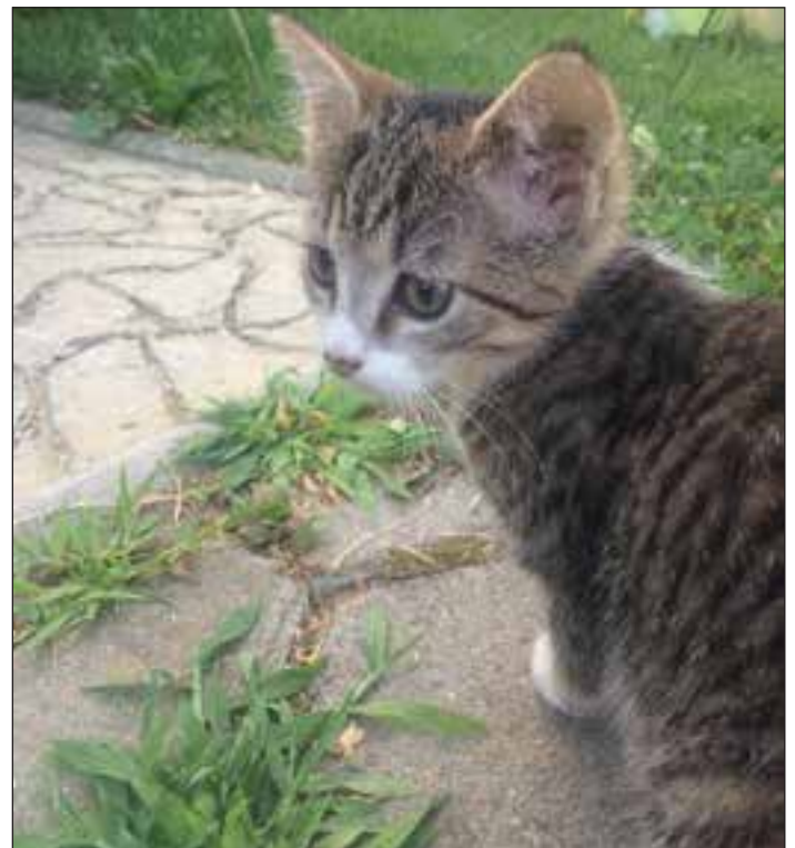
Mucka Urša je ena izmed treh mačjih sestric, ki rabijo dom.

Od zadnje številke Sredice pa do danes smo imeli 70 intervencij na terenu in narejenih preko 4000 km. V zadnjem tednu avgusta je bilo povečano število intervencij, in sicer kar 32, s tem pa narejenih čez 800 km, ki smo jih financirali iz lastnih žepov. Ker nas veliko potrebujejo tudi na mariborskem koncu, smo obstoječi telefonski številki dodali še dodatno 051 -757-764, na katero se vam bosta oglasila naša člana iz Maribora. V zadnjih 3 mesecih smo predali tudi več kot 400 kg zbrane hrane za živali.