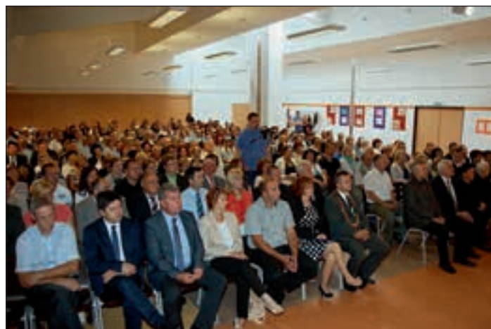
Na proslavi ob občinskem prazniku Občine Mislinja (27. 6. 2015)