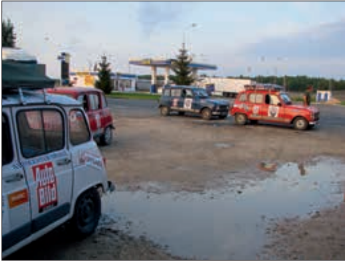
Po Litvi in Latviji prispeli na Poljsko.

Po izpolnitvi carinskih deklaracij so se pričeli pregledi. Ker je trenutno prepovedan kakršenkoli uvoz mlečnih in mesnih izdelkov iz Rusije, so nam dobesečno pretresli katrce in v mojem vozilu našli pol litra čokoladnega mleka (natančneje 5-krat po 1 dcl). Grozila mi je celo denarna kazen, ker nisem prijavil vseh artiklov. Po pogovoru s carinsko inšpektorico (ki je »v civilu« nadzorovala pregled) sem moral mleko vreči v določeni zabojnik, ali pa ga takoj konzumirati.