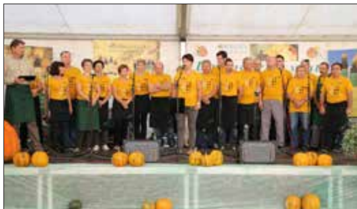
Pohvala gre vsem zaposlenim na središki oljarni in mešalnici, ki so zaslužni za njeno prepoznavnost in uspešnost. Nadaljevanje na naslednji strani

Organizatorji smo se potrudili, da smo sestavili bogat program in medse povabili številna društva in posameznike. Da je praznik buč vedno bolj priljubljen, kaže dejstvo, da se je na stojnicah predstavilo več kot 40 razstavljalcev, zlasti lokalni ponudniki domače hrane, turistična in kulturna društva ter kmečke žene. Manjkali niso niti najmlajši, osnovnošolci in otroci iz vrt-