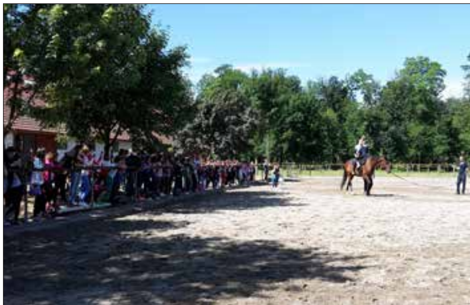
Učenci OŠ Ormož so bili navdušeni nad prikazom gimnastike na konju – voltžiranja v KK Zaton.

Konec šolskega leta smo, zahvaljujoč sponzorskim sredstvom CARRERE OPTYL PROIZVODNJA OČAL, D.O.O. ORMOŽ, že lani vse krožkarje odpeljali na ekskurzijo v mariborsko zavetišče za živali, letos pa smo s sponzorskimi sredstvi omenjenega podjetja omo-