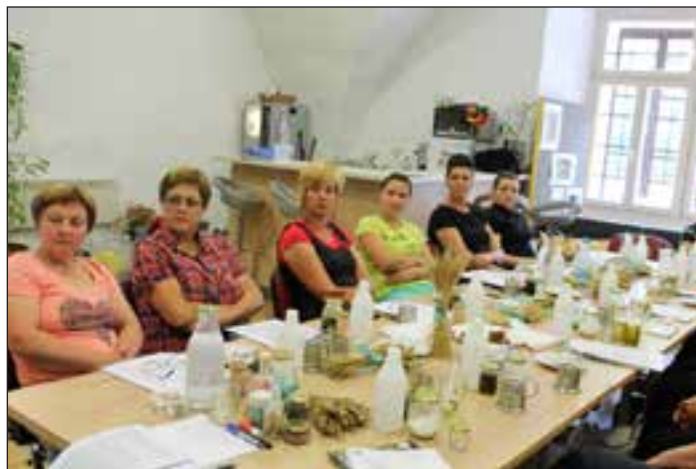
Udeleženke so se učile izdelovati domačo kozmetiko in druge koristne vsakdanje izdelke

Zelo pomembno je zavedanje, da so se povečale številne bolezni in alergije pri ljudeh in živalih in tako se vedno bolj