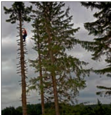
V adrenalinskem parku Centra Kope - plezanje po smrekah

Sledil je ogled zeliščarske delavnice priznane zeliščarke gospe Fanike Jeromel.