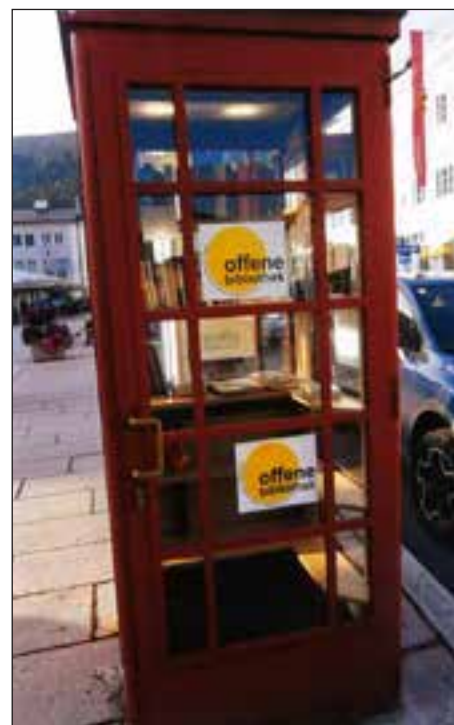
Telefonska govorilnica je lahko tudi ulična knjižnica.

zanjo lep spomenik in zahvala za vse izobraževalno delo, ki ga je opravila za svoje učence ter središke in okoliške krajane. O tem, kdo bo bral, kaj bi se dogajalo s telefonsko govorilnico in knjigami v njej – ne, o tem pa nočem misliti. Ostati hočem le pri pozitivnem razmišljanju.