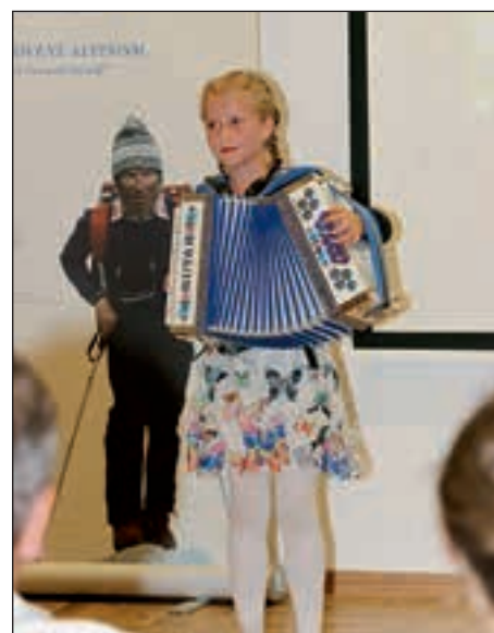
Mlada harmonikašica nam je v dvorani Centra Kope čudovito zaigrala nekaj pesmi.