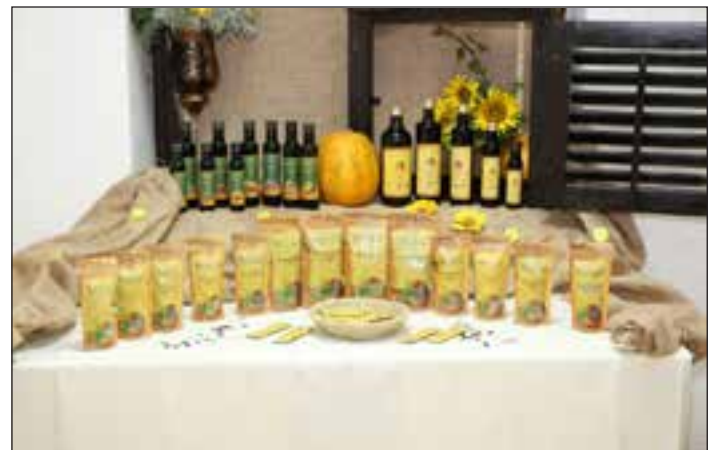
Središka oljarna ima nov dizajn embalaže svojih izdelkov.

gozdarski zbornici Slovenije – izpostava Ptuj. Imeli so precej težko delo, saj so bili vsi golaži odlični.