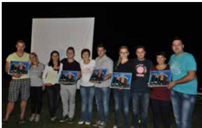
Ob premieri videospota »Kdor jo rad ima«