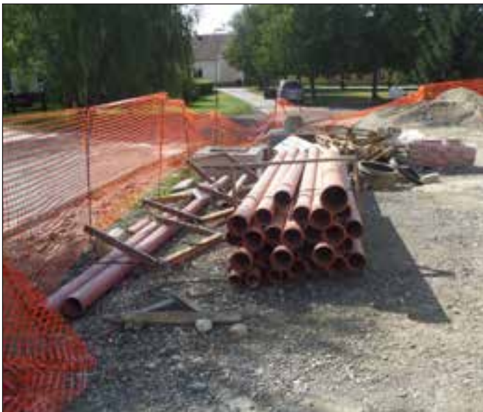
Kanalizacijskih cevi se ne vidi več, na vrsti so priklopi na zgrajeno omrežje.

evrov. Občina Središče ob Dravi zato poziva občanke in občane, da se na kanalizacijski sistem priključijo v čim krajšem času, še posebej, če nam bo jesen naklonjena z lepim vremenom. Občina je omogočila obročno odplačilo stroška priključitve na kanalizacijski sistem – komunalni prispevek, katerega dokončno obročno odplačilo pa ni pogoj za priključitev. Vse ceste na Grabah, v Obrežu in Središču ob Dravi bodo na novo asfaltirane, kar predstavlja lepo pridobitev. Sočasno s kanalizacijo je bilo zgrajeno optično omrežje, ki ga je zgradilo podjetje Teleing. To je že poslalo v gospodinjstva ponudbe za različne