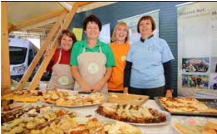
Članice TD Središče ob Dravi so pripravile jedi iz buč.

Seveda se je na svojih stojnicah predstavljala tudi oljarna in mešalnica s svojimi izdelki. Oljarna Središče je tokrat predstavljala nov design embalaže sladkih, slanih – praženih in naravno sušenih bučnic. Tako so obiskovalci lahko poskusili 8 različ-