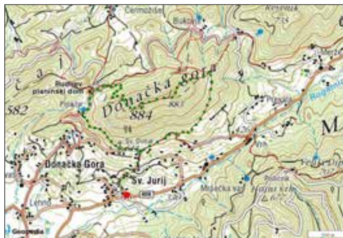
Krožna pot čez Donačko, po vzhodni gor, po zahodni nazaj na izhodišče.

Sv. Jurij, prvi večji kraj, odkar kmalu za Žetalami prestopimo iz Podravja v Posotelje, bo naše izhodišče. Večina izletnikov se resda odpelje vse do Rudijevega doma, od koder je le slabo uro do vrha, ampak mi bomo ta oktober vendarle planinci, zato si bomo zadali nekoliko večji izziv: pred nami so namreč kakšne 3 ure in pol hoje. Torej, parkiramo pod cerkvijo na urejenem parkirišču, nato pa, sledeč markacijam, mimo pokopališča kar