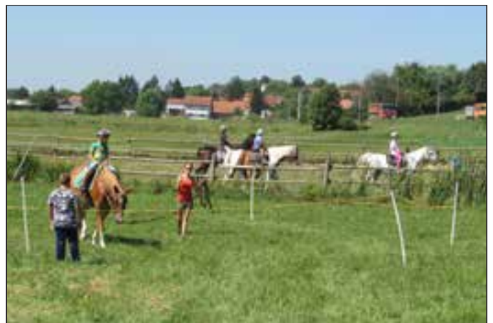
Jahanje pod vodstvom članov društva.