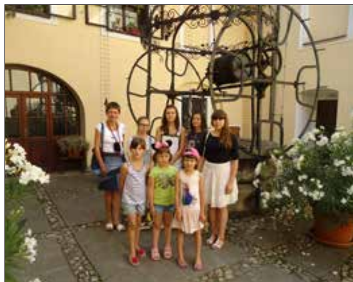
Še posnetek za spomin