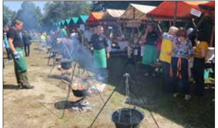
Kar 13 ekip je tekmovalo za zmago v kuhanju bučnega golaža. Letos je to uspelo članom Občinske turistične zveze Maribor.

kuhali“ dijaki šole za gostinstvo in turizem iz Radencev, tretje mesto pa je osvojilo TD Velenje. Vsi ostali so dobili zahvale za osvojeno četrto mesto.