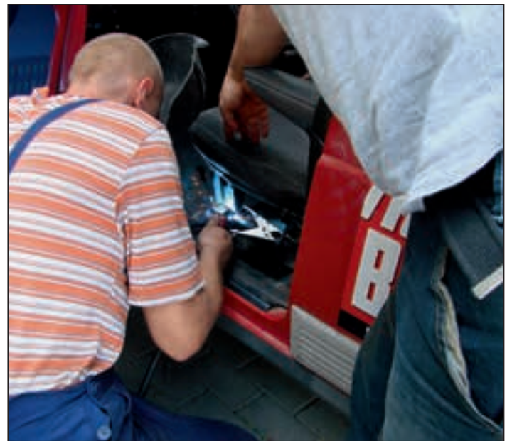
Zadnje popravilo bolne katre na Poljskem