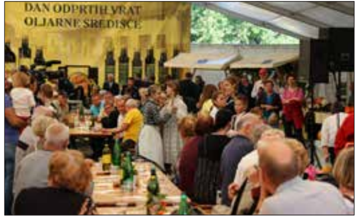
Prireditev je bila zelo dobro obiskana.

Na prireditvi so nastopili pihalni orkester SVEA iz Zagorja, Ansambel Zupan, Godba na pihala Središče ob Dravi, Ljudski pevci iz Obreža, Dramska skupina iz Obreža ter Folklorna skupina Osnovne šole Središče ob Dravi.