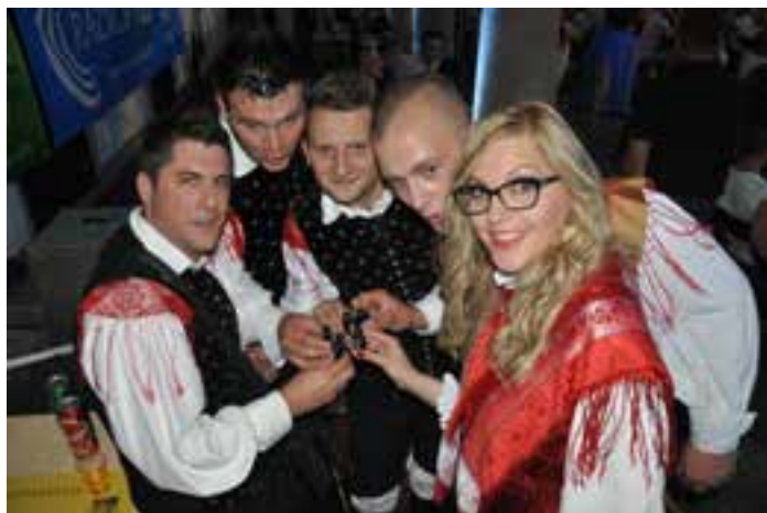
Po zmagovalnem nastopu na ptujskem festivalu 2015

V avgustu so se Žargonovci pričeli intenzivno pripravljati na ptujski festival, ki je potekal 28. avgusta, v zapolnjenem ambientu Minoritskega samostana. Na festivalu se je predstavilo 14 ansamblov, ki jih je na predizboru maja v Trziču izbrala strokov-