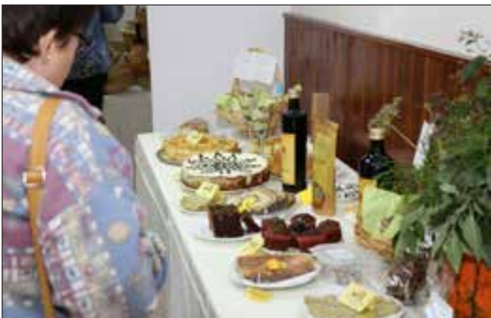
Vsakoletno prireditev popestri tudi bogata razstava jedi in raznih izdelkov.

Velik poudarek smo dali tudi kuhanju bučnega golaža. Med 13 ekipami, ki so kuhale bučni golaž, je bila najuspešnejša ekipa iz Občinske turistične zveze Maribor, drugo mesto so si „pri-