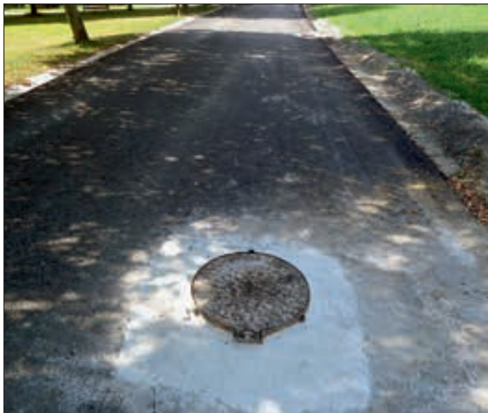
Kanalizacijski jaški pred finalizacijo asfaltiranja na Grabah

pakete optičnega omrežja, na katere se bo dalo v kratkem priključiti. Optično omrežje nudi kvalitetne prenose internetnih, televizijskih in telefonskih storitev.