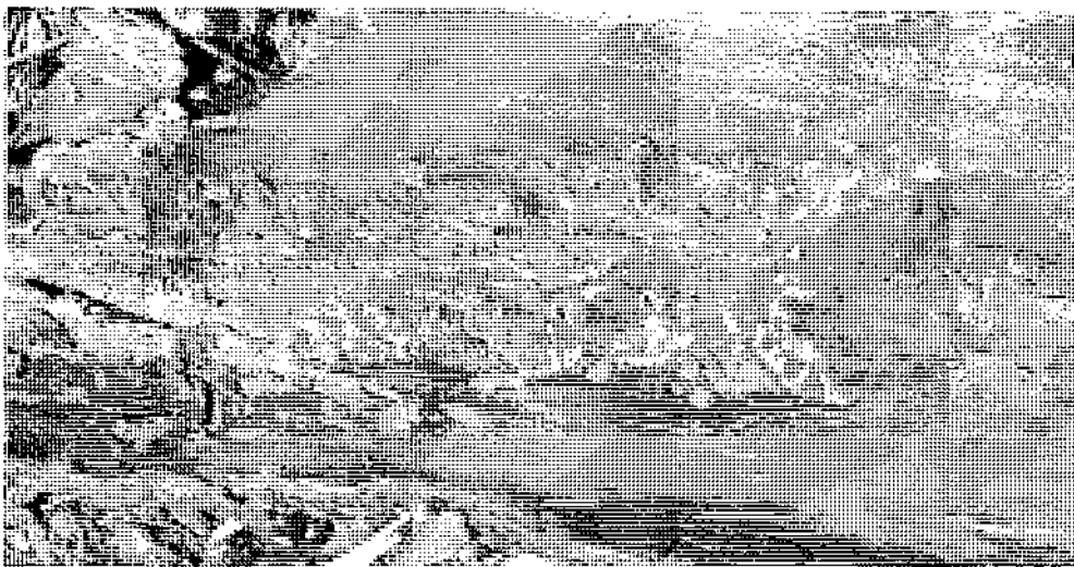
Slika 2: Rovni sistem dvanajsterozobega borovega lubadarja ( Ips sexdentatus Boemer)

Na Madžarskem so leta 1970 zastavili monitoring zdravstvenega stanja gozdov na 23 stalnih raziskovalnih ploskvah. Upoštevajo izvor drevesa (semenski, panjevski), socialni položaj ter eksaktno izračunane indekse (index zdravstvenega stanja - HI, index trenda odmiranja - MTI, index trenda zdravstvenega stanja - HTI in indeks suše - PDI). Ugotavljajo značilne korelacije med zdravstvenim stanjem drevesa, socialnim položajem, izvorom drevesa in obdobji sušnih intervalov.