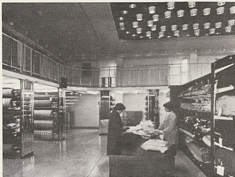
Danes nova prodajalna