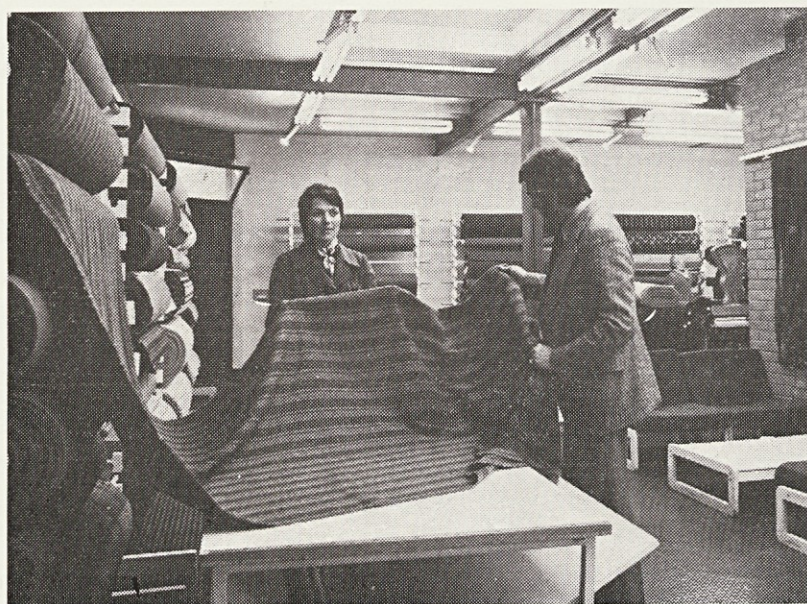
Prodajalna pred desetimi leti

nih tkanin, na galeriji. Na izbiro so tapiserije, pregrinjala, okrasne blazine, preproge in okrasni prtiči. V trgovini prodajajo tudi konfekcijske izdelke. V zadnjem času se je asortiment teh skrčil. Pred leti so prodajali vikend odeje, toaletne garniture, avto-lame, copate in blazine za stole. Slednja dva izdelka sta še vedno v prodaj-