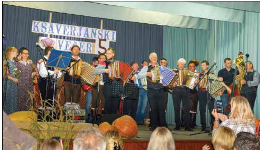
Vesolja na odru in pod njim na Ksaverjanskem večeru v radmirskem kulturnem domu ni manjkalo.