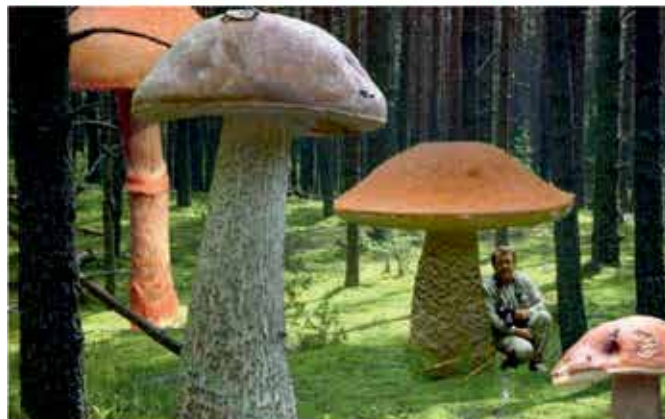
Le kje so gobe? Pa vsi pravijo, koliko jih je!

Anza: „Septembra in oktobra se je v naši državi z gobami zastupilo preko sto ljudi. Kar osem jih je zaužilo mušnice. Kako je to mogoče?“