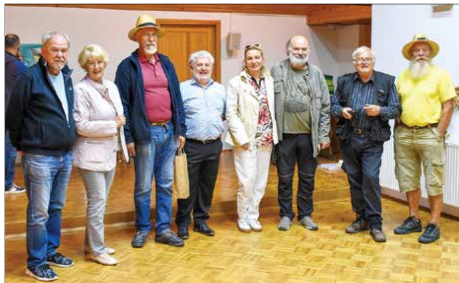
Udeleženci Ex tempora Mozirski gaj na odprtju delovne razstave

Tudi v letošnjem septembru so se v Mozirju družili umetniki iz različnih krajev Slovenije ter tujine in v Mozirskem gaju ter okolici ustvarjali likovne podobe. V okrilje harmoničnega mozirskega parka so bili povabljeni v okviru 28. slikarskih študijskih dni Ex tempore Mozirski gaj, tradicionalnega umetniškega druženja, ki ga že skoraj tri desetletja organizira Kulturno društvo Jurij Mozirje.