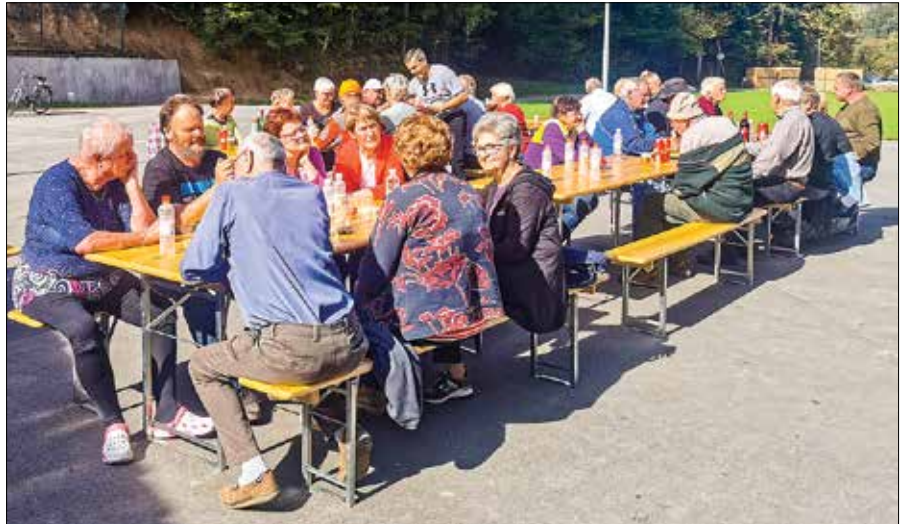
Na oktobrskem pikniku v Račneku se je zbralo 52 članov Društva upokojencev Šmartno ob Dreti.