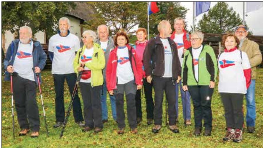
V mimohodu praporščakov so sodelovali tudi pohodniki VDV brigade Združenja borcev za vrednote NOB Zgornje Savinjske doline.