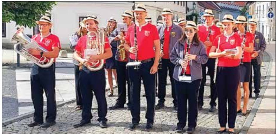
Zgornjesavinjski godbeniki v mestnem jedru Kamnika