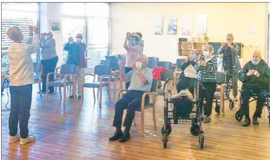
Vodene vaje so prilagojene sposobnostim vaditeljev.