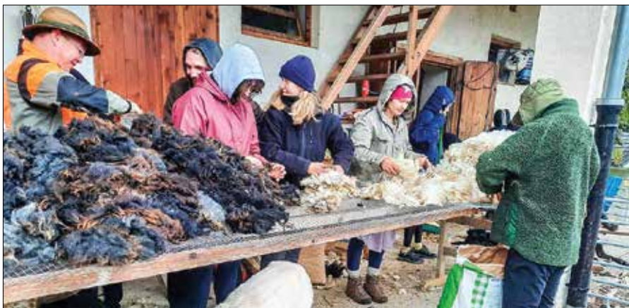
Udeleženci tabora pri striženju ovc na kmetiji Knez v Robanovem kotu.

Sončnica Mozirje. V zadnjem letu so v Mozirju uvedli nove aktivnosti za uporabnike, pridobili so štiri nove zaposlitve, novo vozilo, zagnali pa so tudi ambulanto dejavnost, ki jo izvajajo v sodobno opremljeni ambulanti.