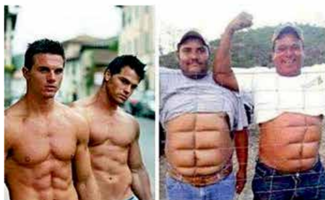
Kako najhitreje do trebušnih mišic (glej desno).

Ljubljanski župan se zaveda, da ni »najbolj prijazen«, da bodo morali volivci skoraj vsako nedeljo na volitve. Glede na izbiro se zna zgoditi, da bodo v nekdanjem najlepšem mestu (ni več Uniona) mnogi spet raje ostali doma.