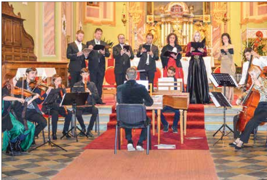
Baročni orkester ljubljanske akademije za glasbo deluje od leta 2010.

Baročni orkester ljubljanske akademije za glasbo je bil ustanovljen leta 2010, leto po uvedbi študijskega programa stare glasbe in študija historičnih instrumentov. Idejni vodja dirigent in umetniški vodja baročnega orkestra