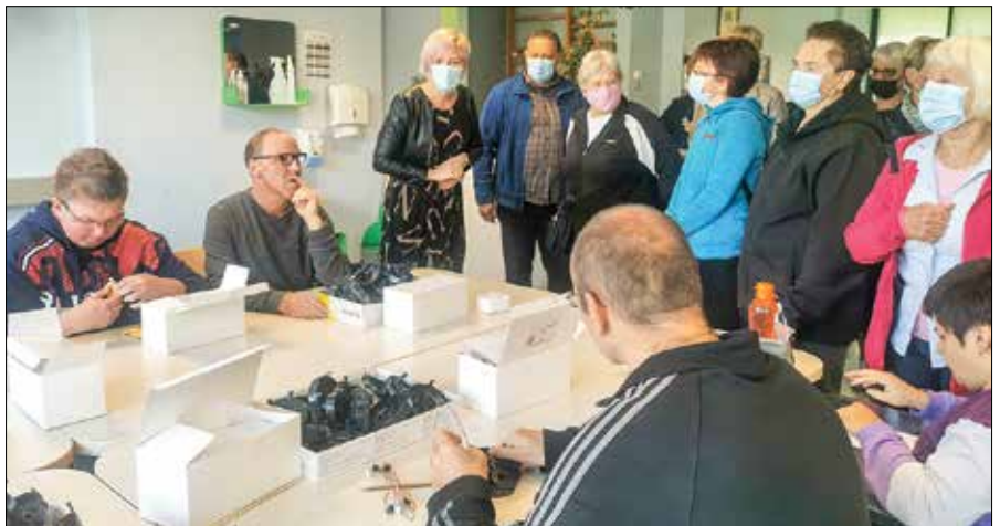
Obiskovalci so si ogledali notranjost objekta in se seznanili z aktivnostmi VDC SAŠA.

VDC SAŠA je regijski javni socialno varstveni zavod, ki izvaja storitev vodenja, varstva in zaposlitve pod posebnimi pogoji za odrasle osebe z motnjo v telesnem in duševnem razvoju. V letu 2020 so tej storitvi dodali institucionalno varstvo, ki ga izvajajo v bivalni enoti