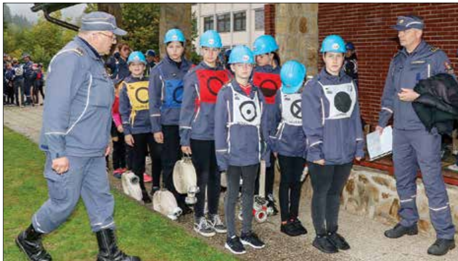
Z usposabljanjem gasilskega podmladka se kalijo bodoči operativni kadri v društvih.