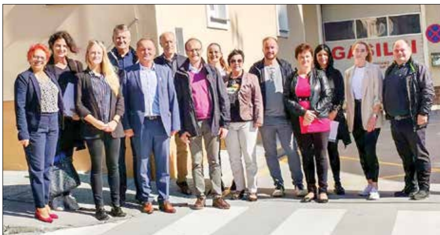
Ocenjevalna komisija na Ljubnem v družbi gostiteljev.

Komisija se je pri ogledu osredotočila predvsem na odziv skupnosti na družbene spremembe in usmerjanje razvojnega procesa v smislu gospodarskega razvoja, ustvarjanja sodobnega družbenega okolja, arhitekture, razvoja naselij, ekologije in oskrbe z energijo ter kulturnih pobud