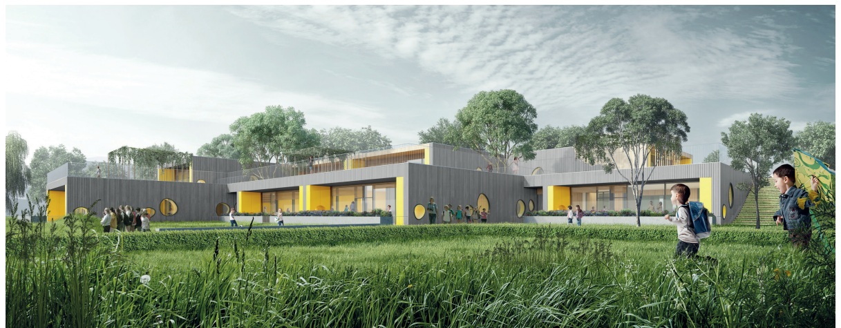
Vrtec Kočevje, 1. nagrada na natečaju, svet vmes in Kolektiv Tektonika, 2018