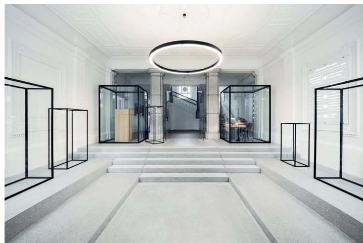
Avla 9 okvirov – Gimnazija Poljane, svet vmes, 2015

moramo, ko se pogovarjamo o učnih okoljih, obravnavati vsaj enakovredno, če ne celo kot »krovno ali povezovalno kategorijo«, kot trdita arhitekta Blenkuš in Zorc, ki menita, da »arhitektura ne le omogoča, temveč tudi pogojuje in usmerja odnose med deležniki in učnim okoljem«.