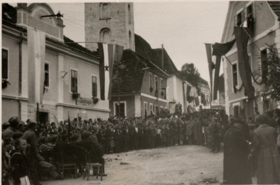
1.MAJ 1953 LETA