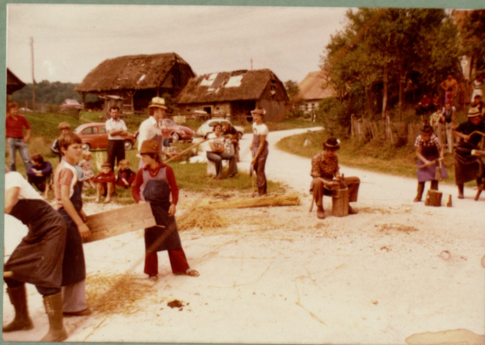
OB »ŠRANGANJU« NA POROKI LETA 1976 STA BILI VIDNI S SLAMO KRITI HIŠA IN KOZOLEC V PEČKEH