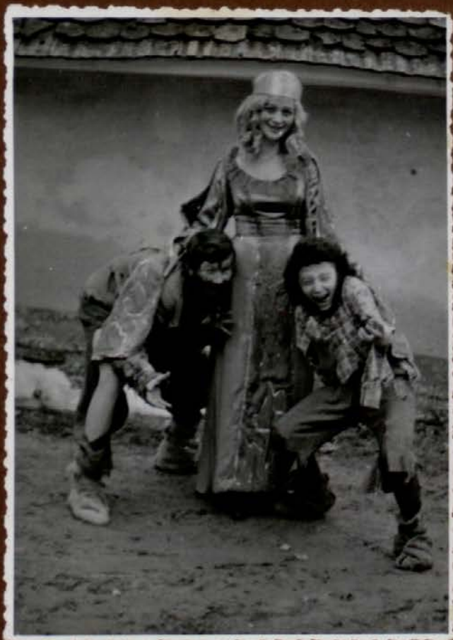
SNEGULJČICA 1960 LETA