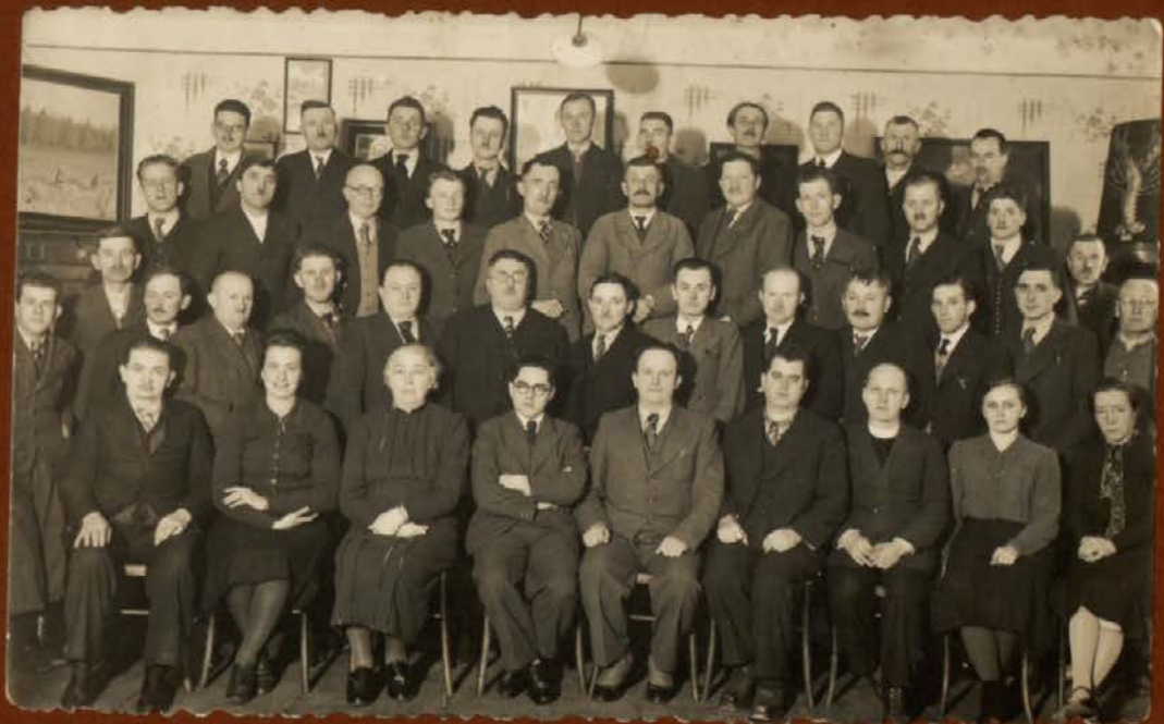
CERKVENI PEVSKI ZBOR