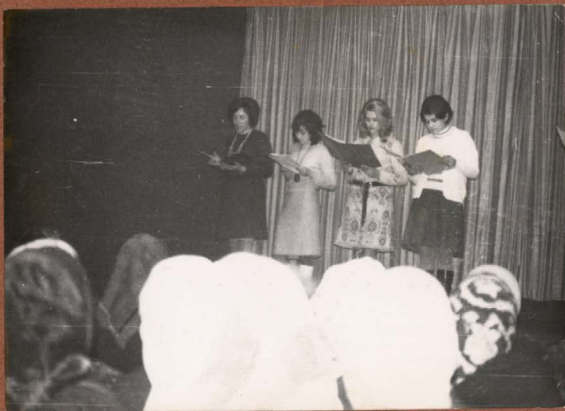
DAN REPUBLIKE 1975 LETA