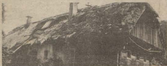
Tudi tej hiši v bližini Makol so šteti dnevi.

Območje Haloz, na katerem je tudi krajevna skupnost Makole, se je vsa leta otepalo z nerazvitostjo. Ta je povzročala tudi velik odliv mlade delovne sile v tujino ali industrijske kraje Slovenije. Doma so ostajali starejši, ki pa niso bili več sposobni gospodariti na kmetijah. Dohodka za preživljanje ni bilo, zato je tudi domačije pričel najedati zob časa. Zasilno krpanje streh in podpiranje notranjosti prostorov sta bili samo kratkoročni rešitvi, začelo se je neizogibno propadanje značilnih haloških domačij.