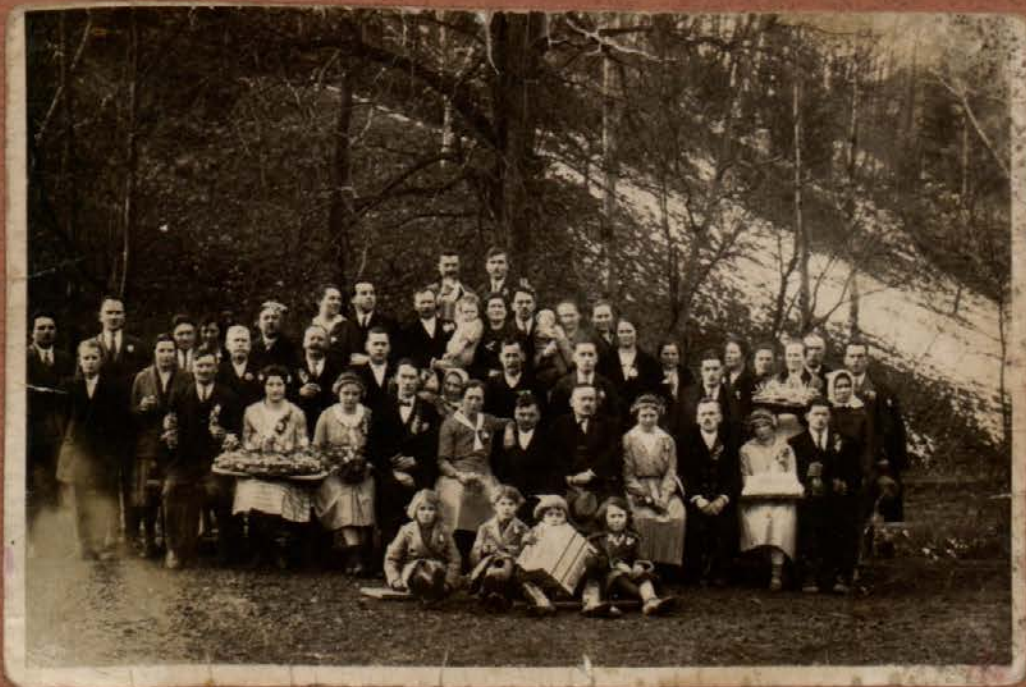
KMEČKA »OHČET« 1936 LETA