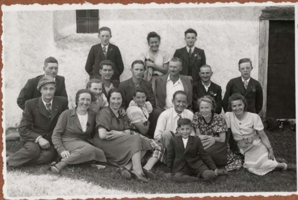
»NA ŽEGNANJU« PRI SVETI ANI 1936 LETA