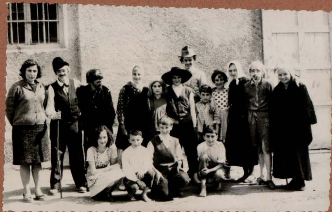
KEKEC IN PEHTA 1964 LETA