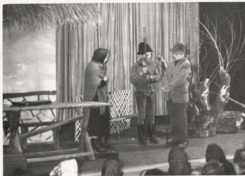
KEKEC NAD VOLČJIM BREZKOM 1964 LETA