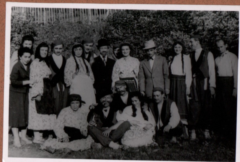
METEŽ UPRIZORITEV V MAKOLAH 1959 LETA