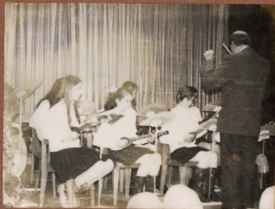
TAMBURAŠI NA PROSLAVI DIRIGENT ANTON ŠVAGAN 1973 LETA