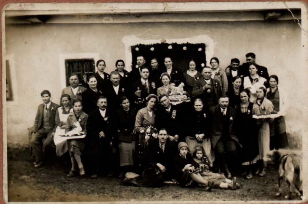
KMEČKA »OHČET« 1938 LETA