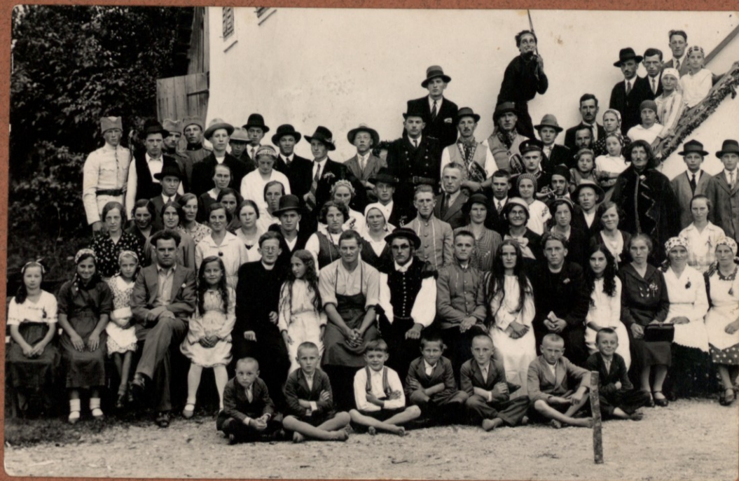
SLEHERNIK PRVA DRAMSKA UPRIZORITEV V LAPORJU IN MAKOLAH LETA 1936