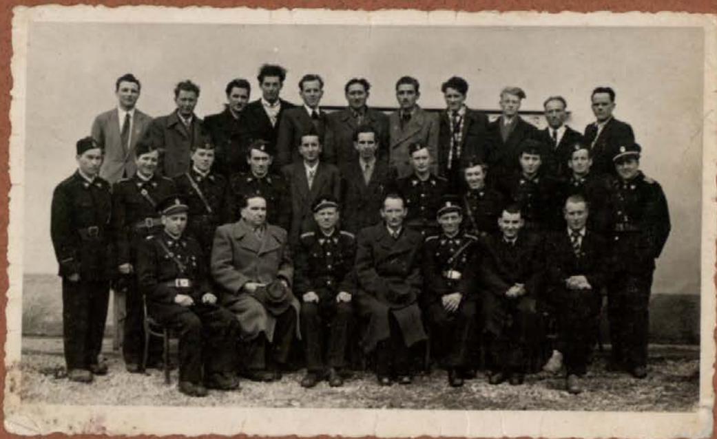
GASILCI 1946 LETA