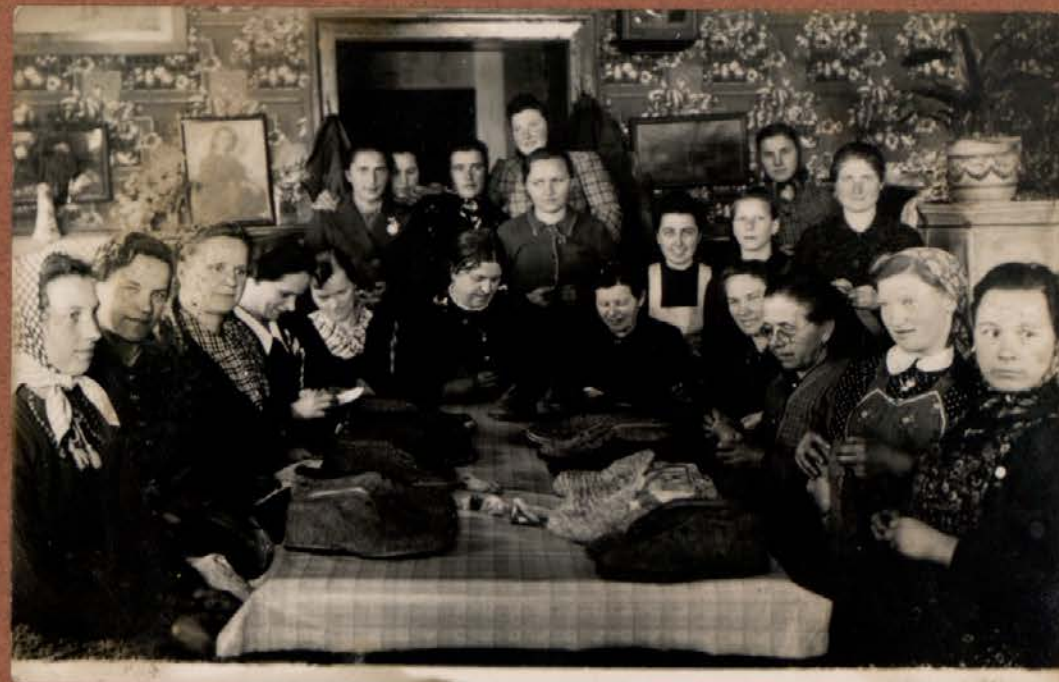
GOSPODINJSKI KROŽEK LETA 1942