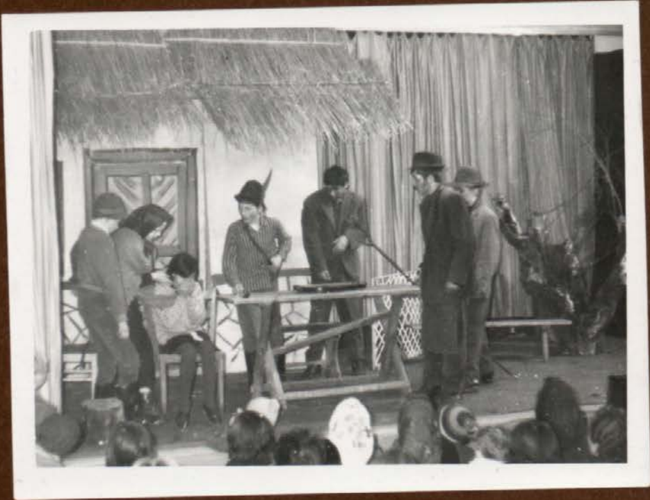
KEKEC 1968 LETA