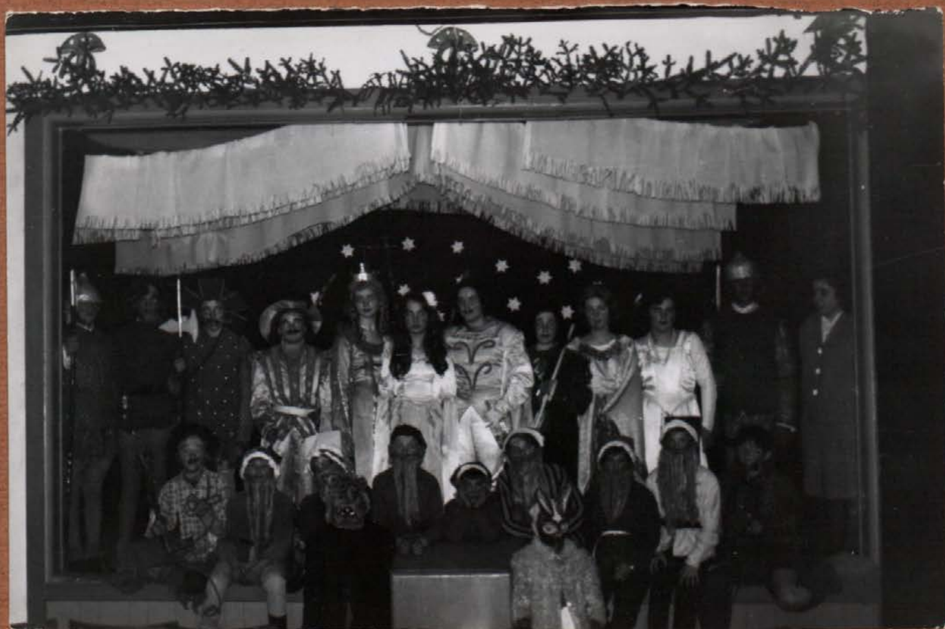
SNEGULJČICA UPRIZORITEV 1963 LETA