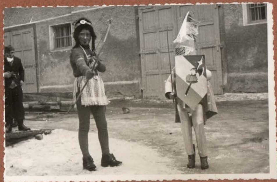
PUST LETA 1963