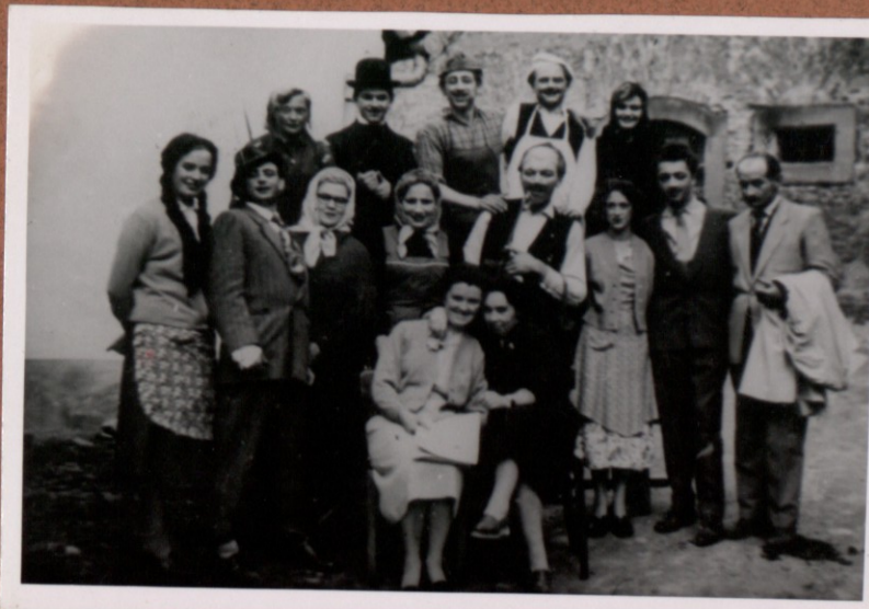
TRJE VAŠKI SVETNIKI UPRIZORITEV V MAKOLAH LETA 1956