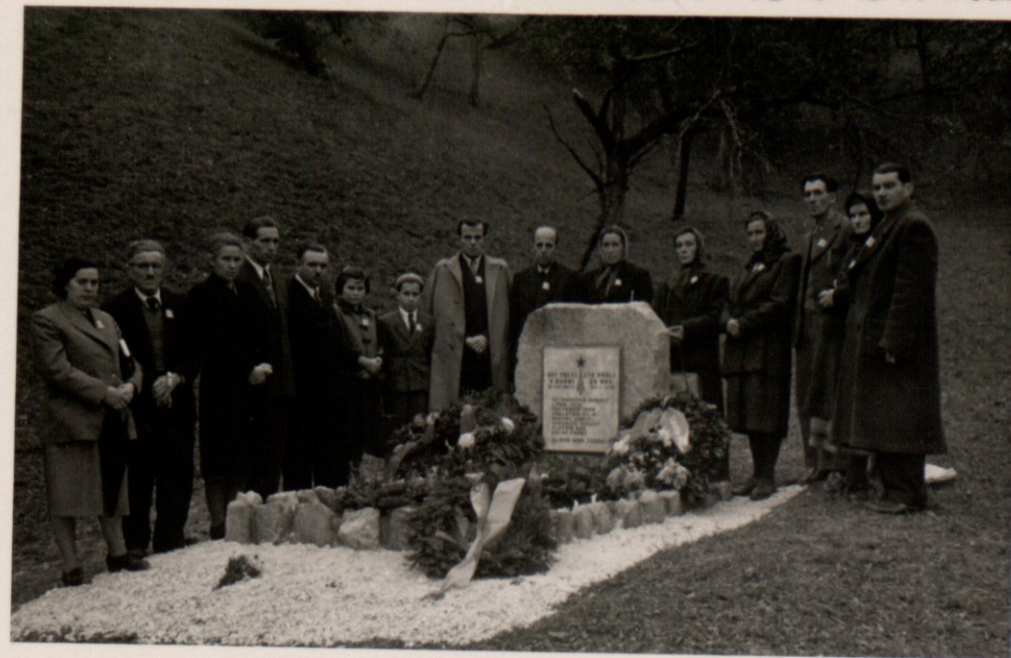
SPOMINSKA PROSLAVA STODREŽ 1955 LETA