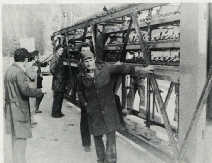
Svečana otvoritev nove tovarne je bila 23. novembra. Nekaj dni pred tem so delavci kodranke preselili še zadnje stroje iz starih prostorov v nove. Pri delu so bili madijivi in nihče ni gledal na uro. Vredni so pohvale.