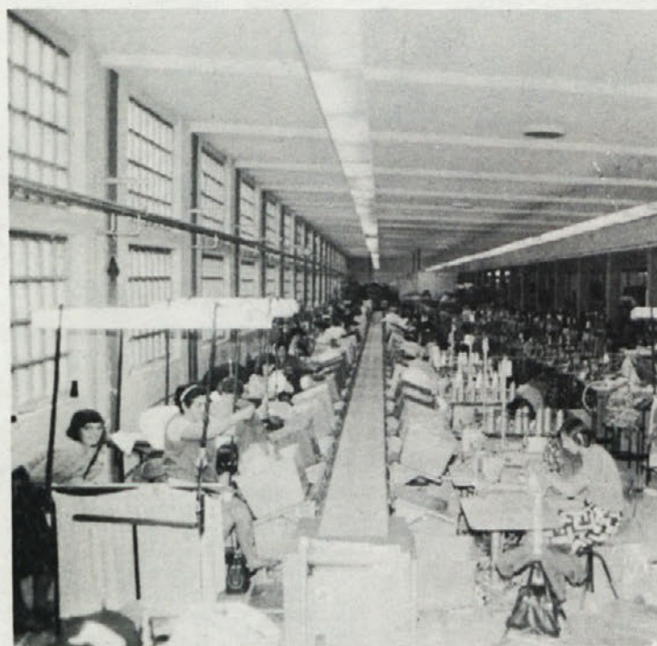
Tek oča trakova je končno dobila tudi metliška konfekcija. Delavke pravijo, da je zdaj veliko prijetneje delati, še lepše pa bi bilo, če ne bi bilo tako zelo vroče. Ventilatorji, ki brijajo v stenah, le vrtničijo zrak, ohladi pa ga bolj malo. Potrebne bi bele klimatske naprave.