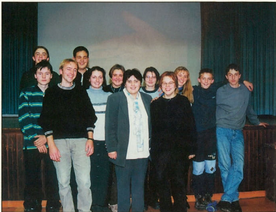
Mladi ustvarjalci Kulturno prosvetnega društva Stoperce.