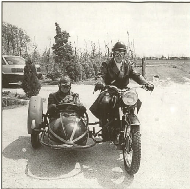
Stari – dobri prikoličar.