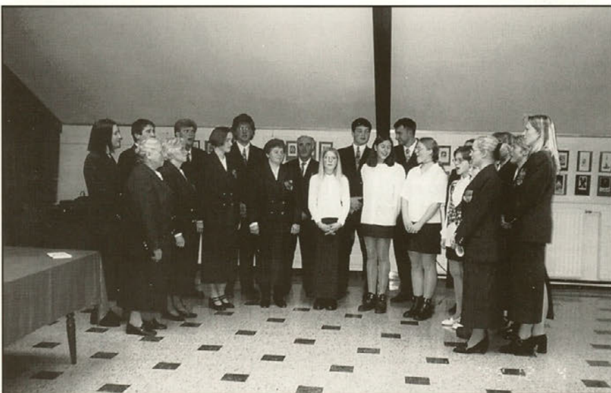
Prisotnim so zapeli pevci Mešanega pevskega zbora KUD Majšperk.