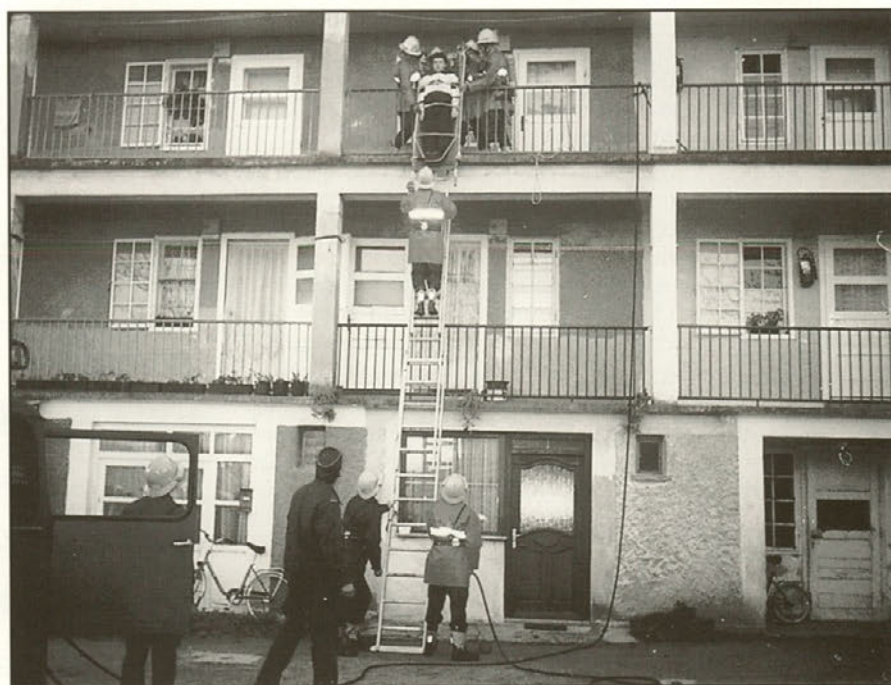
Ponesrečenca so rešili po lestvi s pomočjo nosil. Hvala Bogu, bila je le vaja.