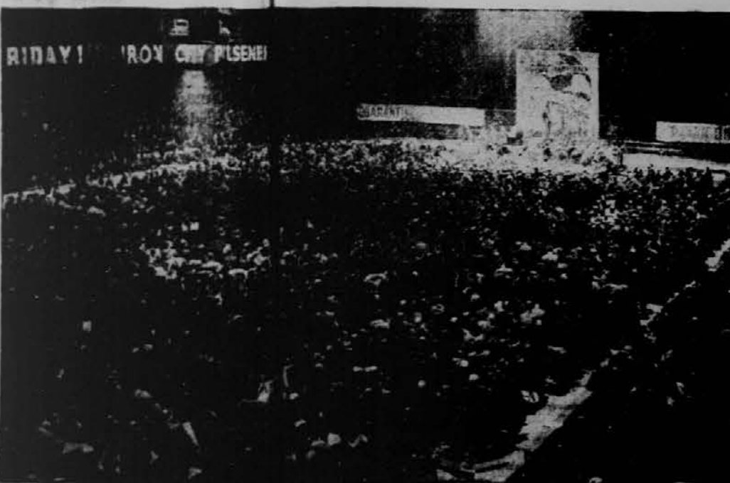
Pogled v dvorano v Pittsburghu, kjer se je vršil kongres za mir in demokracijo.