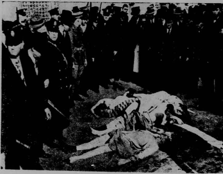
Iz državne kaznilnice v Columbia, S. C., je skušalo pobegniti šest kazencev. Stražniki so jih pa premagali s plinskimi bombami ter jih odnesli na dvorišče, da so se zopet zavledli.