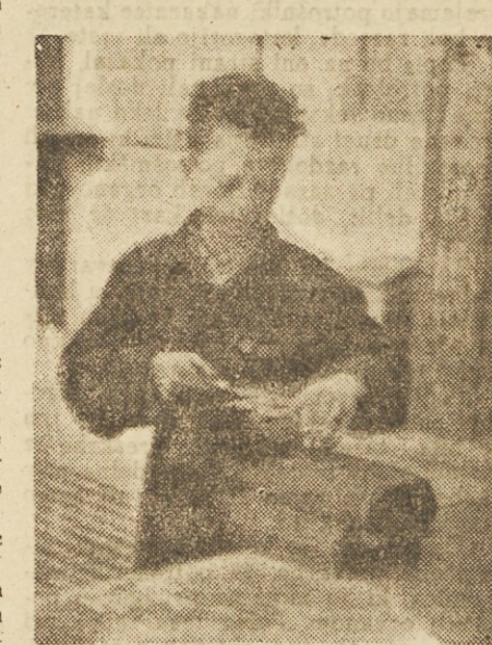
Najmlajši učenec v šoli

Sicer pa je še mnogo žena le-tu v tovarni. Zlite v tovarniško delovno družino bijejo trd in oster boj za izpolnitev plana. Porazdeljene v delovne brigade skupaj s tovariši ustvarjajo novo in lepše življenje vsem delovnim ljudem v domovini. Ko jih gledaš v lakirnici, ko