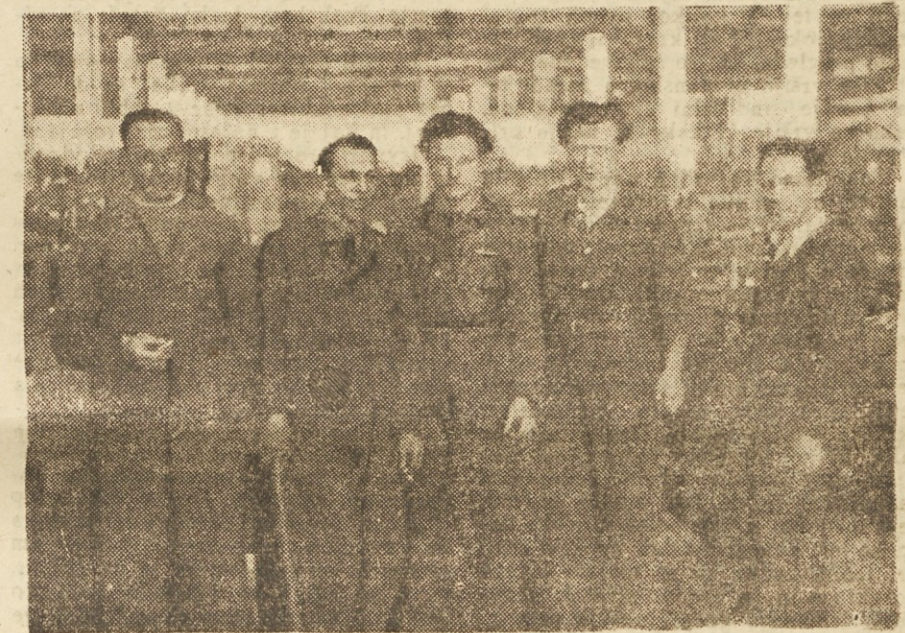
Najboljša mladinska brigada

»Naj pridejo tisti, ki govore v praskem in budimpeštanskem radiu grdo o