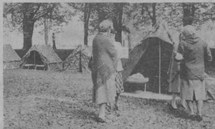
Hipno naselje v športnem parku Kodeljevo