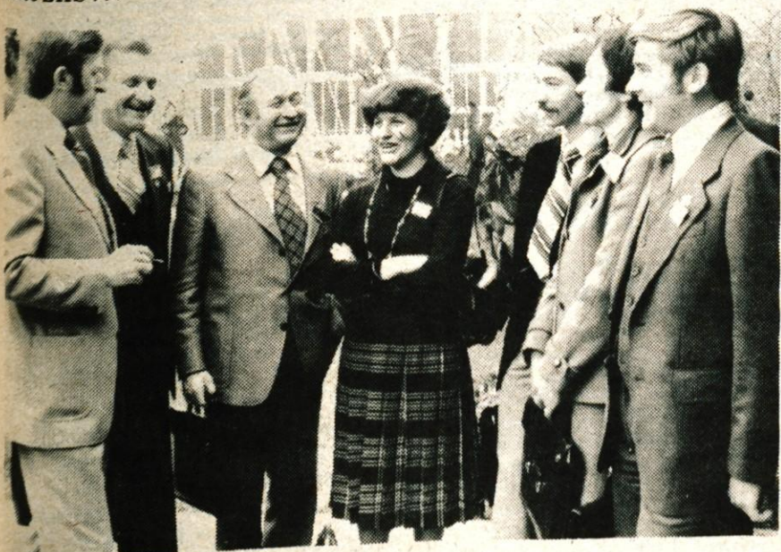
Gorenjski delegati pred začetkom kongresa...