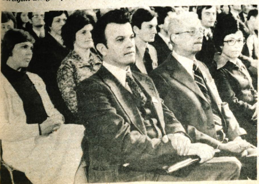
Delegati in gostje z Gorenjske med kongresom...