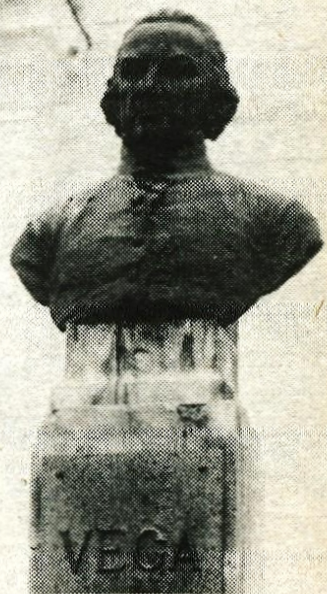
Spomenik Juriju VEGI v Moravčah (bronasto poprsje je delo kiparja Ivana Zajca)

No, nekaj pa je (sevé, v prejšnjem stoletju) le vezalo Zagorico z Moravčani, ne le farna pripadnost in slab kolovoz čez Murovico, pač pa tudi domača obrt - pletenje slamnatih kit za tovarne slamnikov v Domžalah in Mengšu.