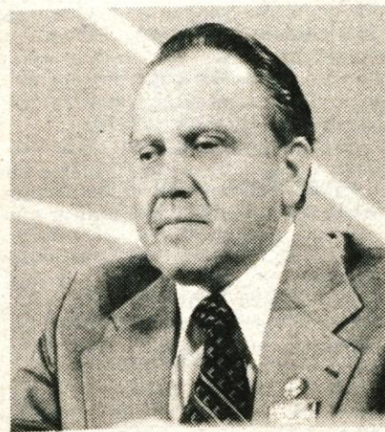
Predsednik CK ZKS France Popit je odprl kongres in spregovoril o nalogah komunistov v razvoju socialistične demokracije v Sloveniji...

nizaciji pa mora biti tudi povezan z interesom delavca in občana v krajevni skupnosti.