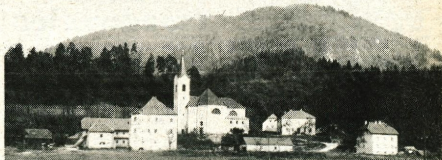
Sv. Helena ob Savi pri Dolskem, izhodišče za pot na Zagorico, rojstno vas Jurija VEGA. - V ozadju 740 m visoka Murovica.