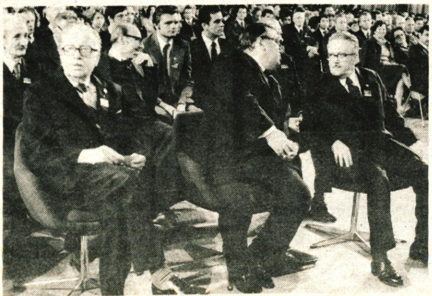
Kongresa slovenskih komunistov so se udeležili tudi član sveta federacije Miha Marinko, sekretar izvršnega komiteja predsedstva CK ZKJ Stane Dolanc in član predsedstva ZKJ in predsedstva SFRJ Edvard Kardelj...