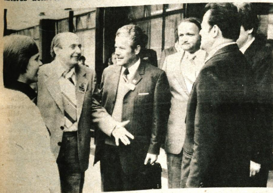
Iz vseh gorenjskih občin so v ponedeljek prihajali delegati občinskih konferenc ZKS...

Med letom 1965 in 1971 je bilo v Sloveniji veliko gospodarskih sporov in sicer med 70.000 in 86.000. Potem je bilo število gospodarskih sporov nekoliko nižje, zadovoljiv učinek pa je prišel šele z zakonom o zavarovanju plačil, saj je leta 1976 padlo število sporov na 15.326, kaže pa, da bo v letu 1977 še nižje, saj jih je bilo v prvem polletju le 3855.