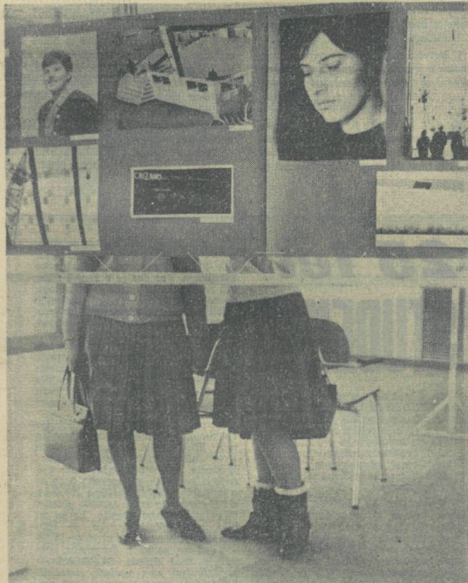
Pred kratkim je bila v Studentskem naselju razstava umetniške fotografije študentskega fotokluba SN. Razstavljenih je bilo precej slik znanih avtorjev, vendar smo pogrešali nova imena, predvsem pa slike iz študentskega življenja. Razstavo si je ogledalo precej študentov.