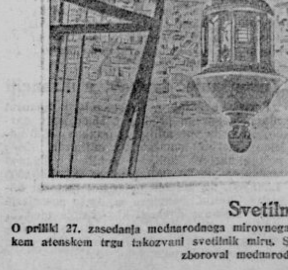
O priliki 27. zasedanja mednarodnega mirovnega kongresa v Atenah so postavili na 277 m visokem atenskem trgu takozvani svetilnik miru. Svetilnik bo prižgan vselci, kadar in kjerkoli bo zboroval mednarodni mirovni kongres.

Mati: »Pa še kako! Za množenje je bil prvi v šoli.«