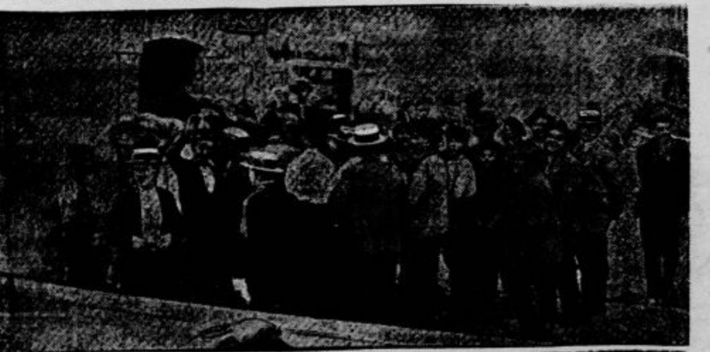
»Pobijanje« kuge s človeškimi sredstva — s cepitvami.