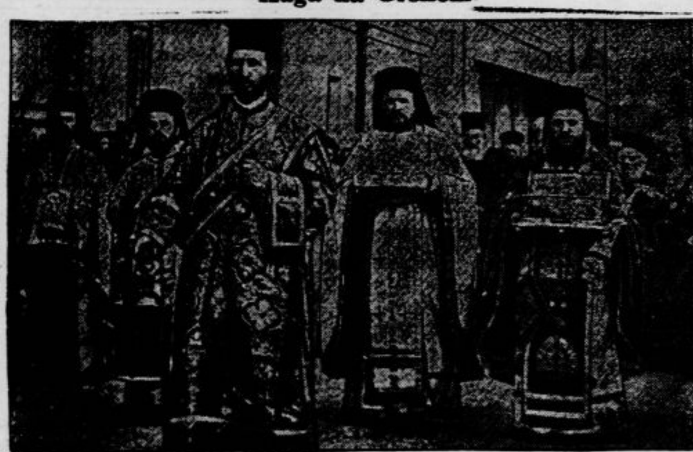
»Pobijanje« kuze s pomočjo vere in dragocenih relikvij.