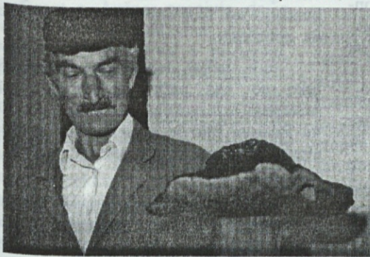
Oset Maks našel naj jurčka