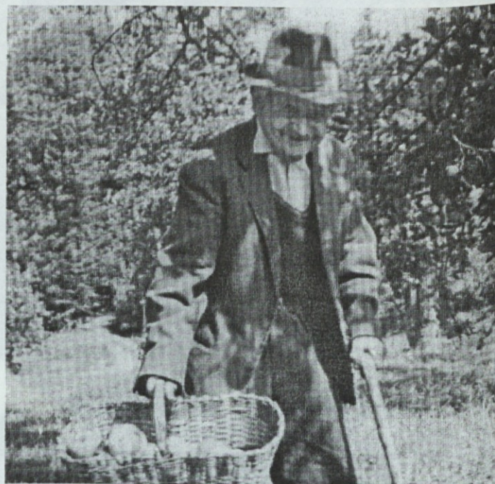
Kljub desetim križem če vedno delaven

Potem sem 5 let služil pri Bohorču. Ne vem, katerega leta je že bilo, ko sem moral na "štelngo." Vse sem naredil, da bi se izmaknil vojski, in ko mi je to uspelo, sem moral za kazen na prisilno delo v Nemčijo. Tudi tam nisem bil dolgo, saj sem že po enem mesecu pobegnul in se nato tako dolgo časa