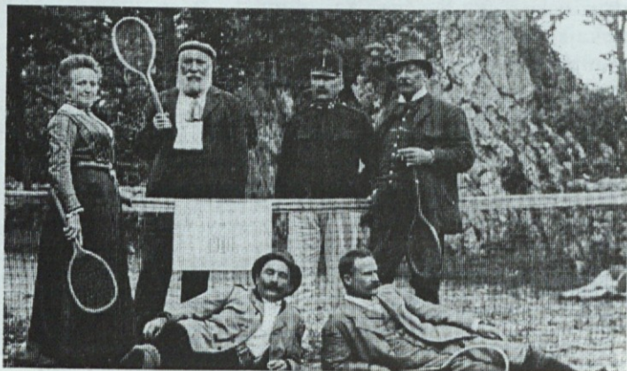
Ustanovitelji tenis kluba leta 1910

Planina je spet pričela oživljati po letu 1970, ko je bila najprej zgrajena nova šola, nato Zdravstveni dom in