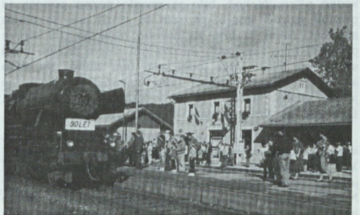
90 let Rogačana