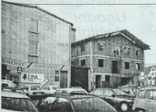
Arhitektura mestnega središča