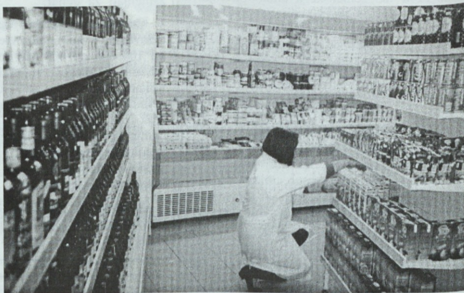
Dobro založena trgovina AMON Živila na tržnici