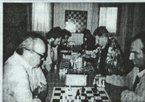
Zmagal je Pešec iz Celja

šahiste iz Slovenskih Konjic. Igrala se bodo še štiri kola, naš cilj pa je osvojitve vrha. Čaka nas težko delo, saj tekmuje kar šestnajst ekip.