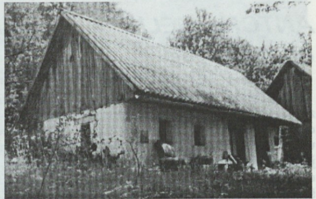
Janezov domek v Tajhtah