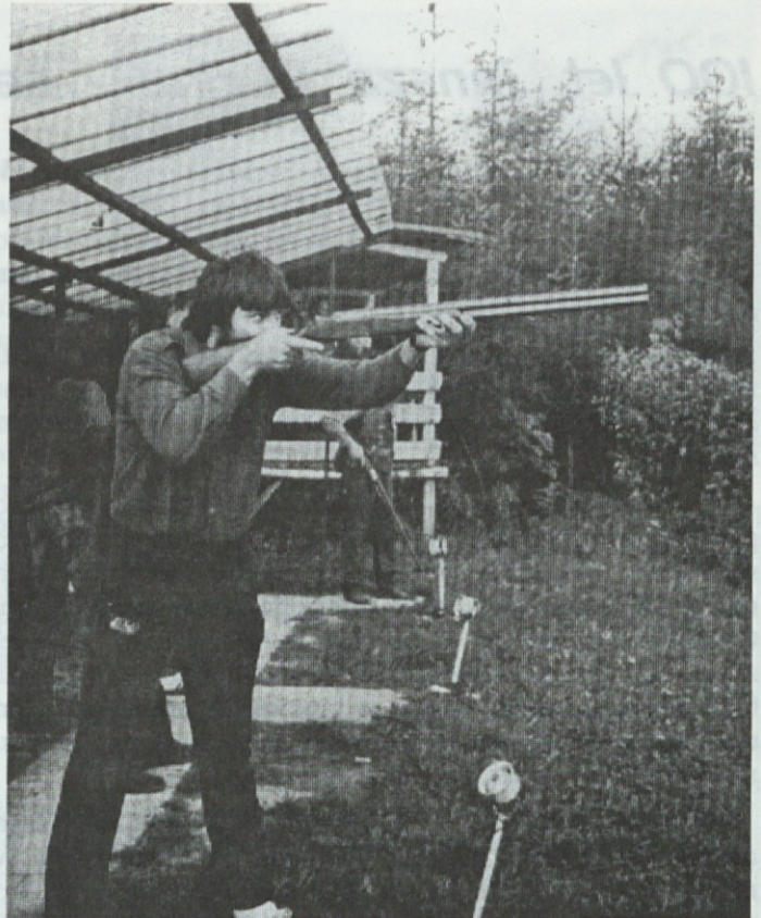
Pri streljanju na glinaste golobe so zmagali lovci s Planine