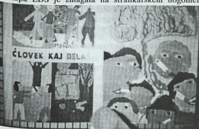
Razstava v Alposu: Otroci - likovniki razmišljajo