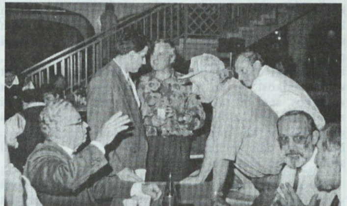
Tudi "taglavni" so se ogreli