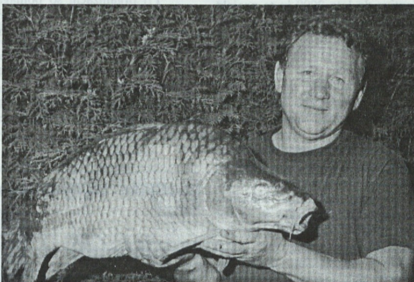
Krap pa tak, da te kap