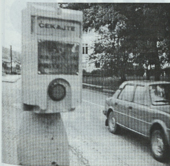
Zakaj ne tudi v cirilici (Čekajte...)

Po vzgledu po pravem občinskem parlamentu tudi v otroškem parlamentu ne bo prostora za strankarstvo.