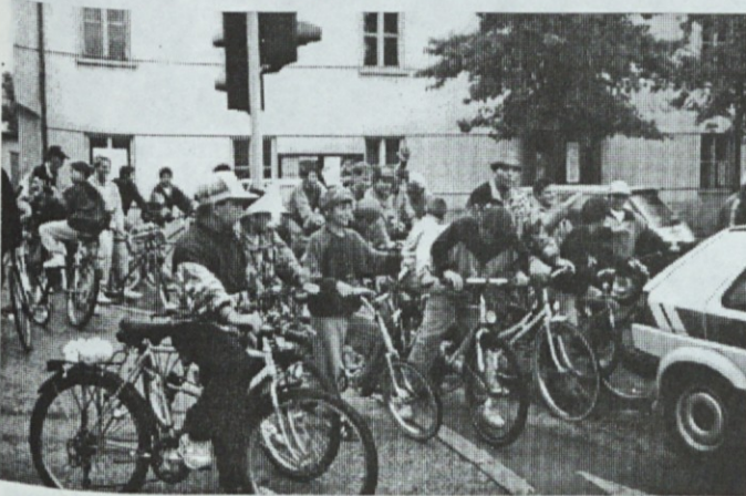
Kolesarski dan 1993