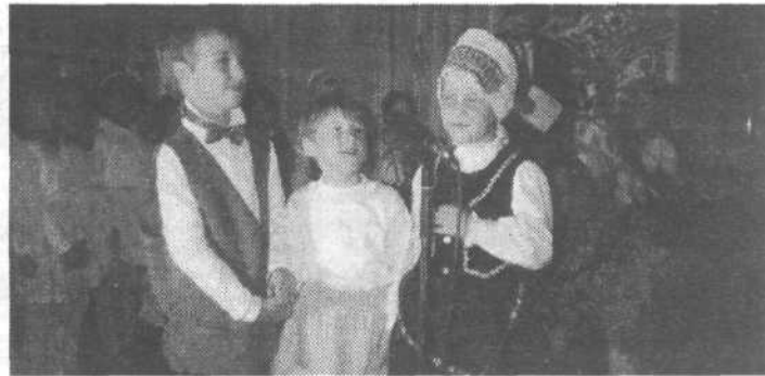
Takole veselo in korajžno so mali korenjaki zapeli himno o Ribniku