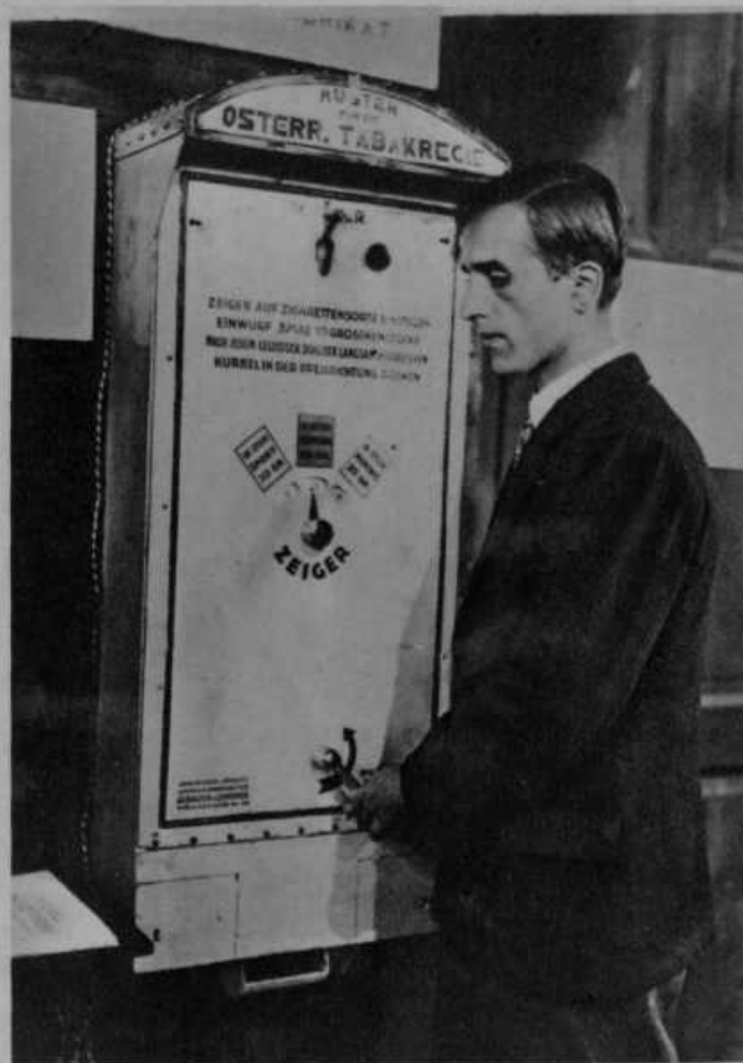
Automate za cigarete

Tako se imenuje govoreči in pojoči film. Predvajali so ga te dni v New-Yorku. Podobe v kinu so govorile in pele kot v gledališču. Kakor se vidi iz slike, je pritrjen na aparat gramofon, ki je seveda tako sestavljen, da se časovno vedno na las točno ujema z igro. Velika hiba teh filmov pa bo ostala, da bodo govorili samo angleško in še v nekaterih drugih jezikih, ker se za male narode pač ne bodo izplačali.