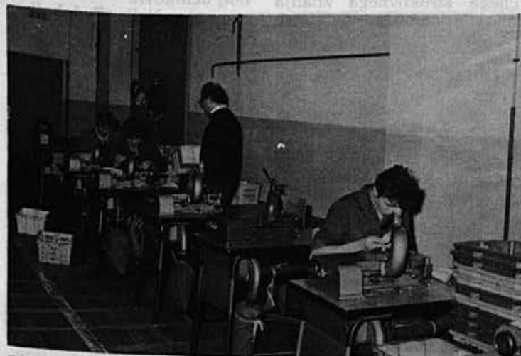
Delo teče dobro, pravijo v Gorenji vasi

»Moram reči, da delo teče kar dobro; trenutno zaključujemo proizvodnjo gornjih delov sandal za ASPO. Poleg tega izdelujemo gornje dele za salonke za izvoz v Sovjetsko zvezo. Lahko ocenim, da delo dobro poteka, na kar vpliva pravočasna oskrba in priprava proizvodnje. Tako