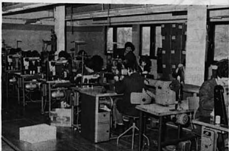
Ob novem traku v Šentjoštu