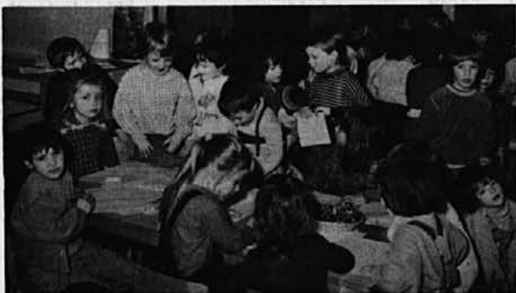
Malčki, k sreči, ne vedo ne za pomanjkanje prostora ne denarja ...