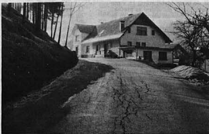
Temna senca pod bregom je ledeni pas, ki je kar nekaj časa ogrožal varnost v prometu