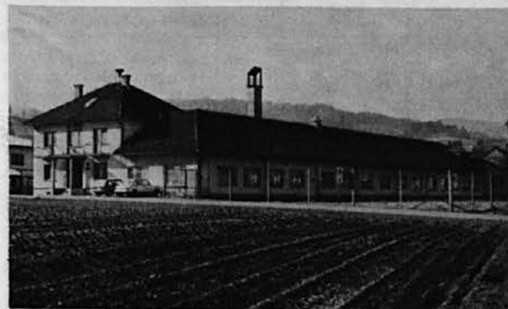
Bo obrat v Gorenji vasi kdaj še večji?