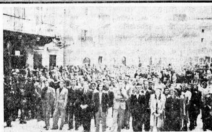
Sa veličanstvene smotre Sokolskog društva u Kotoru

ne придаваше значаја томе. Обична појава. Али када се то одужи до подне, па и по подне, онда тек схватисмо да се са нама дешава нешто необично, тим пре што не чусмо ниједан пуцањ.