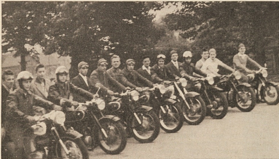
Še pomnite fantje iz Essena, kako je bilo leta 1958? Kot dirkalna kolona ste se postavili! Da, takrat je bil motor že bogastvo.

Iz lista „Družina“, ki izhaja v Ljubljani, posnemamo zanimivo pripombo v zvezi z