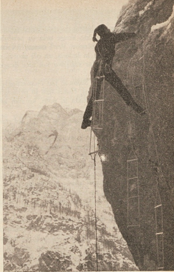
V kopni skali zasežene Triglavske severne stene

Drugega jutra je bilo nebo popolnoma jasno. Snega je zapadlo nad pol metra. Z gora