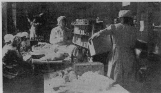
Urejanje sanitetnega materiala leta 1914

Vrednost materiala je ob združitvi obeh društev znašala 5200 K, pozneje pa se je znižala, ker so iz prevelike zaloge perila in drugih predmetov izločili nepotrebno in to darovali ljubljanskim dobrotelnim zavodom. Ma-