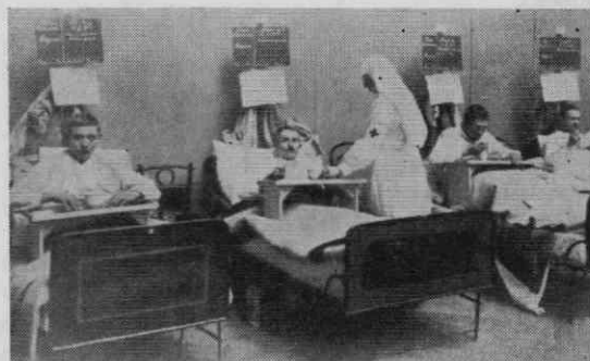
Ranjenci v oskrbi Rdečega križa leta 1914 (Original v knjižnici Narodnega muzeja v Ljubljani)