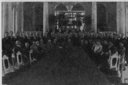
Seja avstrijskega Rdečega križa v vladni palači v Ljubljani (Original v knjižnici Narodnega muzeja v Ljubljani)

Že pri opisu Ženskega pomočnega društva in Deželnega pomočnega društva smo zapisali, da jima je pomagala Kranjska hranilnica s svojimi vsakoletnimi darovi. Zato sta obe društvi imenovali hranilnico za svojega častnega člana. Tudi po združitvi je le-ta počastila novo dobrodelno in humano ustanovo z vsakoletnim zneskom 1200 K. V zadnjih letih pred prvo svetovno vojno se je ta znesek znatno znižal. Med darovalce, ki so kranjsko ustanovo RK obdarovali z enkratnim zneskom, sodijo