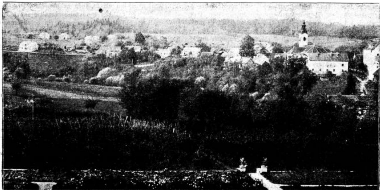
Uspeh škropljenja z „karbokrimpom“ v sadnem vrtu na kmetijski šoli na Grmu. Pritlična jablana na desni so škropljena, na levi strani pa neškropljena.

vadne pitne vode in nato mrzlo kašo iz ječmenovega zdroba in ribje moke. Izkušnja je pokazala, da pujske mnogo bolje in močnejše vzredimo, ako jih pustimo sesati do 10. tedna in jim kot priboljšek pokladamo le sirovo mrzlo kašo ječmenovega zdroba in ribje moke — kakor pri našem običajnem načinu vzreje, ko pustimo sesati le do 5. tedna in krmimo pujskom kravje mleko. To mleko je čisto druge sestave kot prasičje in dokazano je, da povzroči pri pujskih drisko največkrat kravje mleko, ki ni prave sestave in ni več povsem sveže.