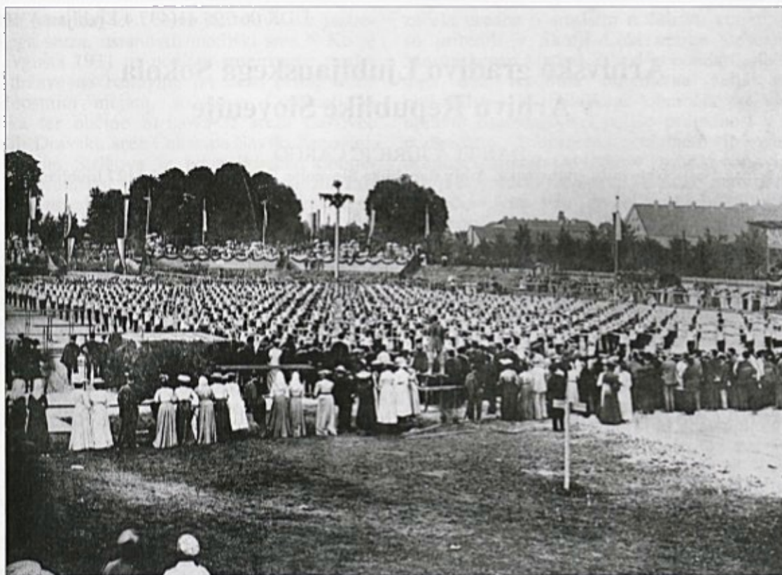
II. slovenski vsesokolski zlet v Ljubljani 1904. Proste vaje članov

Konec 19. stoletja se je pod vplivom dr. Viktorja Murnika v društvu začelo preredno gibanje in v začetku 20. stoletja je društvo preraslo iz narodnobudiljskega čitalniškega v pravo telovadno društvo. Dr. Murnik se je naslonil na načela telovadnega gibanja na Češkem, ki ga je povezal Miroslav Tyrš v veliko idejno-moralno gibanje s pomočjo sistematično urejene telovadbe. 6 Glavna dejavnost društva je postala organizirana, redna vadba pod vodstvom vaditeljskega zbora (ustanovljen 1896, pozneje poimenovan prednjaški zbor), v telovadbo so vključili ženske in podmladek (naraščaj). Posebno se je dr. Murnik posvečal sistematično organiziranemu izobraževanju telovadnega kadra, to pa je vplivalo na dvig kakovosti slovenske telovadbe ter razvoj slovenskega telovadnega izrazoslovja. Telovadba je na začetku potekala po raznih krajih po Ljubljani, saj društvo ni premoglo svojega telovadišča ali telovadne dvorane. Od leta 1874 do 1882 so člani društva telovadili v novi telovadnici realke v Vegovi ulici, ki je premogla opremo in garderobe. Leta 1888 je društvo začelo zbirati denar za zgradbo svojega sokolskega doma. 7 Ko so možnosti za zidavo novega po-