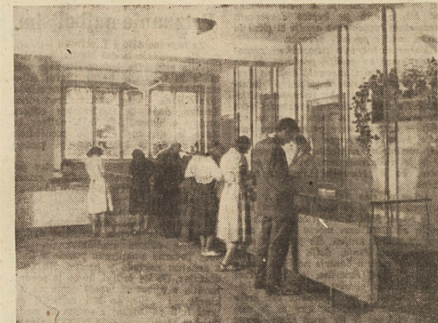
Del izposojevalnice v Delavski knjižnici

Čeprav so brošure v hrvatsčini, bodo kljub temu koristno služile našim ljudem v tovarnah. Cena je nizka in kolikor presega narodelo 3000 din. odobri založba 15% popusta. Priporočamo našim podružnicam delavskega sveta, da si te brošure naročijo. Posebno velja to za stroke, katerim je namenjen opis zaščitnih ukrepov pri delu.