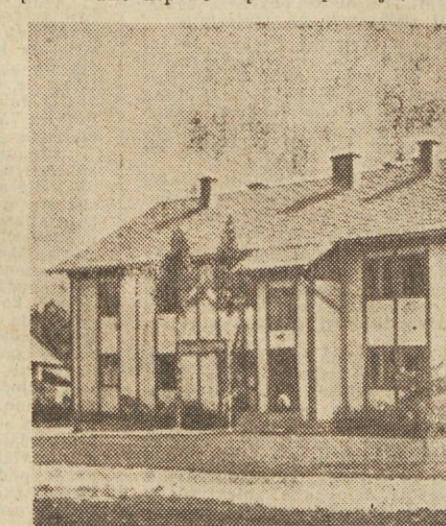
Dom tesarjev v Ljubljani

V soboto popoldne, ko so delavci podjetja »Tesarje« slavili zaključek gradnje in se vselili v nova stanovanja, so obenem prejeli tudi poveljno listino Glavnega odbora Zveze sindikatov Slovenije za proizvodne uspehe v prvem polletju.