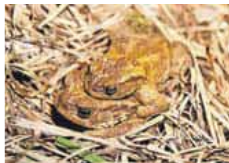
Mnoge žabe so prenesli kar v paru.