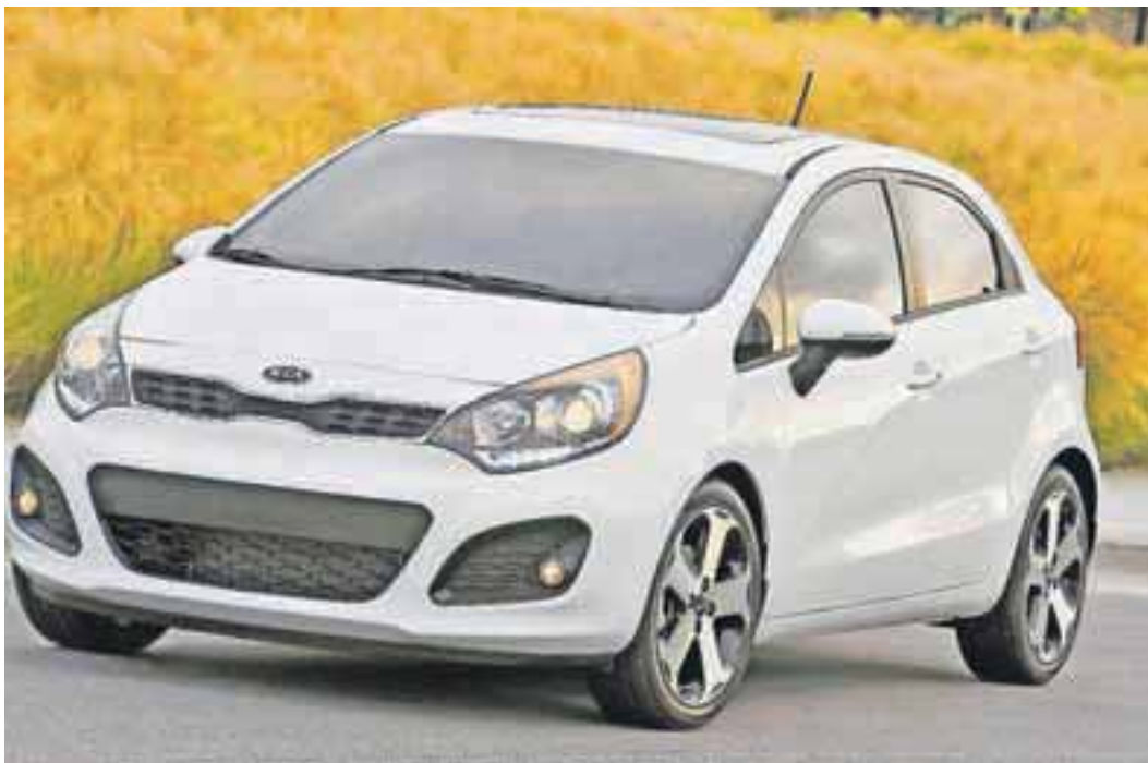
Rio je letošnja Kiina prodajna uspešnica.

Kiin globalno najbolje prodajan model marca je bil Rio s 44.371 prodanimi vozili. Športni terenec Sportage, ki v Sloveniji že nekaj časa kraljuje v svojem razredu, je bil drugi (32.966 vozil), medtem ko je na najnižjo zmagovalno stopničko stopil Forte, predstavnik nižjega srednjega razreda (32.799). Med »peterico veličastnih« sta se še uvrstila limuzina Optima (23.981) in veliki športni terenec Sorento, ki je našel novih 17.402 strank. Miroslav Cvjetičanin