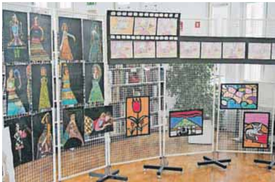
V knjižnici si je mogoče ogledati razstavo likovnih izdelkov učencev Osnovne šole Medvode.