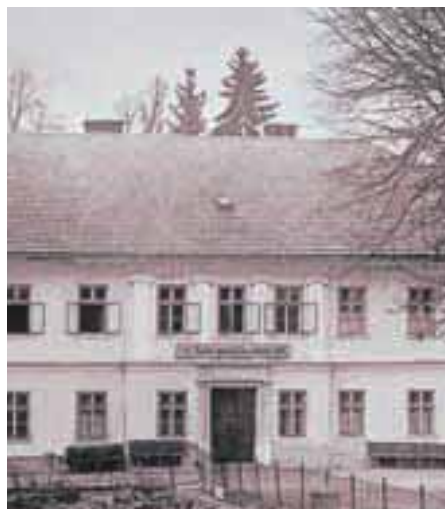
Stavba nekdanje gasilske šole v Medvodah.