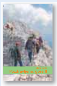
ali knjiga Pozdravljene gore II