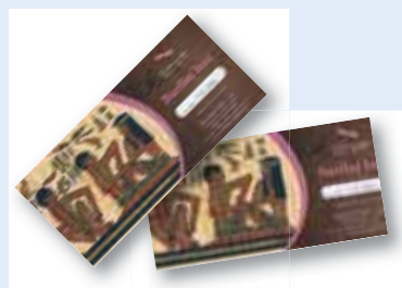
ali darilni bon za refleksoterapijo v vrednosti 20 EUR