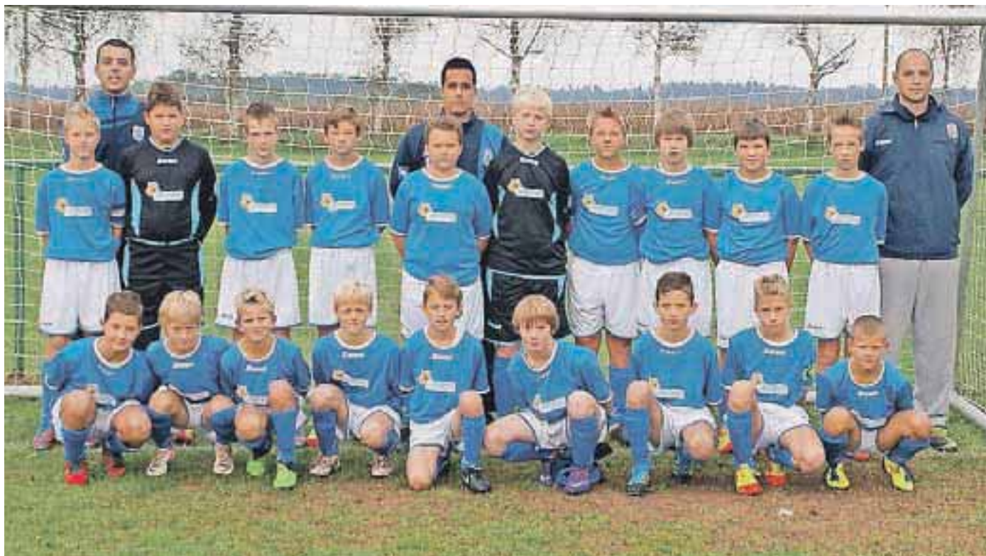
Nepremagljiva ekipa dečkov U12