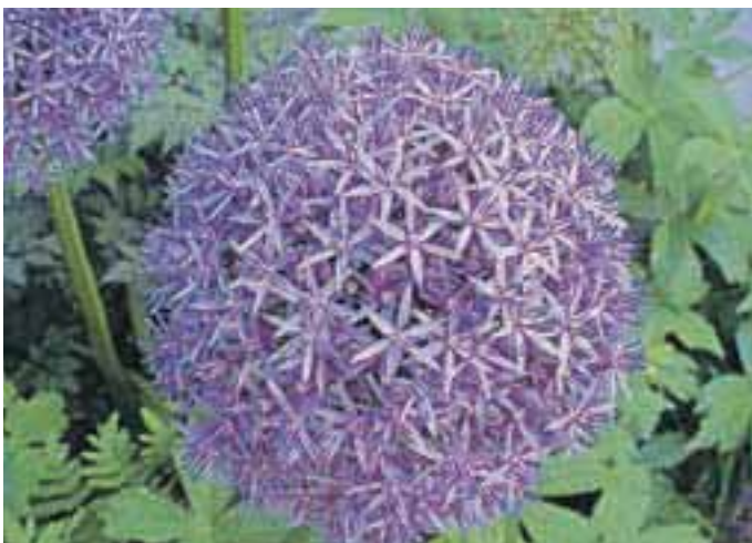
Veliki cvetovi Allium giganteum