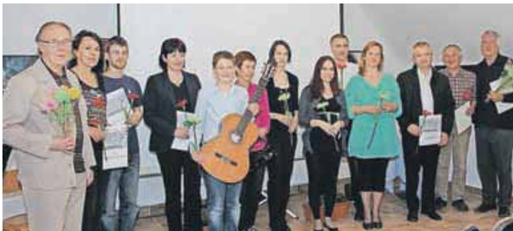
Za KUD-om JaReM je prvo leto uspešnega ustvarjanja.