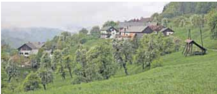
Nadzorni odbor je opravil tudi nadzor nad poslovanjem Krajevne skupnosti Katarina.