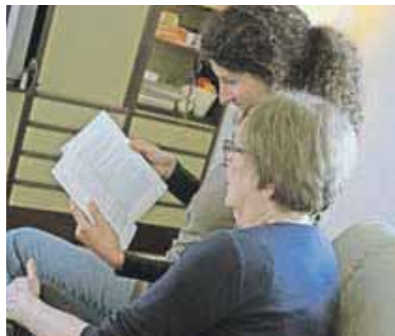
V Medvodah je pomoč na domu lani potrebovalo osemdeset uporabnikov (fotografija je simbolična).