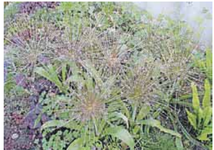
Zanimivi cvetovi luka schubertii

lukov po cvetenju ne izkopavamo, saj začnejo tvoriti zarodne čebulice, s katerimi se razmnožujejo. Zato jih bo na našem vrtu iz leta v leto več. Ko se dovolj namnožijo, jih lahko po cvetenju razsadimo. Prav tako lukom po cvetenju ne porežemo cvetov, saj so ti lahko čudovit okras vrtu vse do pomladi. V cvetovih dozori tudi seme, s katerim se luki razmnožujejo, obenem pa je tudi hrana pticam. Okrasnih lukov ne pesti veliko boleznih in škodljivcev, saj jih s svojim značilnim vonjem po čebuli odganjajo. Občasno se lahko pojavi le kakšna plesen ali čebulna muha.