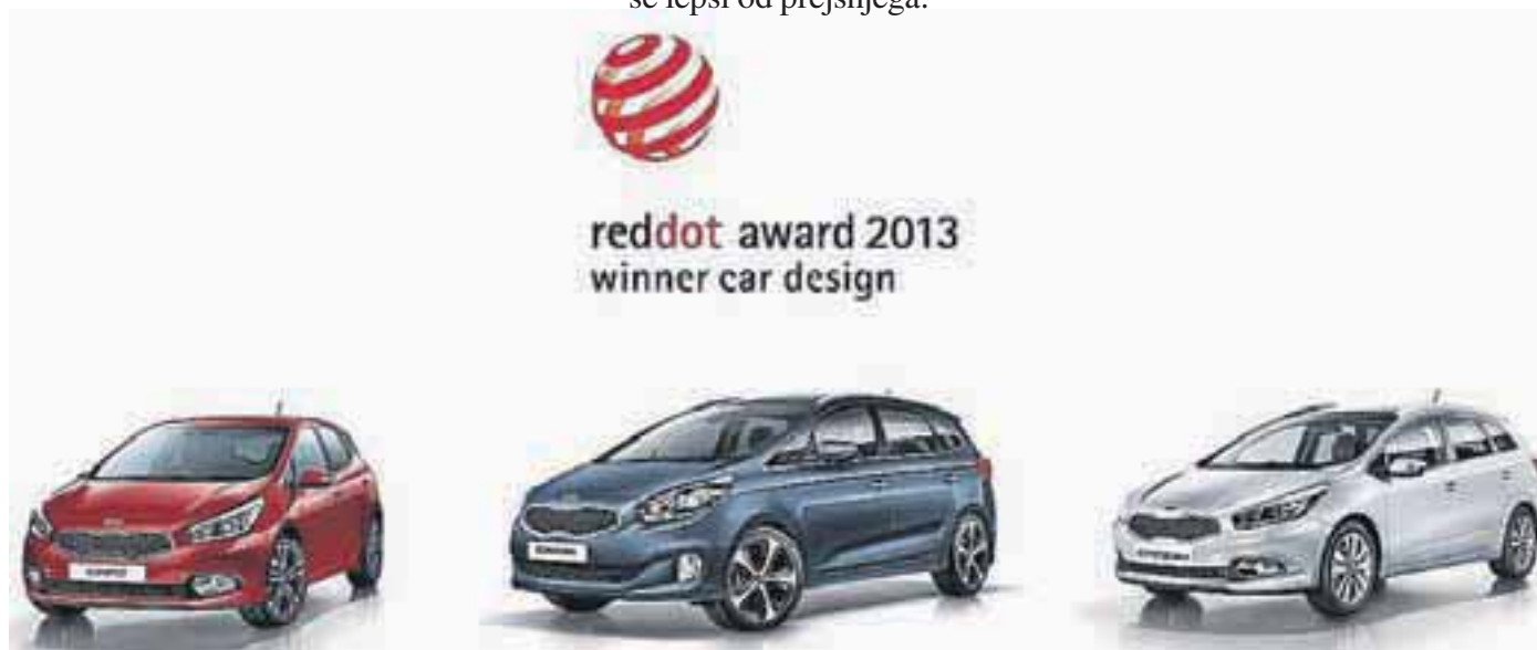
Nagrajeni lepotci iz Kiine družine

Če ste ljubitelj avtomobilizma, ste verjetno že ugotovili, da je vsak nov model avtomobila Kia še lepši od prejšnjega.