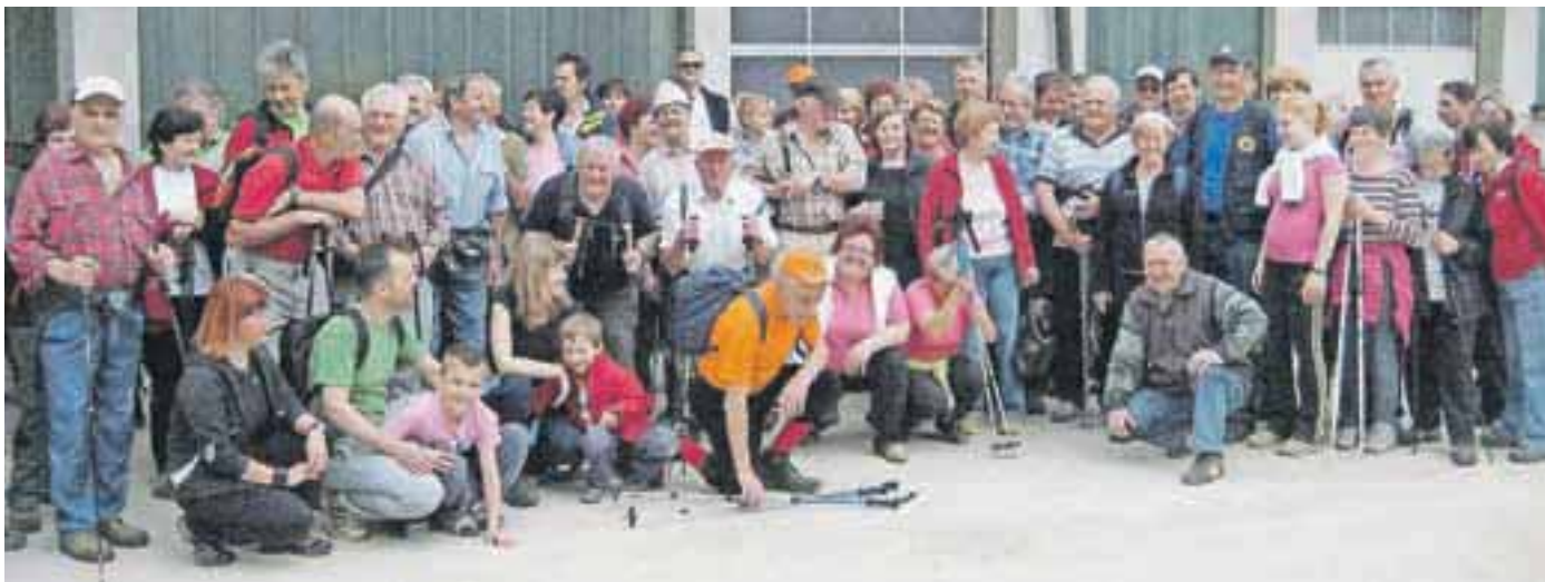
Po Poti spominov in prijateljstva se vsako leto poda več pohodnikov, letos jih je bilo že okrog sedemdeset.

V turističnem društvu Smlednik so tudi letos na dan upora proti okupatorju pripravili pohod po Poti spominov in prijateljstva.