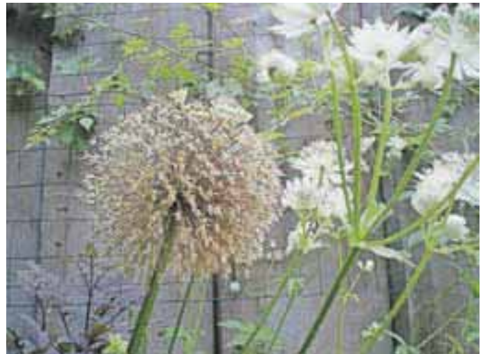
Cvetovi lukov so zanimivi tudi po cvetenju.

Pestrost okrasnih lukov lahko opazimo že pri nakupu čebulic, saj se te razlikujejo po velikosti. Najmanjše najdemo v velikosti lešnika, tiste najbolj mogočne pa v velikosti pesti. Velikost čebulice nakazuje tudi mogočnost cvetov. Tiste najmanjše bodo cvele podobno kot drobnjak. Pri večjih pa se lahko premer cvetov giblje med 20 in 25 centimetri. Tudi v višini se luki močno razlikujejo. Ta se giblje od 20 centimetrov pa vse do mogočnih dveh metrov. Barve cvetov so običajno v vijoličnih in belih odtenkih. Pri nizkih malocvetnih lukih najdemo nekatere primerke tudi v rumeni, modri in rožnati barvi. Prednost lukov je tudi dolgotrajno cvetenje, saj traja približno tri tedne.