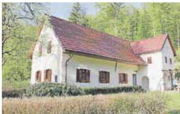
Na Aljaževini bo 18. in 19. maja potekal Ex Tempore.