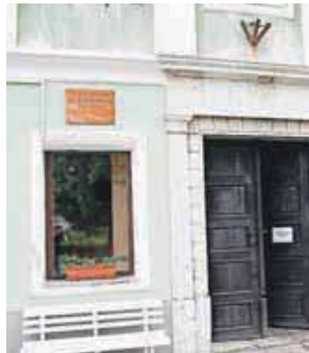
Ob obletnici zaprtja gasilske šole so odkrili spominsko ploščo.