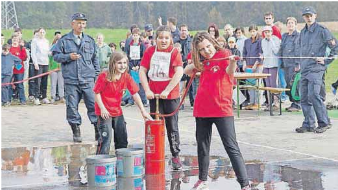
Svojo spretnost so mladi gasilci preizkusili pri ciljanju tarče z vodo.

katerih so se morali med drugim izkazati v hitrem zvijanju cevi in poznavanju topografskih znakov, svoje spretnosti pa so preizkusili pri ciljanju tarče z vodo. Potrebovali pa so tudi veliko teoretičnega znanja o gašenju požarov. Mladinci so se na štirikilometrski progi ustavili na šestih kontrolnih točkah, pripravniki