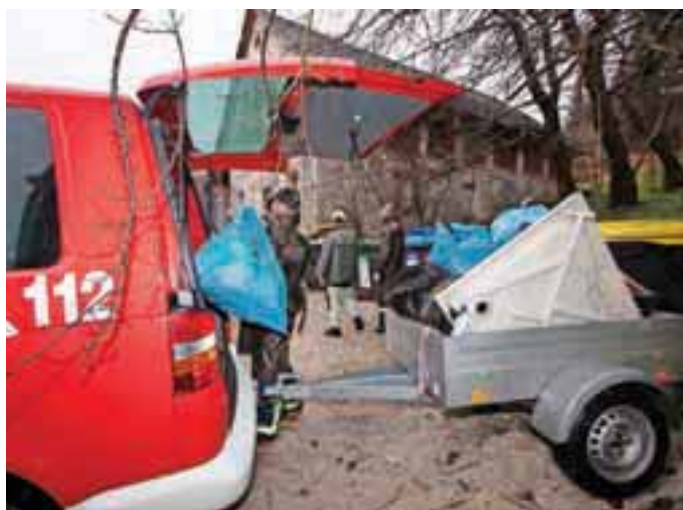
V Sori so prostovoljci v okviru čistilne akcije zbrali za dve avtomobilski prikolici odpadkov.