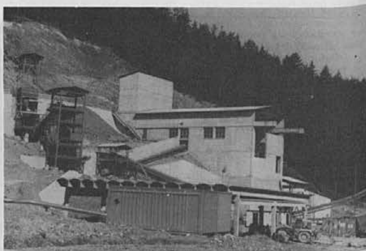
30. junija je bil v Rudniku urana Žirovski vrh prvi informativni dan. Na sliki: del predelovalnega obrata

Ta vpliv so ocenili približno takole: če vzamemo vse druge naravne vplive okolja, ki vplivajo na človeka, se zaradi rudnika poveča negativen vpliv le za 1 odstotek. Ves čas so prav varstvu okolja posvečali veliko pozornost in s pomočjo zunanjih institucij so ustvarili tako imenovan zaprt tehnološki sistem, tako da ni nobenih odpadkov, razen tehnološke vode, ki jo spuščajo v Brbovščico, ki pa zaradi tega ni