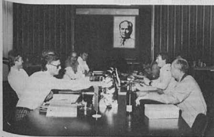
Konec junija so bili v Alpini predstavniki največjih kupcev iz ZDA, ZRN, Švice in Norveške