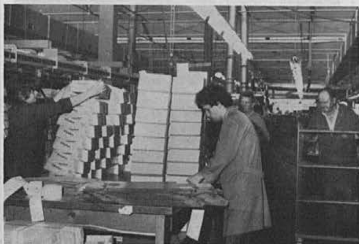
Še nekaj trenutkov in čevlji bodo na poti h kupcem. Ali bo spet kaj reklamacij?