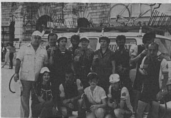
Veselo srečanje v eni izmed prodajaln (Zadar)

ki se je ne bi sramovali niti pravi dirkači. Krepko pred rokom smo prisopihali na Plitvice in prosti čas izkoristili še za delen ogled narodnega parka.