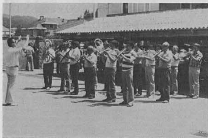
Pred odhodom so slovaški glasbeniki na našem dvorišču pripravili še improvizirani koncert

Tudi tu je bilo veliko težav, imeli smo le nekaj starih strojev iz bivših za-