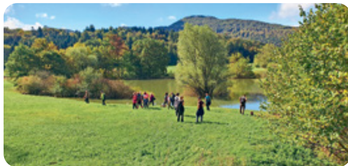
Utrinek z jesenskega pohoda po Radenskem polju 2022

Na prvi oktobrski dan smo se podali na 8-kilometrski pohod po jesensko obarvanem Radenskem polju – na kraškem osamelcu Kopanj nam je vodnica Olga pripovedovala o Prešernu, ki je svoja mladostna leta prebival na Kopanju. Od tod smo skozi gozd krenili do sistema Zatočnih jam in pohod zaključili pri Žabji hiši, kjer so si pohodniki ogledali razstavo o Radenskem polju in varstvu narave. Pred slovesom pa še posebno doživeltje – spoznavanje dvoživk v živo. Delavnica je potekala v sklopu projekta LIFE AMPHICON.