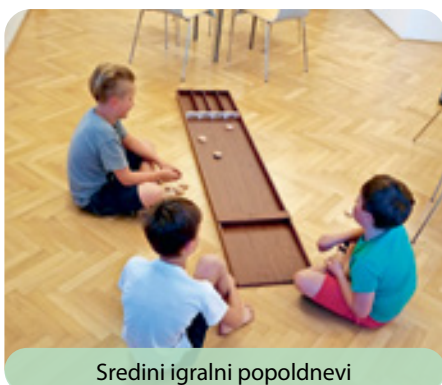
Sredini igralni popoldnevi