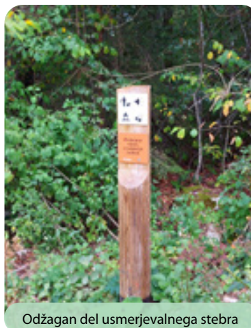
Odžagan del usmerjevalnega stebra