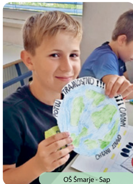
OŠ Šmarje - Sap