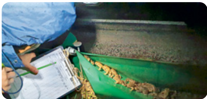
Spomladi 2022 smo v Krajinskem parku Radensko polje ob pomoči prostovoljcev preko ceste prenesli skoraj 15.000 dvoživk. (foto: Tina Stepišnik, april 2022)

Za trajnejšo rešitev se je Turizem Grosuplje, OE Krajinski park Radensko polje, v sodelovanju z Občino Grosuplje vključil v projekt LIFE AMPHICON, v okviru katerega bomo izvedli trajne ukrepe za ohranitev dvoživk.