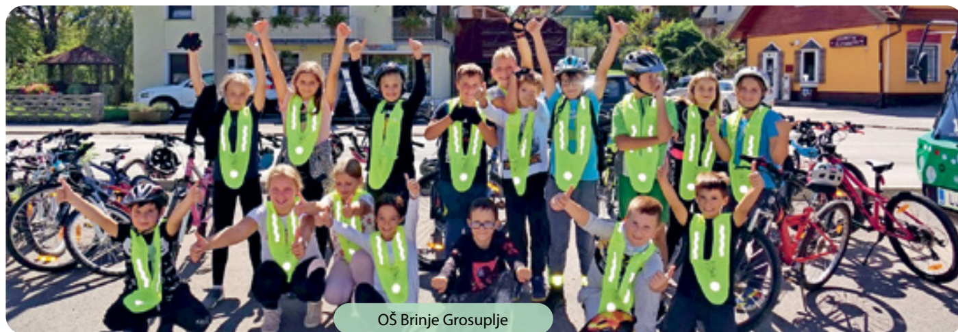
OŠ Brinje Grosuplje

V okviru Evropskega tedna mobilnosti je bilo zelo živahno na vseh treh osnovnih šolah na območju občine Grosuplje. Učenci so bili v sklopu kam-