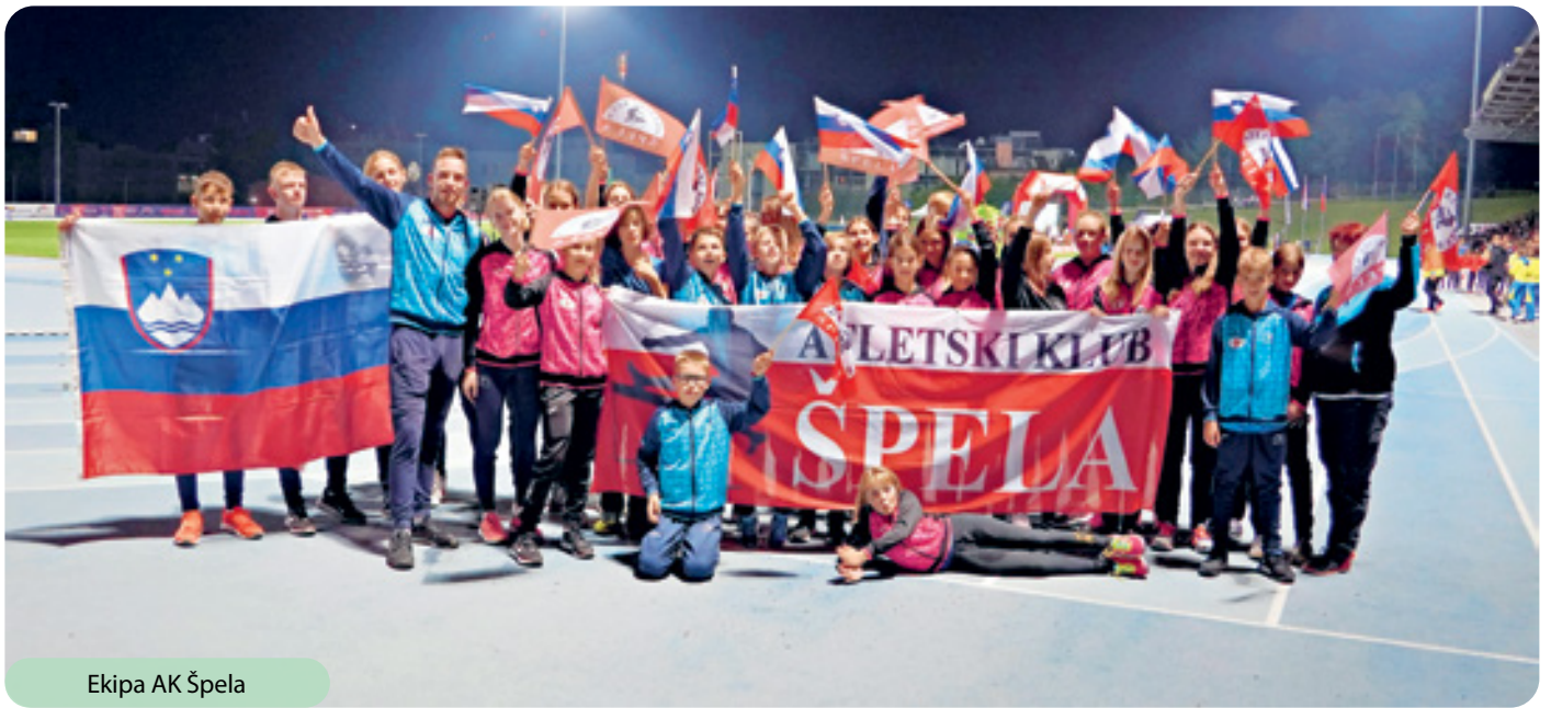
Ekipa AK Špela