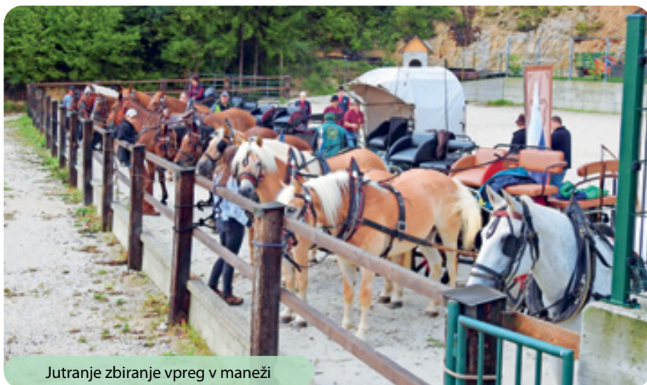
Jutranje zbiranje vpreg v maneži

Kaj je namen konjenice? Zakaj smo se sploh zbrali? Kje smo se vozili? Namen konjenice je druženje tako ljudi kot tudi živali. Te plemenite živali nam nekaterim pomenijo mnogo več kot samo številka v hlevu. In prav je, da se njihovi lastniki