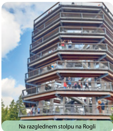
Na razglednem stolpu na Rogli

odlično izpeljali. Krjavelj in Deseti brat sta bila enkratna.