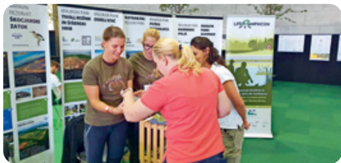
Predstavitev Krajinskega parka Radensko polje in projekta LIFE AMPHICON na sejmu Narava – zdravje

Ugriznite v jabolko tudi vi – z naravo do zdravja.