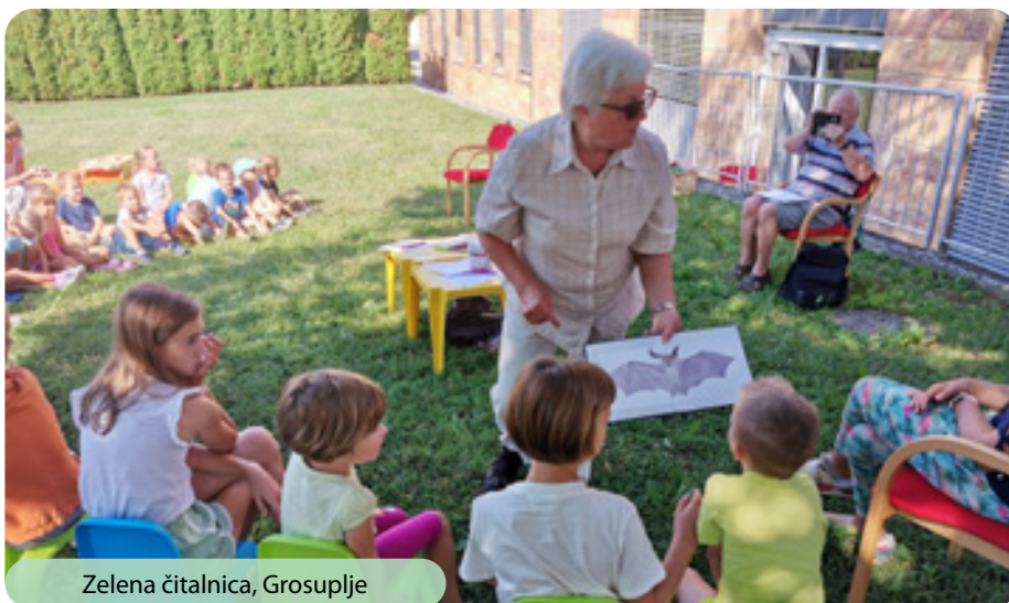
Zelena čitalnica, Grosuplje

V okviru projekta Občine Grosuplje Playful Paradigm smo v Mestni knjižnici Grosuplje skozi vse poletje na SREDINIH