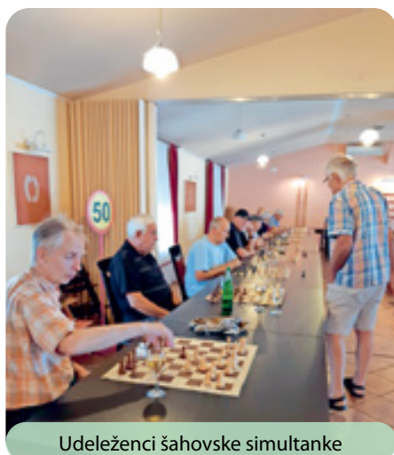
Udeleženci šahovske simultanke