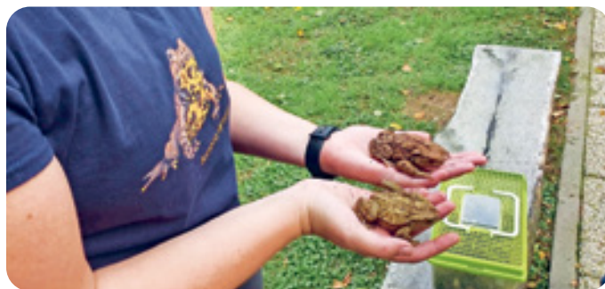
V oktobru so nas obiskali tudi učenci z OŠ Brinje in spoznavali značilnosti kraškega sveta Radenskega polja ter se поблиže spoznavali s čudovitim svetom dvoživk.