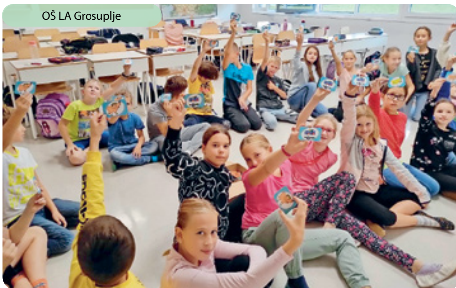
OŠ LA Grosuplje