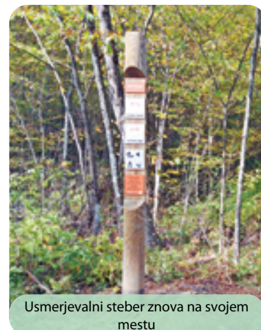
Usmerjevalni steber znova na svojem mestu