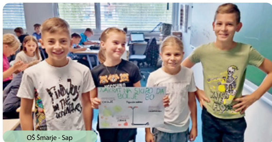
OŠ Šmarje - Sap