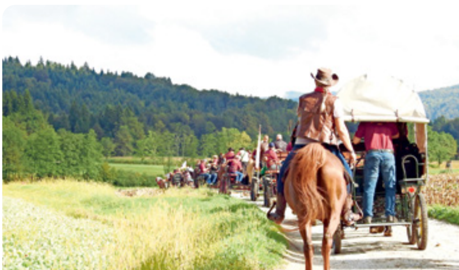
Kot na divjem zahodu smo odjezdili proti dolenskem vzhodu.

bolj sproščeno namestili okoli kočice. Po navodilih starih furmanov konji takoj po obremenitvi ne smejo piti, zato smo z napajanjem počakali vsaj pol ure.