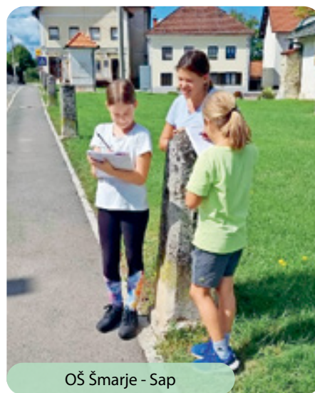
OŠ Šmarje - Sap