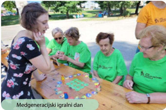
Medgeneracijski igralni dan