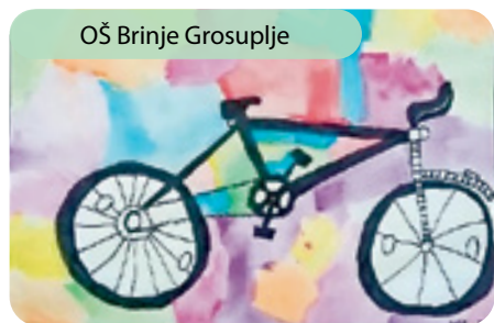
OŠ Brinje Grosuplje

prizadevali, da bi učenci in učitelji v šolo čim večkrat prišli peš, s kolesom ali skijem. Skrb za okolje je pomembna in vsak od nas lahko že s hojo do šole naredi veliko za naravo. Pripravili so plakate, si ogledali različne videoposnetke ter se veliko pogovarjali na temo trajnostne mobilnosti. Spoznavali so prometne znake in pravila ter osnove prometne varnosti. Učenci petih razredov so imeli v torek, 20. 9. 2022, športni dan z naslovom »S kolesom v promet«. Preizkusili so novi kolesarski poligon in opravili še vožnjo s kolesi po cesti ter se udeležili prireditve ob dnevu mobilnosti, ki je potekala na grosupeljski tržnici. Evropski teden mobilnosti so s pohodom na Kucelj zaključili učenci OŠPP.