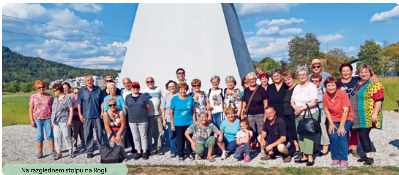
Na razglednem stolpu na Rogli