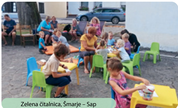
Zelena čitalnica, Šmarje – Sap