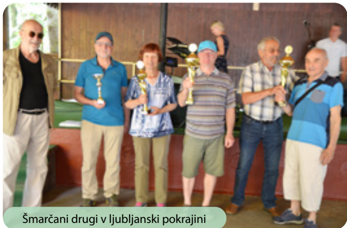
Šmarčani drugi v ljubljanski pokrajini