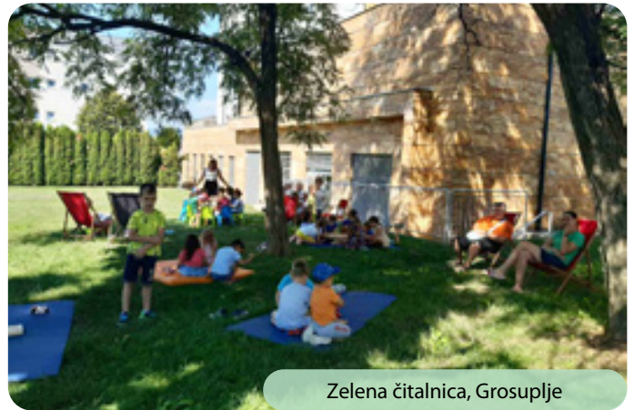
Zelena čitalnica, Grosuplje

Počitniški čas je res minil v znamenju visokih temperatur in sušnega obdobja, vendar smo jim v Mestni knjižnici Grosuplje kljubovali s pestrim dogajanjem, kjer so se udeleženci lahko sprostili in pobegnili v svet domišljije, igre in ustvarjanja.