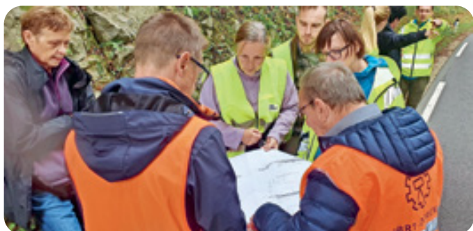
Usklajevalni sestanki za vzpostavitev trajne varovalne ograje in podhodov za dvoživke na cesti med Velikim Mlačevim in Veliko Račno (Foto: Tina Stepišnik, oktober 2022)

Uspešno izvedenemu monitoringu dvoživk v preteklih dveh letih je sledilo načrtovanje rekonstrukcije ceste med Velikim Mlačevim in Veliko Račno za umestitev trajnih varovalnih ograj in podhodov za dvoživke. Med pristojnimi inštitucijami trenutno potekajo usklajevanja glede umestitve trase in podhodov za dvoživke, z rekonstrukcijo pa bomo začeli v prihodnjih letih.