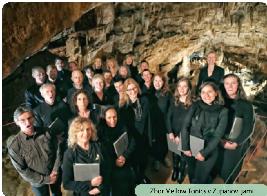
Zbor Mellow Tonics v Županovi jami