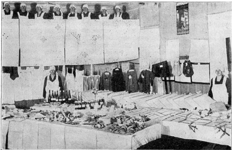
Razstava 10 tedenskega kmet.-gospodinjkega tečaja v Višnji gori.

Skozi vsa tisočletja lahko ob razvoju dela in kulture zasledujemo močni vpliv žene in kako se je v delu in izkušnjah, z ljubeznijo do družine in rodne grude dvignila do pomembnega stališča, ki ga ima danes v človeški družbi. Vsaka izprememba v zgodovini prošlosti postavlja ženo v drugačno luč; vsaka pa dokazuje, kako je žena zmožna prilagoditi se vsakršni možnosti v življenju, kako je darovita in iznajdljiva in kako močna in krepka je. Seveda se pokaže v raznih zgodovinskih dobah tudi marsikatera senčna stran na ženskem značaju, čemur pa se me v sedanji dobi nikakor ne smemo čuditi. Saj je bila žena v prejšnjih časih