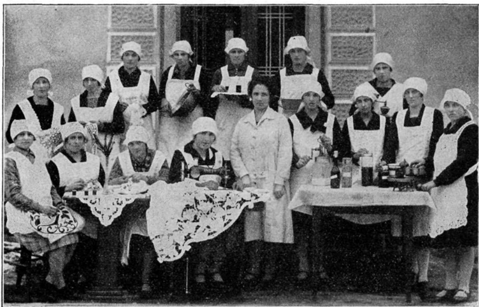
Desettedenski kmet.-gospodinjski tečaj v St. Pavlu pri Preboldu.

Umevno pa je, da žena, ki se zaveda tega svojega dela za splošnost, želi in hoče to delo vršiti kar najbolje, najuspešneje, najracionalneje. Zato je že izza davna gledala po večji, globlji in popolnejši izobrazbi v tej smeri ter se je je oprijela, kjerkoli ji je bila dostopna.