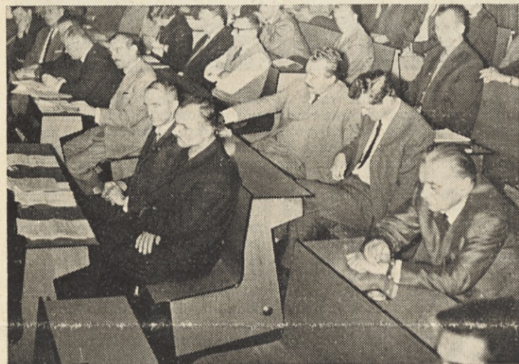
Skupina udeležencev konference o samoupravljanju

5. Za uspešno delo organov upravljanja DE je potrebna ustrezna obveščanost. Pripombe kažejo, da je za nekatera neresena vpra-