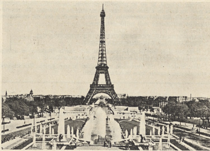
Pariz pa je tudi mesto lepote. Vodometi, v ozadju Eifflov stolp

»Bomo že prijete vodiča!« so grozile. Pri večerji so mu res pošiljale vseh sort pisane poglede čez mizo, po večerji pa se je jeza nekoliko polegla in so se vdale v usodo, da bodo 4 dni le preživele