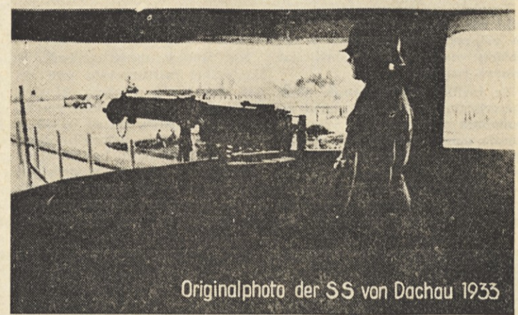
Originalphoto der SS von Dachau 1933

nik so odkrili v spomin vsem tistim žrtvam fašizma in internirancem, ki so daleč od svoje rodne domovine umirali za svobodo, ki je niso nikoli dočakali. Med drugimi je v tem groznem taborišču ostalo veliko številno Jugoslovancev, največ Slovencev. To so bili naši najboljši ljudje, ki so ostali zvesti rodni zemlji, čeprav je njihova kri večkrat škropila tujo zemljo. Domovina jih ni pozabila. V srcih nas vseh žive in nas uče spoštovati pravico, za katero so dali svoje dragoceno življenje. Tudi v naši skupini je bilo nekaj preživelih internirancev. Tovariši, oz. preživeli interniranci ne govore mnogo. Njih srca in izrazi obrazov nemo govore: »Ljudje vsega sveta, ne