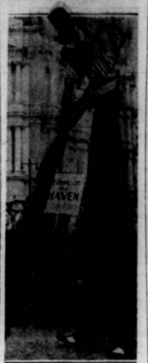
V Philadelphiji so se delavci na prvomajski proslavi ponorečevali tudi iz Chamberlainove "marele" in iz mareli sploh, kot prica ta karikatura. Izdelovalci dežnikov pa pravijo, da jim je Chamberlain napravil sijajno reklamo ne da jim bi bilo treba kaj plačati zanjo.