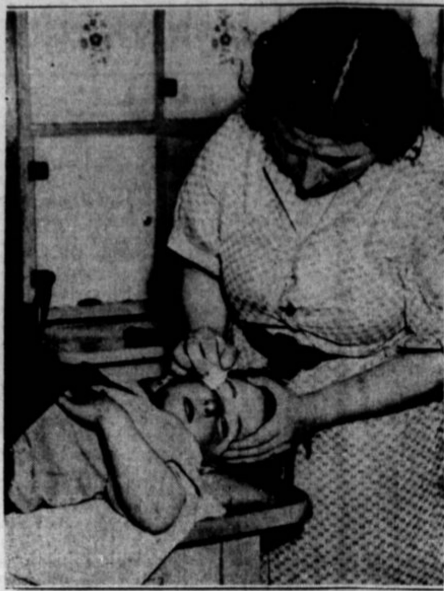
V Everettu, Mass., je bila stavka pristaniških delavcev. Družba je našla skrobe. Stavkarji so piketirali, policaji pa prišli nagnje s plinskimi bombami. Plin je dosegel tudi otroka, ki ga vidite na gornji sliki, in njegovo mater. Predstavlja jo, ko mu izvija oči, efektirane od strupenega plina. Ne on ne ona nista bila prizadeta v stavki, a plin ju je vendarle dosegel.

gal Angeli, dokler ona dva ne vstaneta. A sta bila tudi kmalu do.